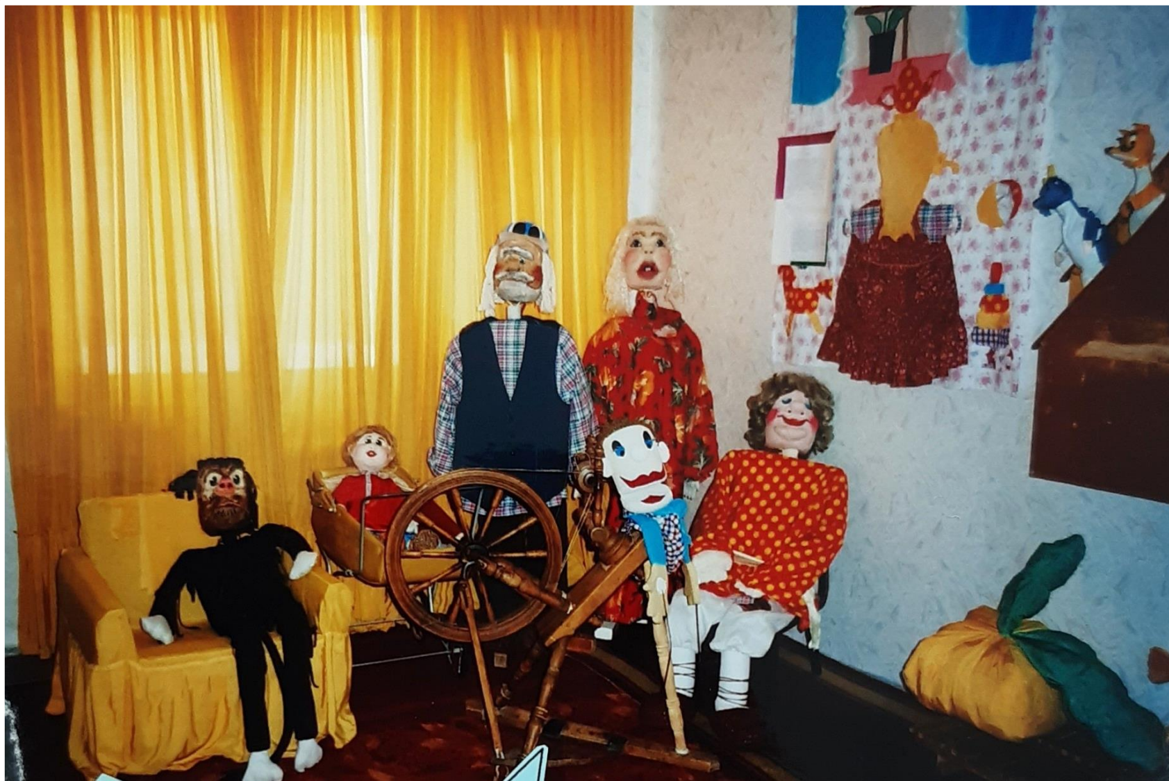
Музей персонажей кукольного театра «Библиоша».