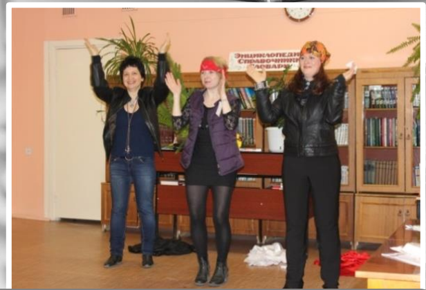
Юбилейный вечер в библиотеке. 40 лет – это возраст!!!