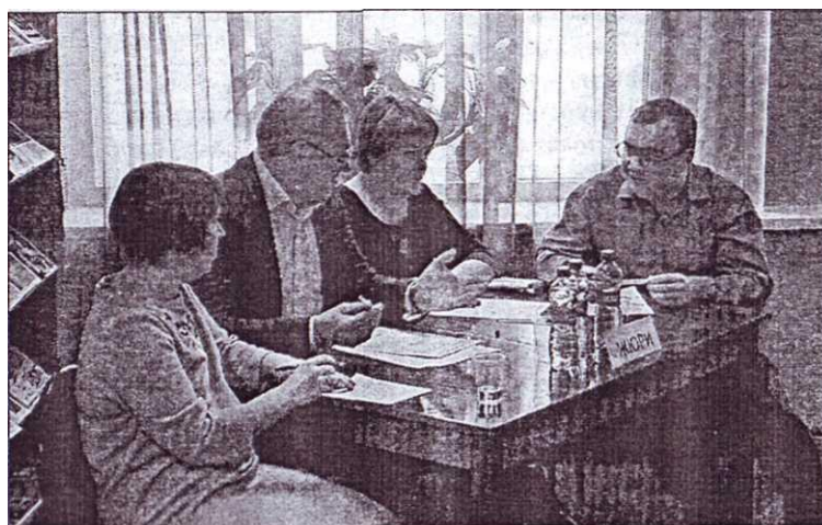
Строгое жюри совещается

С каждым годом растёт число участников, на этот раз в мозговом сражении сошлись восемь команд старшеклассников. В третий раз в игре приняли участие ученики школы № 3 (дважды они входили в тройку лидеров). На этот раз в состав команды вошли представители 8-х и 9-х классов.