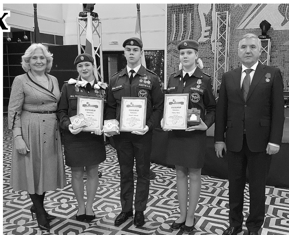
Школьников наградили за общественно полезную деятельность