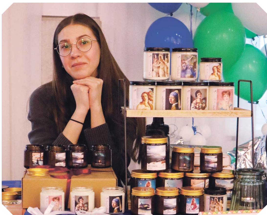
Свечи Дианы Кравцовой как отдельный вид искусства.

городского Дворца культуры состоялась традиционная предновогодняя ярмарка изделий от местных умельцев, людей, которые своими руками создают настоящие шедевры! Всякий раз, приходя сюда, я поражаюсь, как много по-настоящему талантливых земляков живёт рядом.