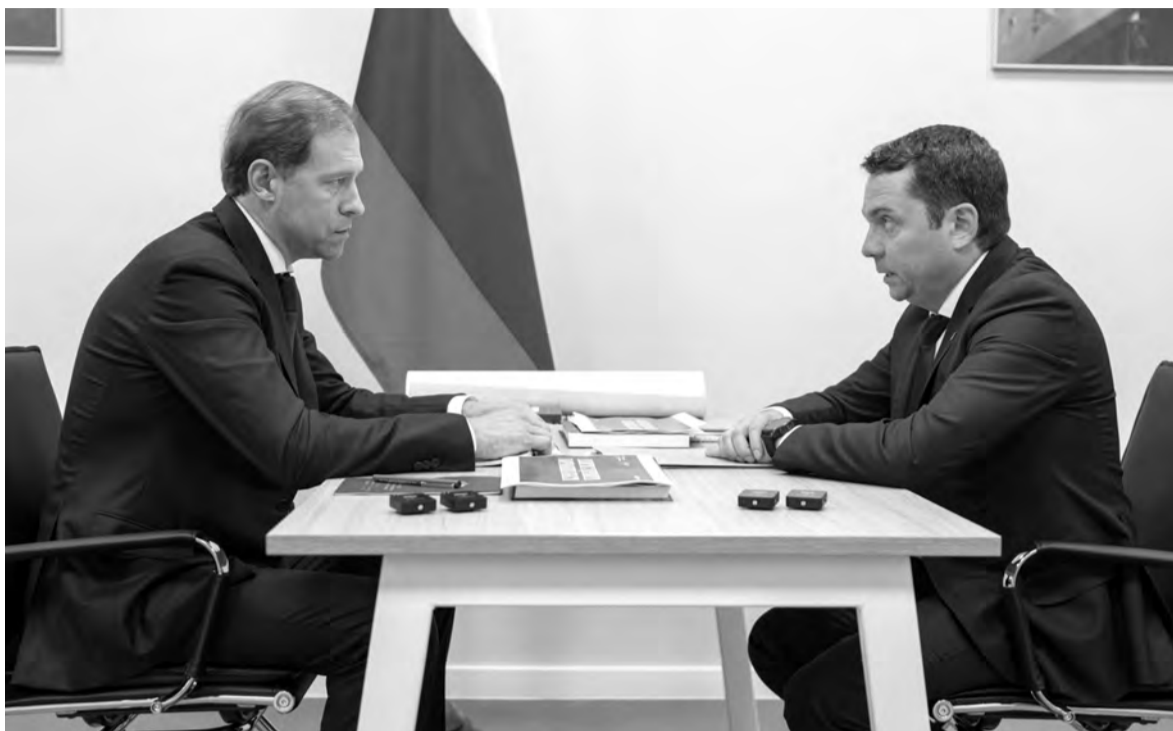
Денис Мантуров и Андрей Чибис обсудили ряд важных для Кольского Заполярья вопросов

– Плотность загрузки морских коридоров сегодня очень высока. И число барж, танкеров и других типов судов толь-