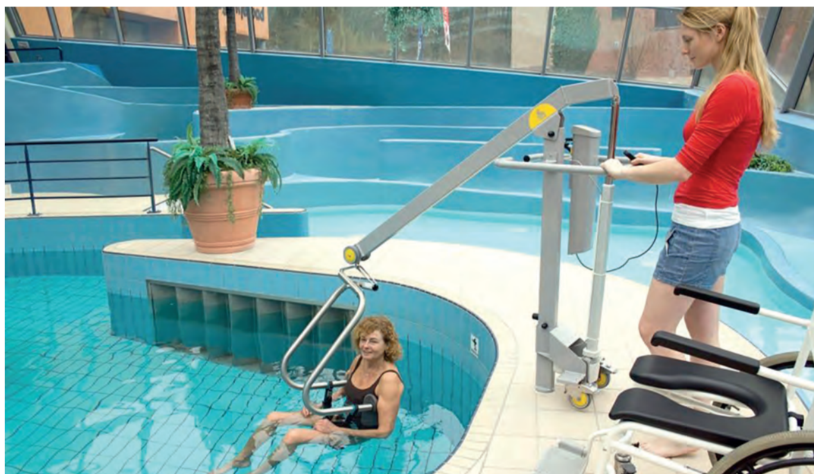
Скоро в городском бассейне появится такой механизм для маломобильных посетителей

то, что мы уже видим, вдохновляет на перемены.