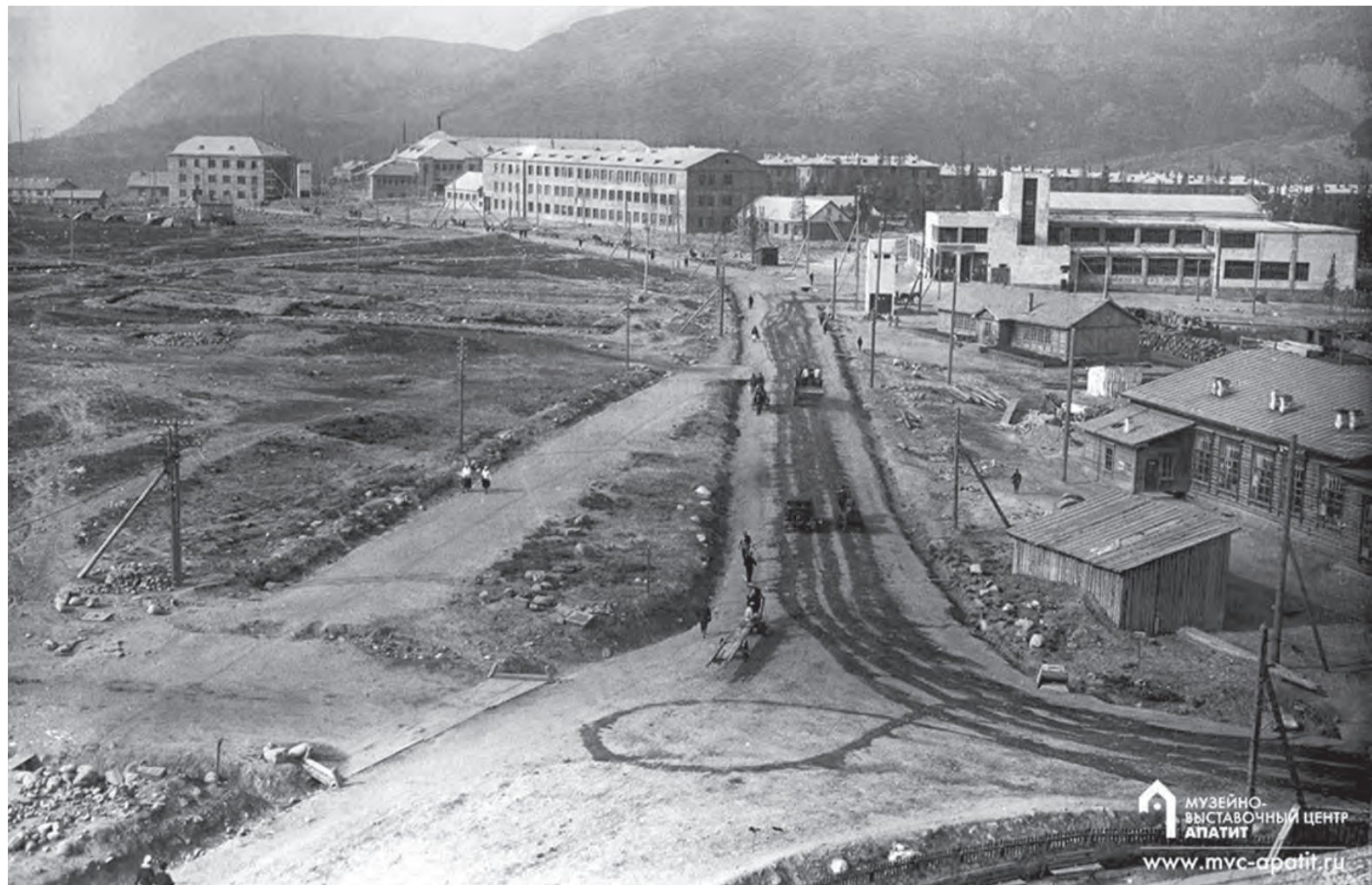
Строительство Кировска. 1930-е гг.