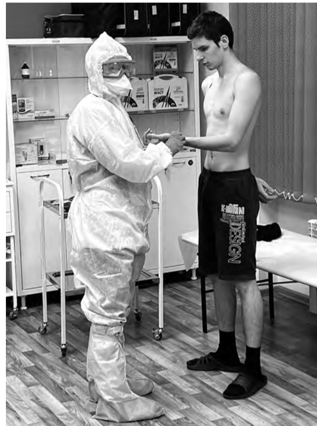
Практика для будущих фельдшеров