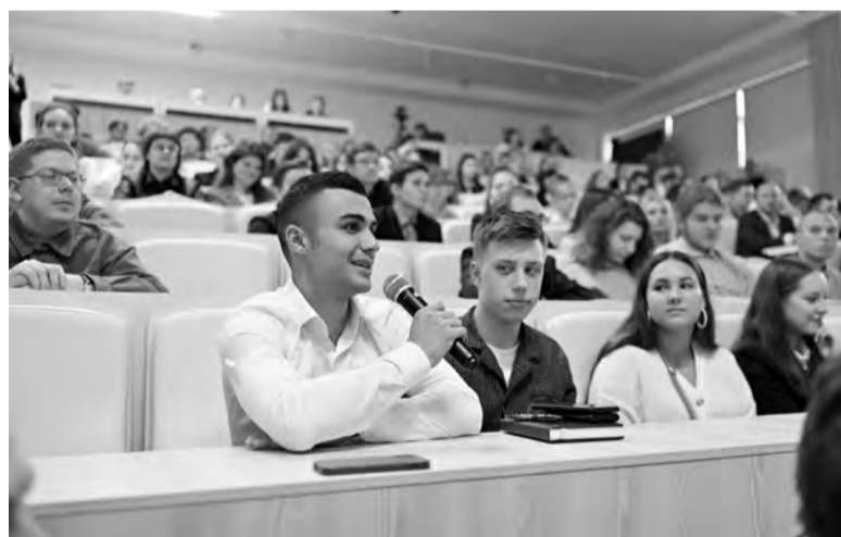
Студенты МАУ активно общались с высоким гостем

Рассуждая о правильности выбора направления подготов-