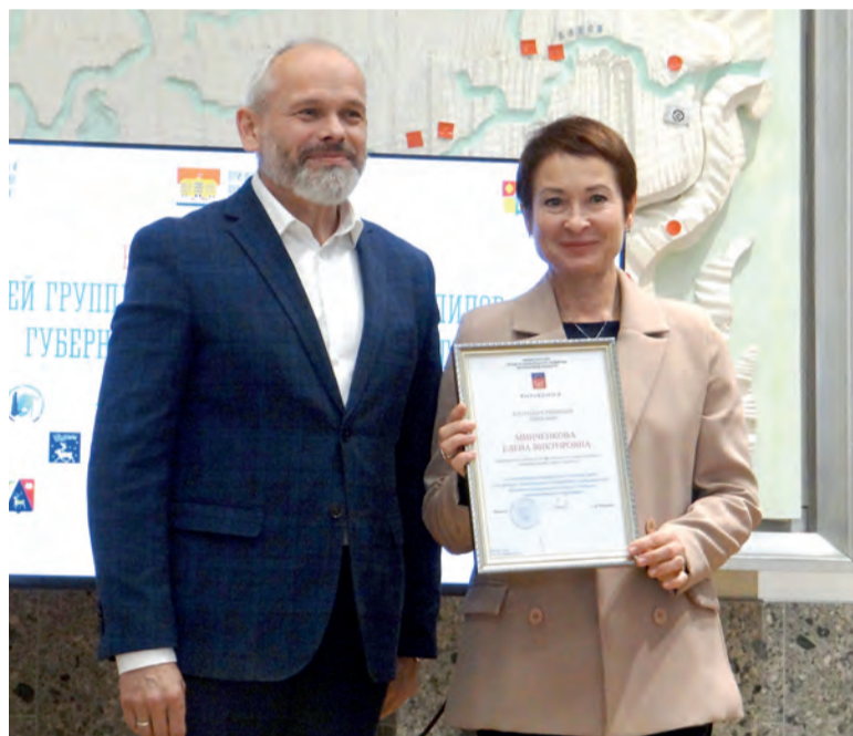
Благодарность специалистам, воплощавшим проекты в жизнь