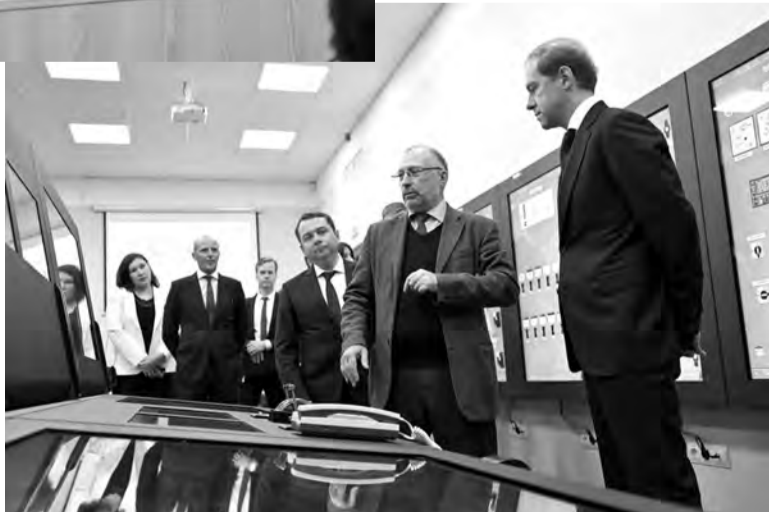
Зам. председателя правительства РФ оценил возможности Арктического университета