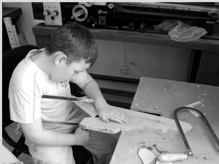
Дети с особенностями развития хорошо умеют работать руками

Апатиты. В школах города открыли новые профильные классы.