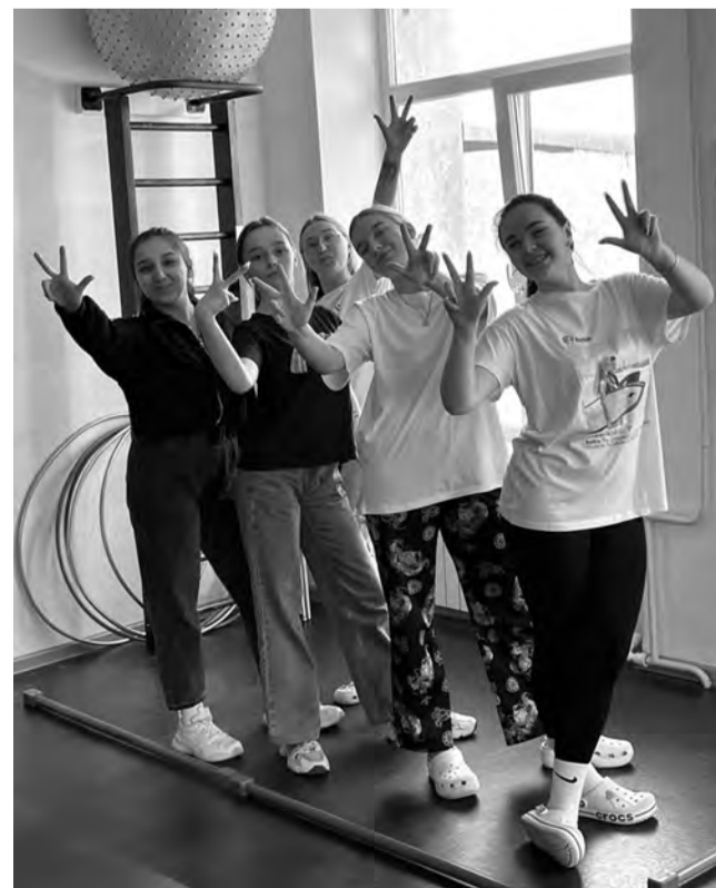
Выпускники медкласса смогут продолжить обучение по профилю