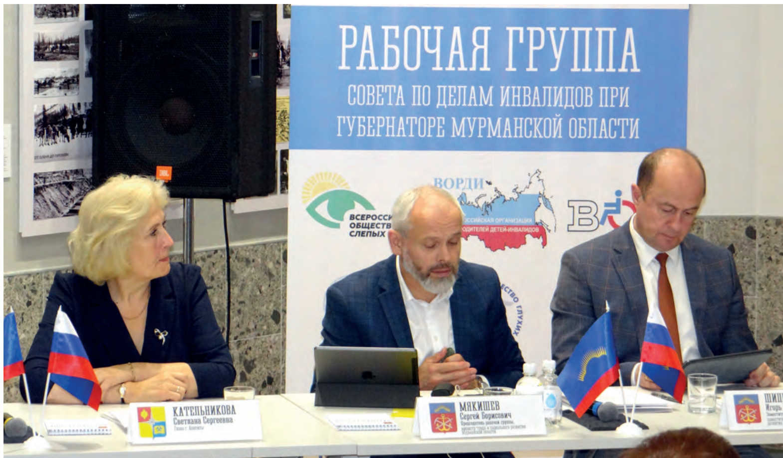
Город достойно представил свой многолетний опыт по созданию доступной среды

Апатиты. Здесь провели заседание рабочей группы регионального совета по делам инвалидов.