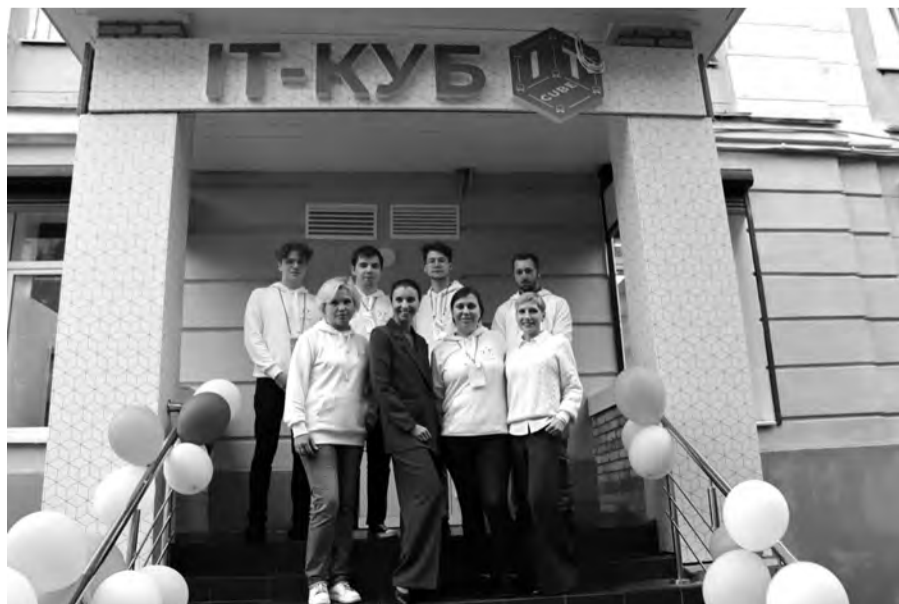
Коллектив «ИТ-куба» приглашает на занятия всех желающих