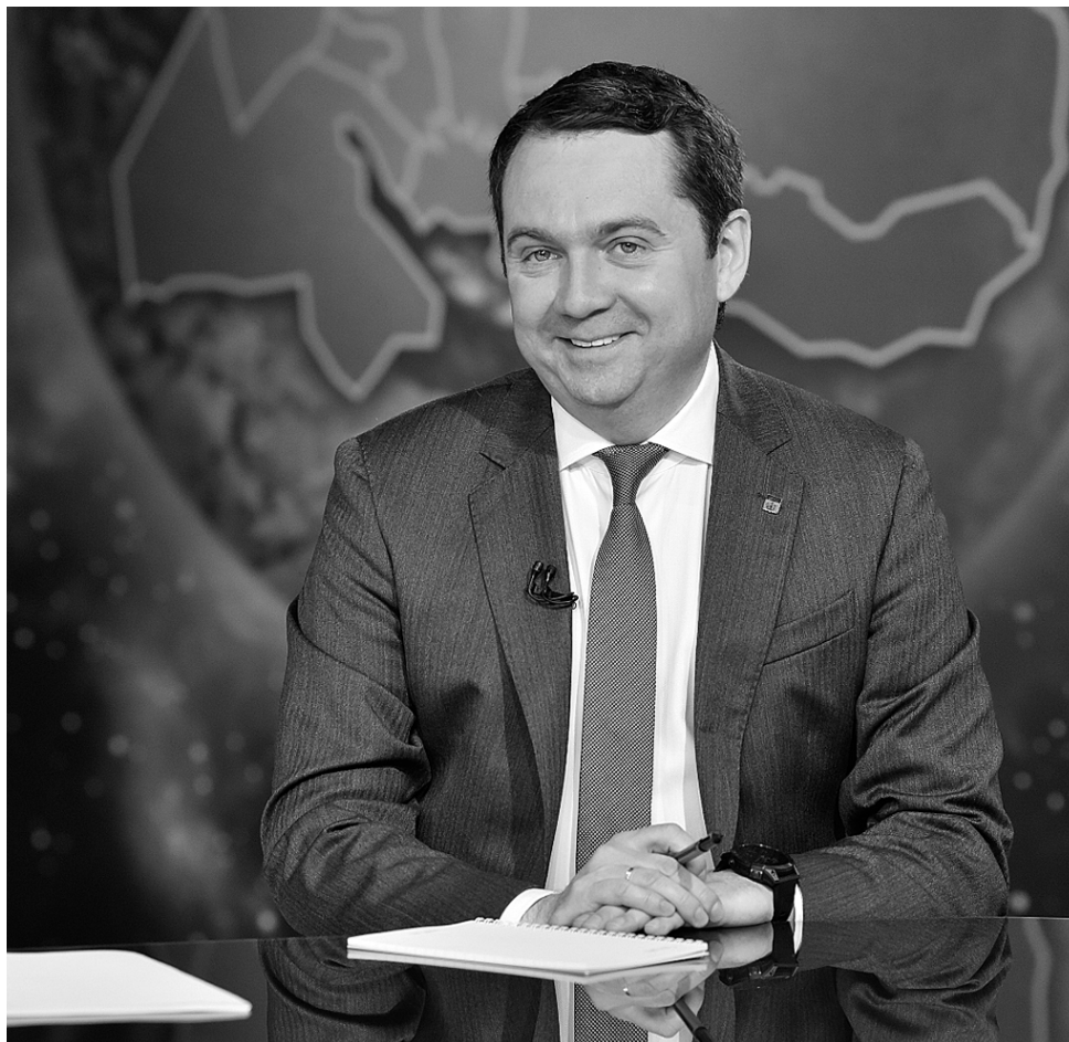
Андрей Чибис: «В регионе сформирована чёткая система мер поддержки участников СВО и их семей»

Также Андрей Чибис сообщил, что «Арктическая ипотека» может стать дополнительным инструментом для масштабирования и увеличения жилищного строительства в нашем регионе. Губернатор подчеркнул, что поддержку в этом вопросе оказывали глава мин-востокразвития Алексей Чекунков и вице-премьер России Юрий Трутнев.