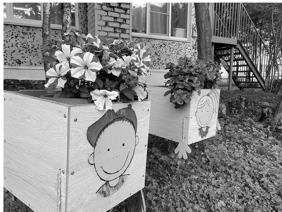
Такие милые клумбы украшают детский сад № 1

Дебютанты конкурса «Цветущий город» – воспитатели детского сада на проспекте Ленина, 39а. Труды работников садика, детей и родителей оценила конкурсная комиссия – сообщает пресс-служба администрации города. А сотрудники детского сада № 1 стали уже постоянными участниками конкурса «Цветущий город» и, к слову, неоднократными его победителями. Этим летом на территории их дошкольного учреждения тоже красиво, ярко и уютно!