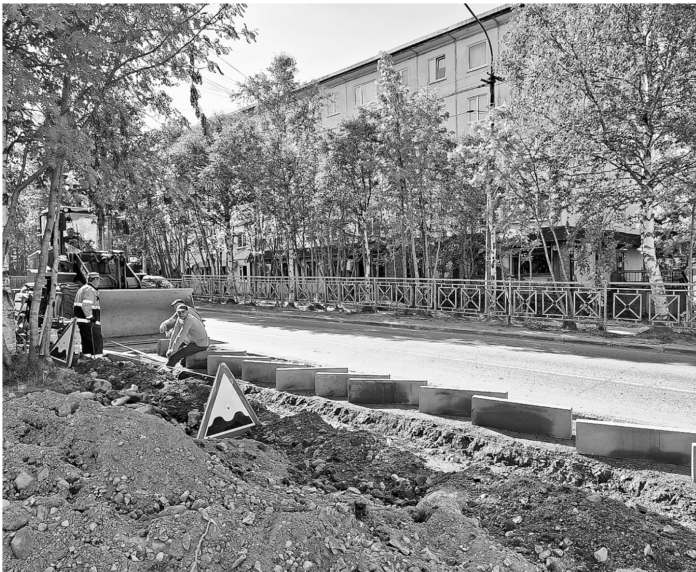
Замену труб завершат до начала отопительного сезона