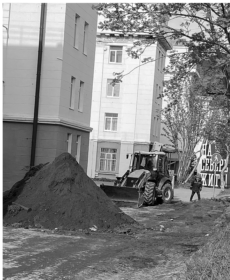
В Кировске начали ремонтировать дворы