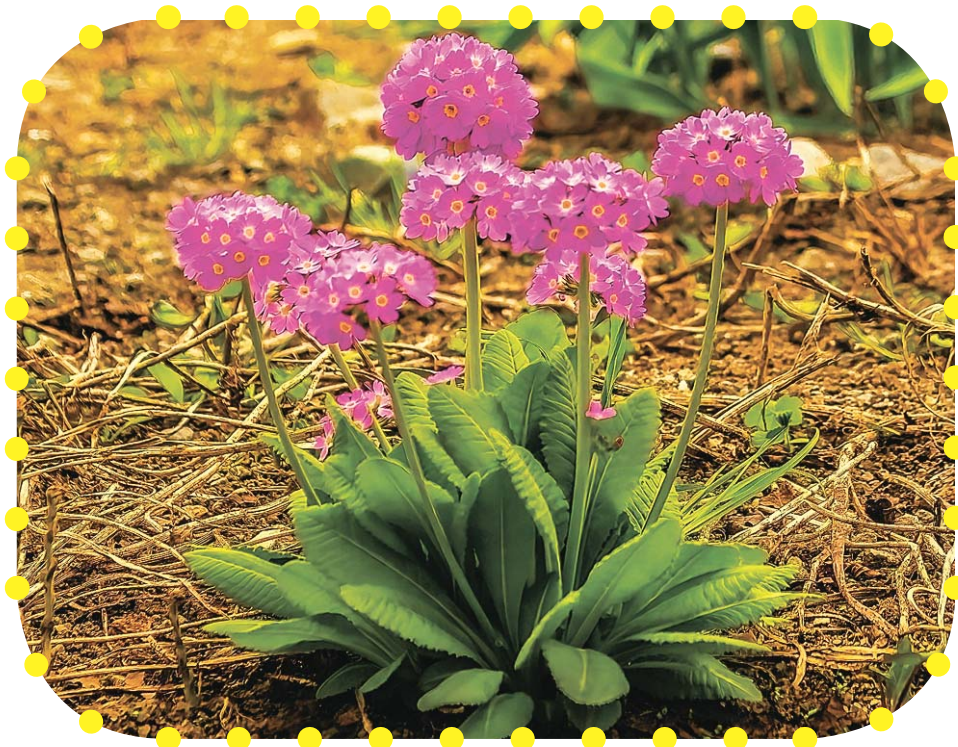
Первоцветы во дворах по улице Кирова.

Кировск. Продолжается приём заявок на конкурс «Цветущий город». В этом году в нём планируют участвовать АНО «ДРОЗД-Хибины», конный клуб «Ласточка» и жители домов на улице Кирова микрорайона Кукисвумчорр.