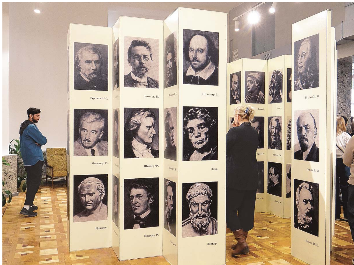
Инсталляция «Симфония разума» навсегда останется в библиотеке