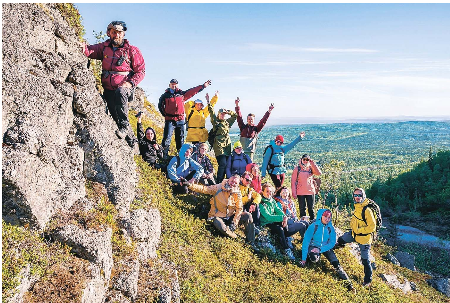
В Кировской «Школе гидов природного туризма в Хибинах» скоро начнётся двухнедельная практика