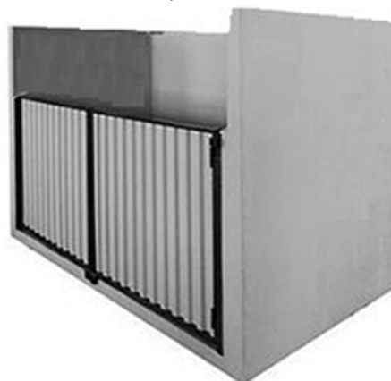
2.2. Контейнерная площадка под ЕвроКонтейнер на колесах закрытого типа (объемом 120, 240, 360, 660, 770, 1100 литра) для накопления ТКО, в том числе КГО. Внешний вид, комплектующие:

Габариты: ширина, глубина, высота от 1,5 м. Материал стен и основания: железобетон, бетон. Дополнительная опция: двери с замком (завдвижка). Мобильность модуля: возможность перемещения в сборе при помощи манипулятора. Тип модуля: закрытый/открытый (без дополнительных опций: дверей, запирающего механизма)».