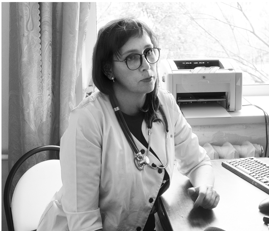
Екатерина Сулима, врач аллерголог-иммунолог – первый заместитель министра здравоохранения Мурманской области