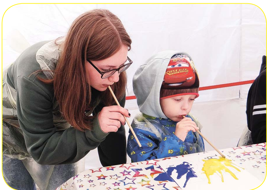
На празднике каждый мог найти интересное занятие по вкусу. Детям понравилось рисовать акварелью и... воздухом