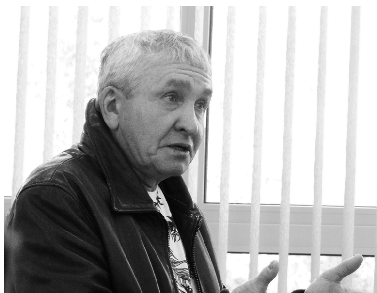
Апатитчане просят обустроить гостевые парковки