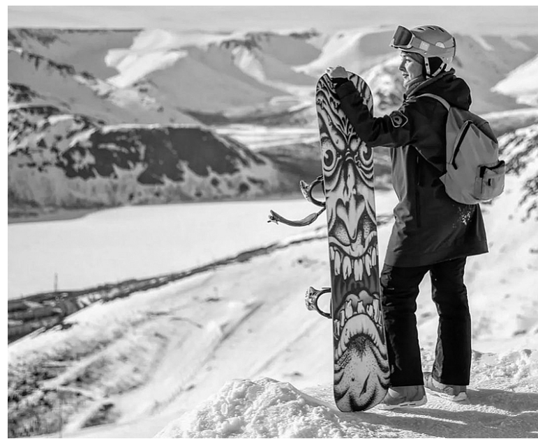
Хибины за квартал этого года посетили более 92 000 человек.

– В летнем сезоне для туристов и местных жителей состоится большое количество событийных мероприятий. В числе ключевых – Арктический фестиваль «Териберка», «Имандра Викинг Фест», «Гастро Индустри Фест» и многие