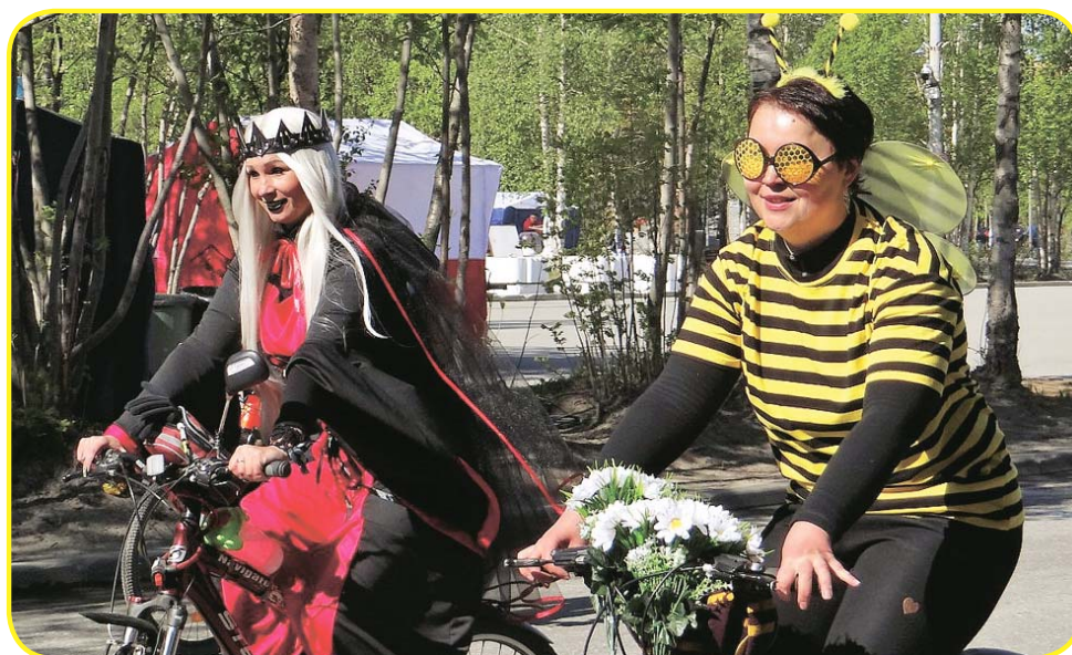
С каждым годом участники готовят всё более необычные и яркие костюмы!