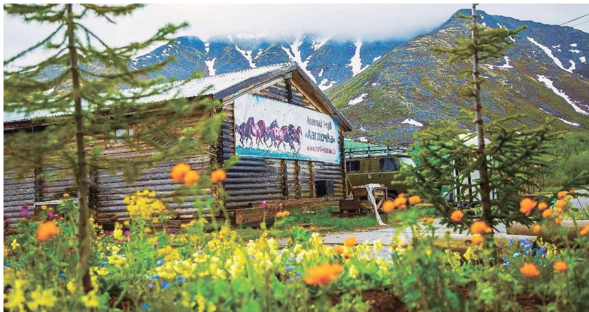
Конный клуб «Ласточка» удачно дебютировал в конкурсе в прошлом году