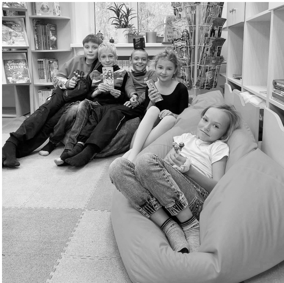
Современные библиотеки – место притяжения для жителей всех возрастов

Кировск. Глава администрации Юрий Кузин провёл встречу с сотрудниками библиотечной системы города. Одна из основных тем встречи – итоги работы администрации муниципалитета и правительства Мурманской области за последние четыре года. Во время встречи были сделаны акценты на развитии культуры в городе и регионе.