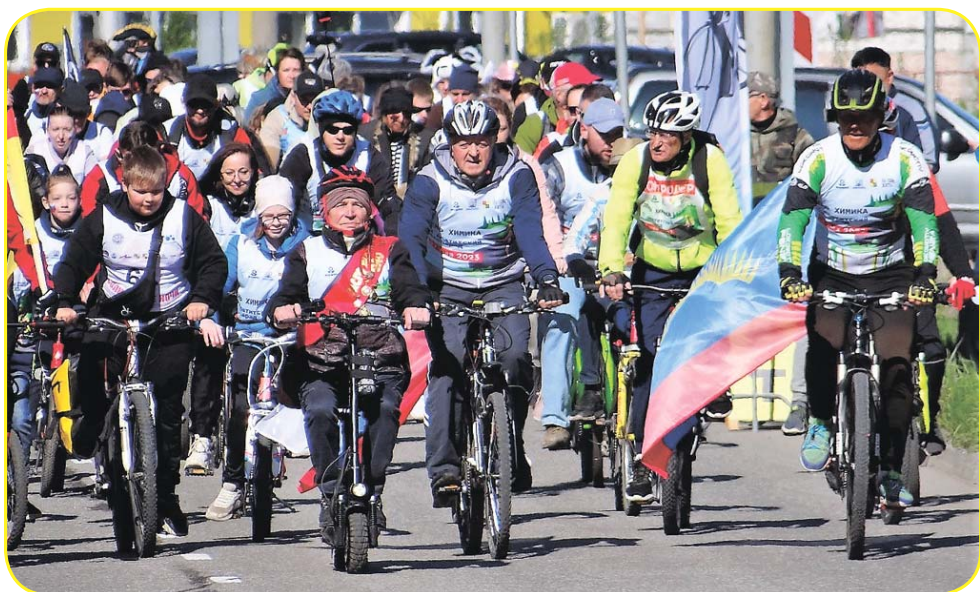
Апатитский велопарад, посвящённый Дню химика, стал визитной карточкой праздника