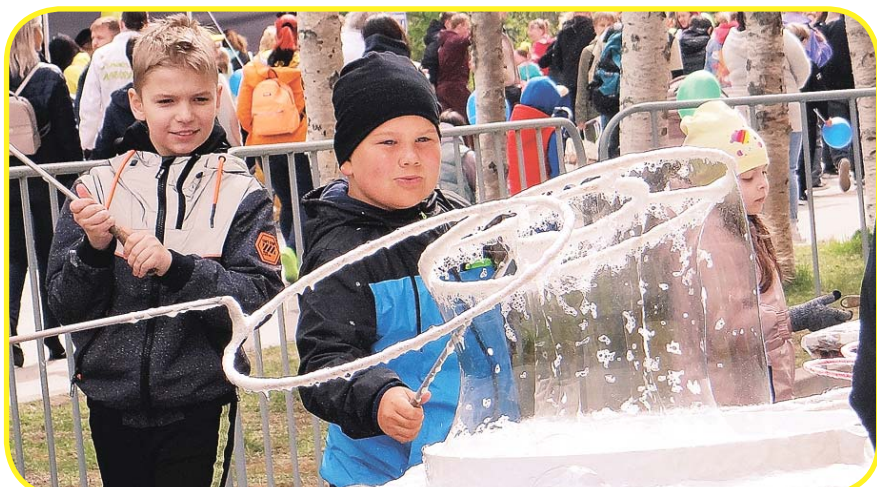
Мыльные пузыри – это волшебно