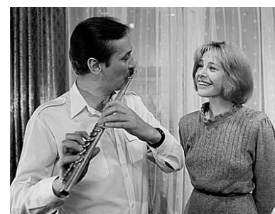
04.30 Х/ф «Заколдованный доллар» (12+)

06.00 «Коллеги» (12+) 06.40 Д/ф «Ехал грека. Путешествие по настоящей России» (12+) 07.30, 11.00 «Календарь» (12+) 08.00, 08.30, 09.00, 09.30, 10.00, 13.00, 14.00, 15.00, 19.00 Новости 08.05, 08.35, 09.05, 09.35 Отражение 10.10 «Преодоление». Николай Поликарпов (12+) 11.25 Х/ф «Дама с попугаем» (0+) 13.10, 14.05 Отражение 2 15.10 «Человек и судьба» (12+) 15.40 «На приеме у главного врача с Марьяной Лысенко» (12+) 16.20 «Песня остается с человеком» (12+) 16.30 «Вспомнить все» (12+) 17.00 М/ф «Сказка сказок», «Дарю тебе звезду» (12+) 17.35 Х/ф «Сверстницы» (12+) 19.20 Отражение 3 21.00 Х/ф «Вор» (16+) 22.35 «Свет и тени» (16+) 23.00 Х/ф «Заложники» (16+) 00.45 Х/ф «Ослепленный желанием» (16+) 02.25 Х/ф «Забывтая мелодия для флейты» (12+)