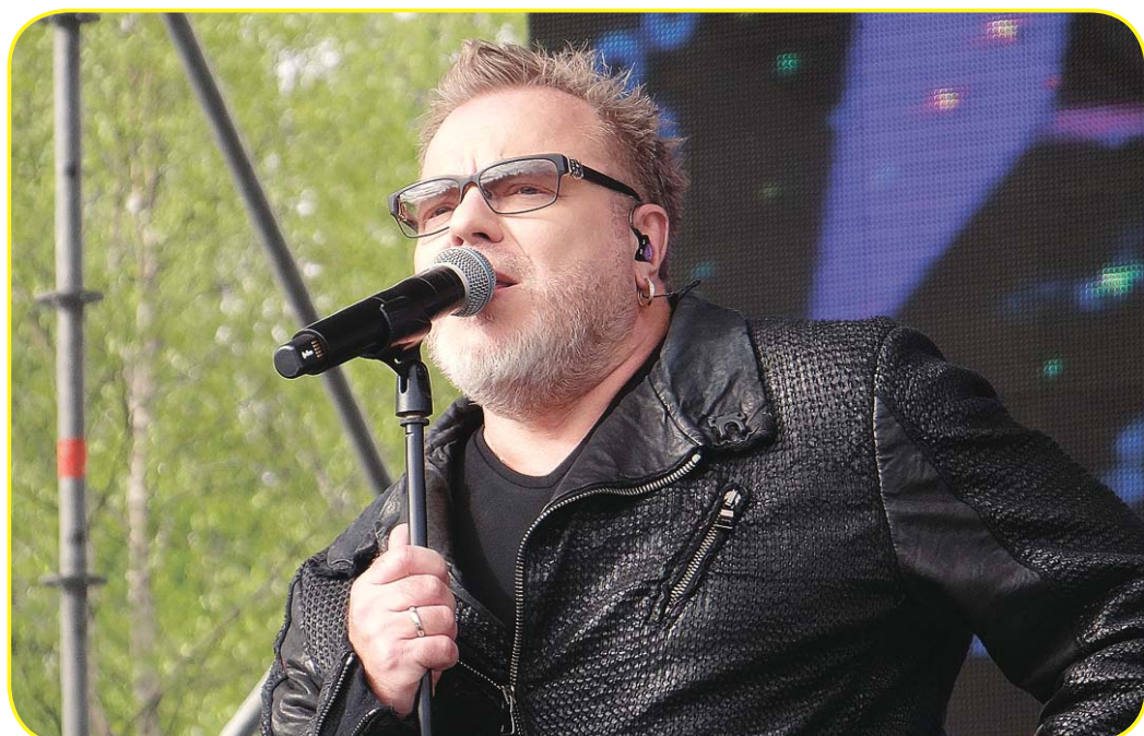
Владимир Пресняков-младший исполнял и любимые всеми хиты, и новые песни