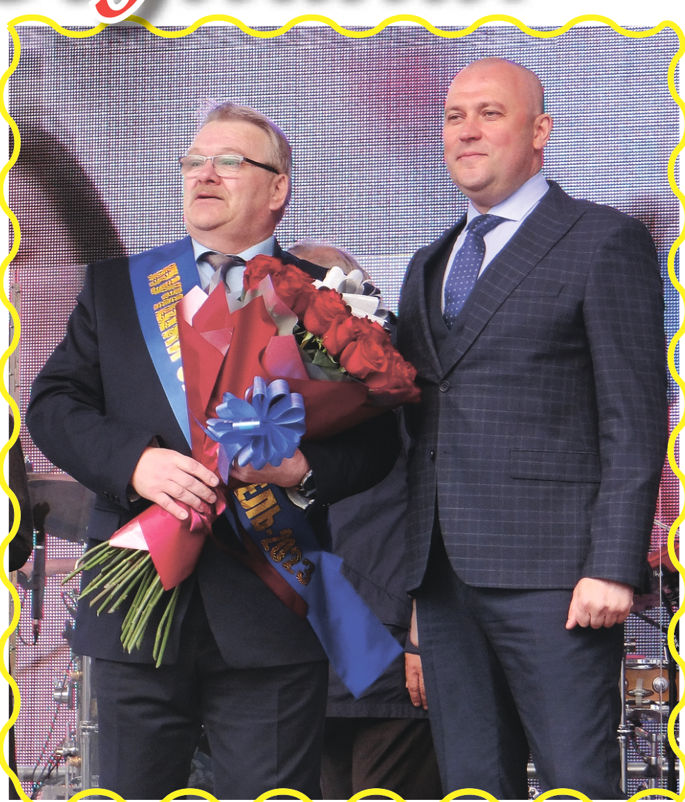
«Лучший обогатитель – 2023» – Игорь Усс!