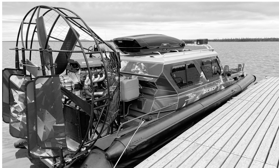
Теперь жители и гости города смогут прокатиться на аэролодках.

другие, – отметил Александр Елисеев, глава комитета по туризму Мурманской области.