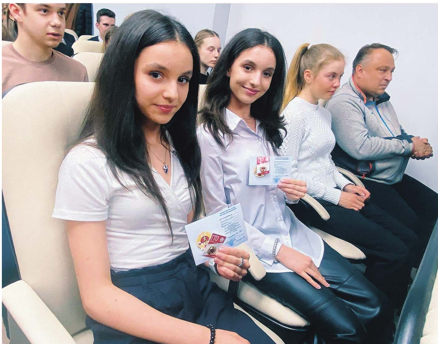
Верить в себя и свои силы – вот что важно для человека

Мурманская область. В отделении Социального фонда России по Мурманской области изменился номер телефона региональной горячей линии. С 4 мая северяне могут обращаться для консультации в региональный колл-центр ОСФР по новому номеру 8 (800) 200-12-60. Телефон центра работает с понедельника по четверг с 8.30 до 17.00, в пятницу с 8.30 до 15.00. Операторы центра консультируют по вопросам пенсионного и социального страхования, включая получение сертификата на материнский капитал или талонов на бесплатный проезд к месту отдыха, назначение пенсий или единого пособия, оформление выплат по инвалидности или путёвок в санаторий, уточнение статуса поданного заявления или сроков оплаты больничного листа.