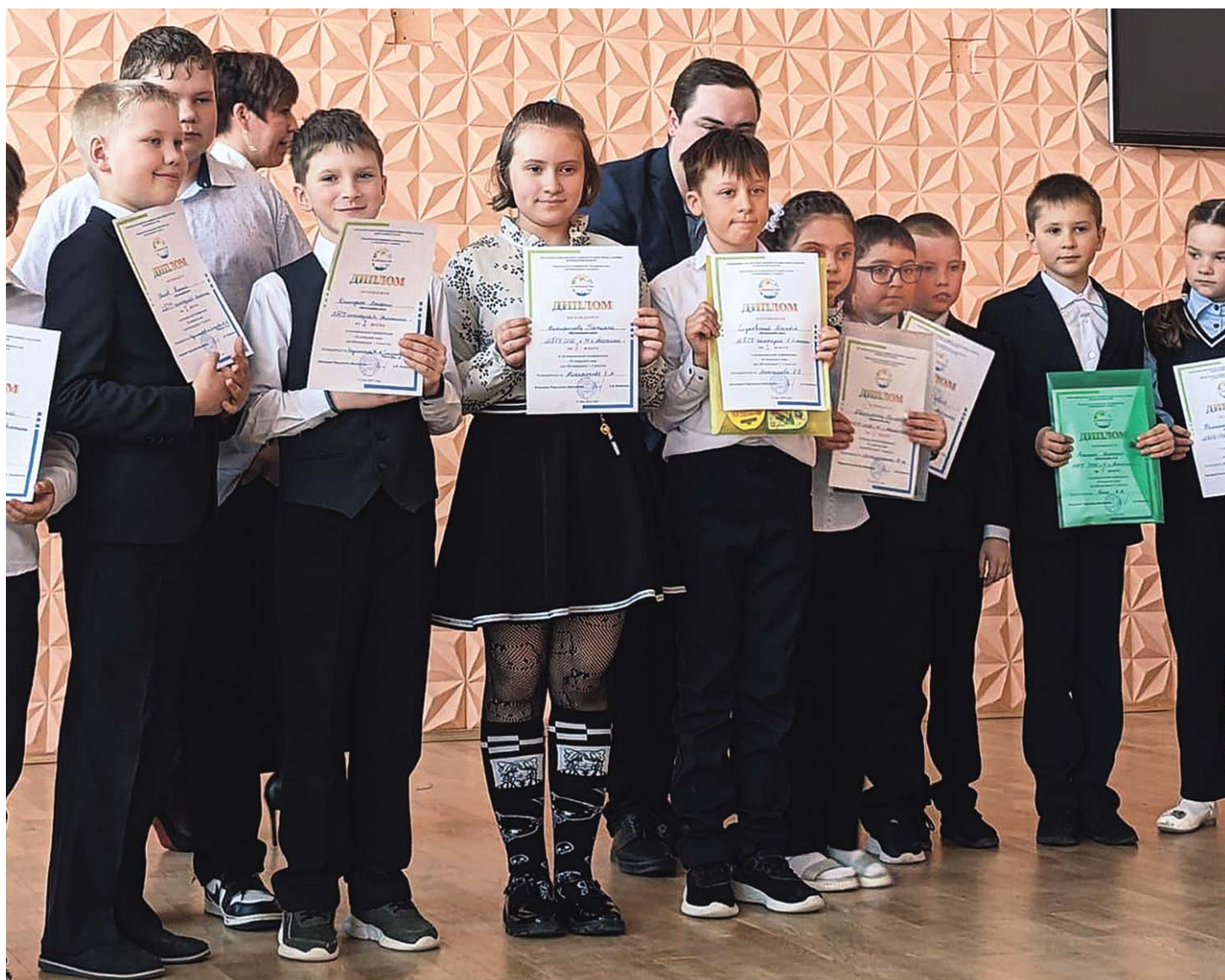
Победители и призёры конференции