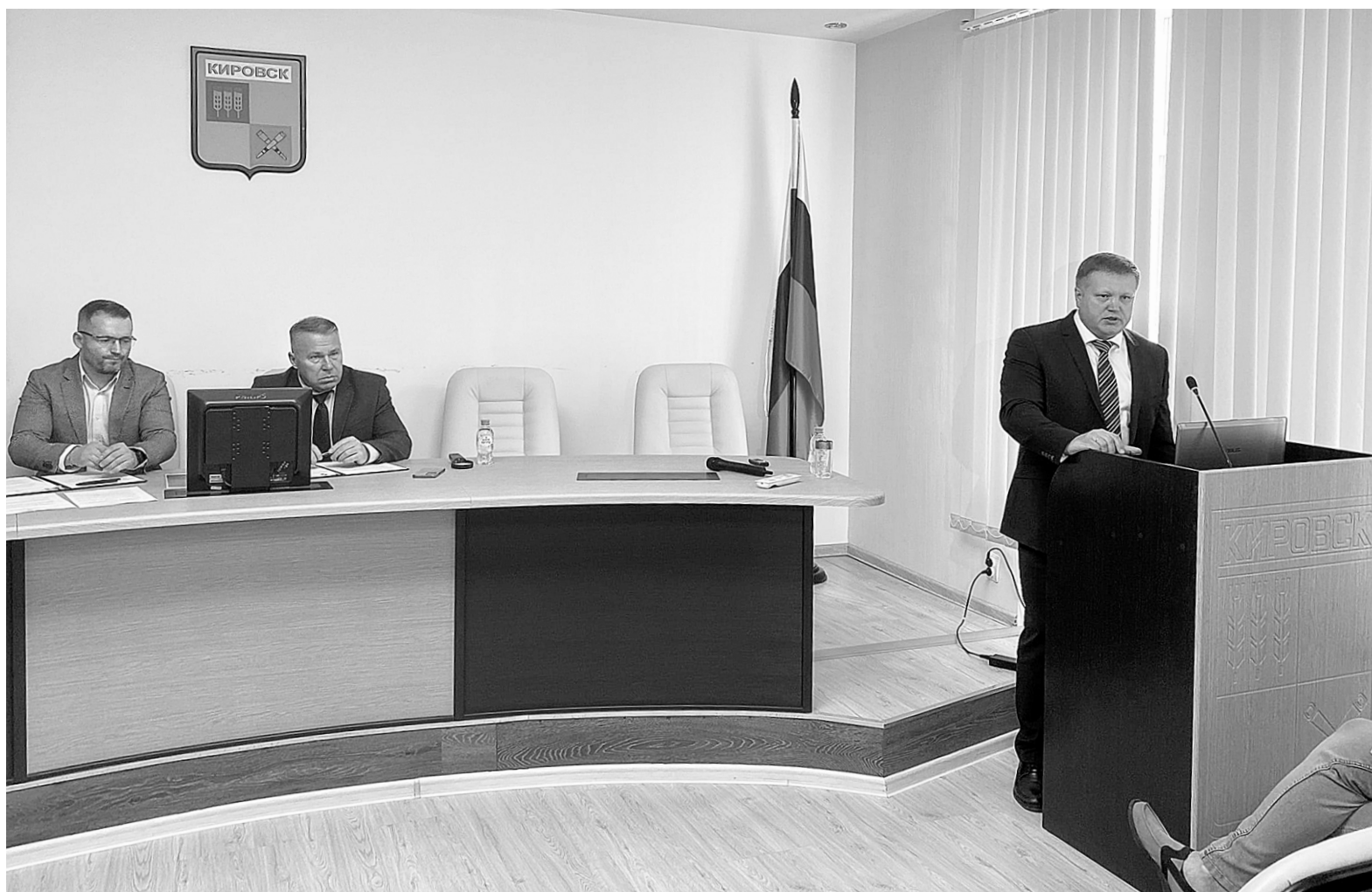
Юрий Кузин выступил с докладом о работе администрации перед депутатами