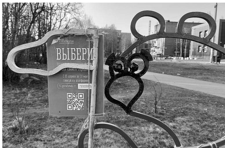
«Веломишки» призывают голосовать за благоустройство

В этот день собрали 110 мешков мусора. Не забывают активисты и о территории, запланированной к благоустройству в будущем году: пустырь у «Веломишек» остаётся аккурат-