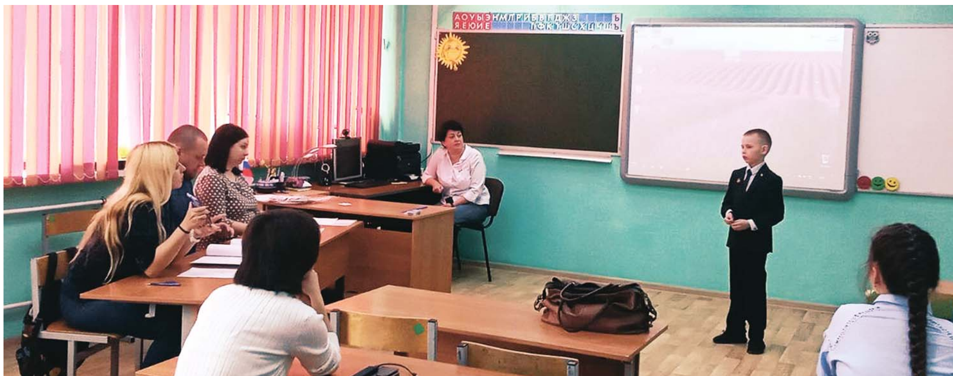
Авторы проектов отвечали на вопросы жюри со знанием дела