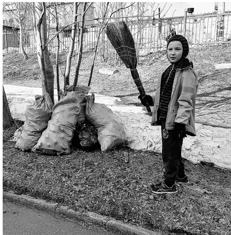
На субботник выходили и дети, которые работали наравне со взрослыми