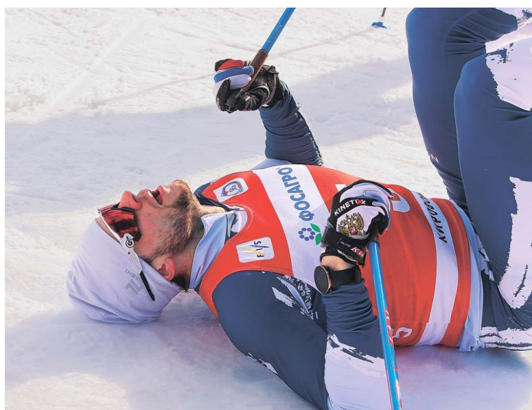
Так достаются в лыжном забеге заветные секунды результата