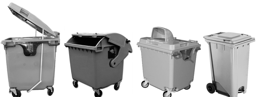
- материал: ПНД (HDPE) обладает повышенной стойкостью к ультрафиолетовому излучению, воздействию экстремально низких и высоких температур, а также обладает высокой химической устойчивостью;

- цвет: зеленый, красный, серый, желтый, синий, черный Опции: - крышка (съёмная) откидная/выдвижная; - колеса резиновые (оснащены опорами колес с тормозом и усилены с учетом возможных повышенных нагрузок, все металлические детали гальванизированы для защиты от коррозии);