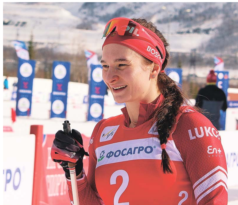
Олимпийская чемпионка, лидер сборной России Наталья Непряева

Это означает, что катают их хорошими траками каждый день. Точнее, ночь – слышно немного из гостиницы, как работают. Снег довольно быстрый, гораздо быстрее сибирского. И совсем ещё не