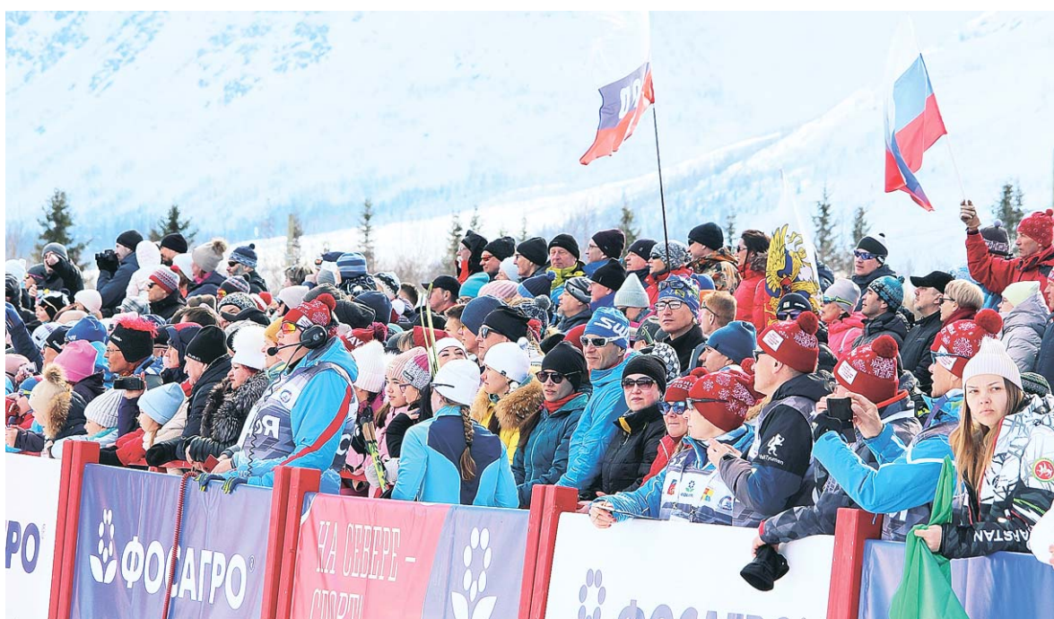
Стадион «Тирвас» собрал огромное число зрителей