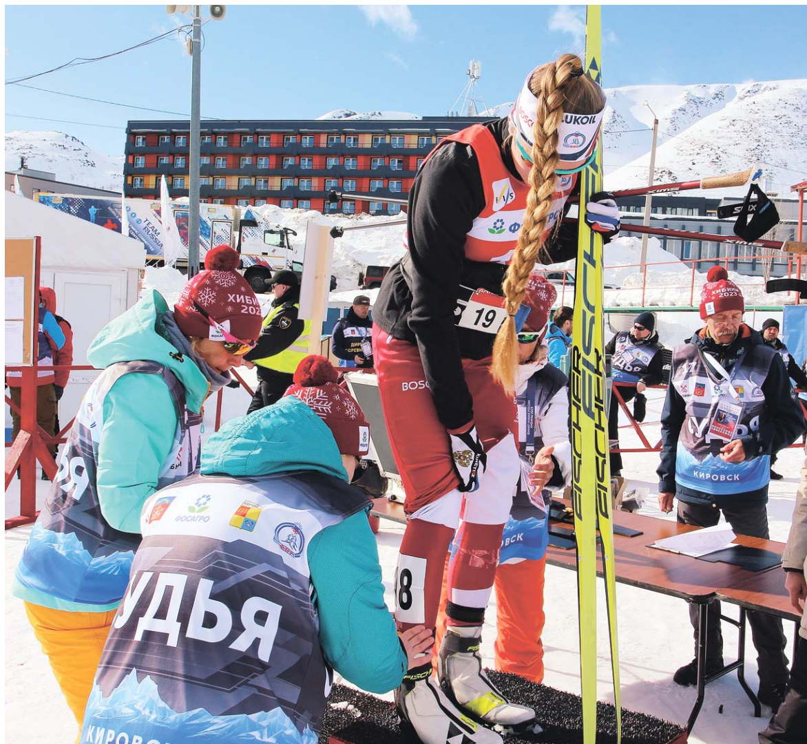
На каждый забег всем участникам крепят специальные чипы