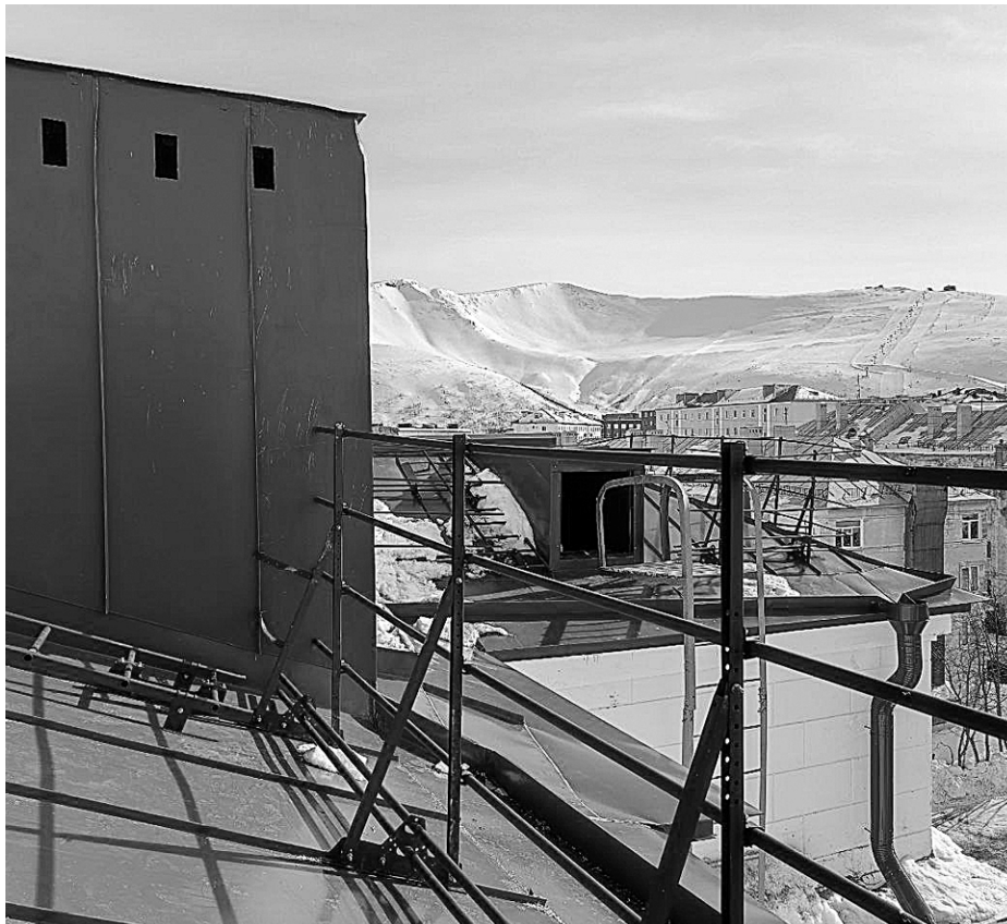
После ремонта крыши дома на проспекте Ленина выглядит достойно

Вера НИКОЛАЕВА, Ольга ИЛЬНИЦКАЯ