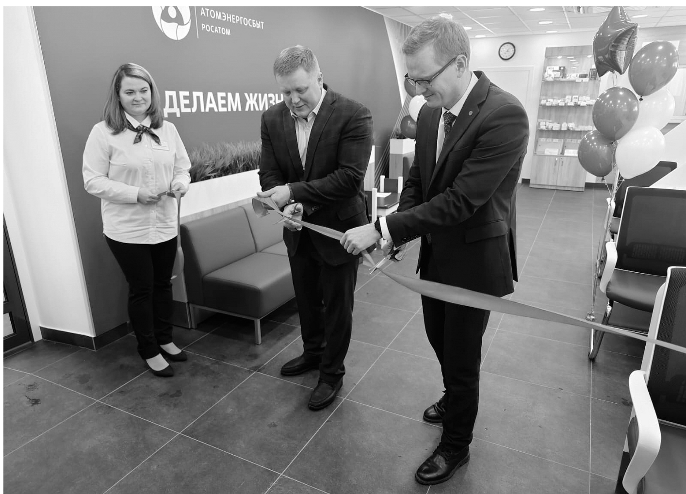
Традиционная красная ленточка в новом центре разрезана!