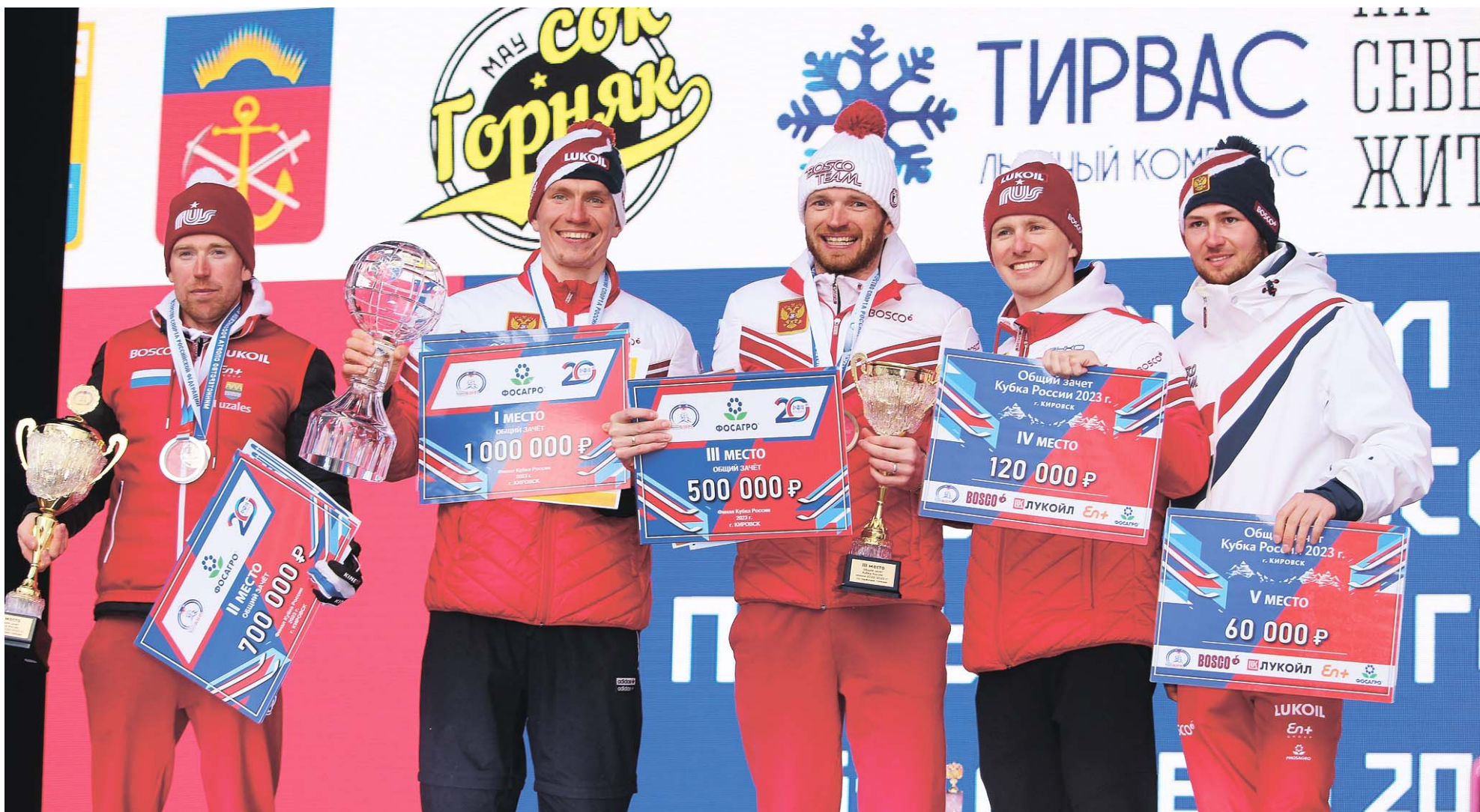
Благодаря компании «ФосАгро» победители и призёры Кубка России получили внушительные призовые