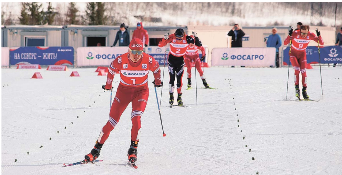
Вот он, победный финиш короля лыж Александра Большунова!