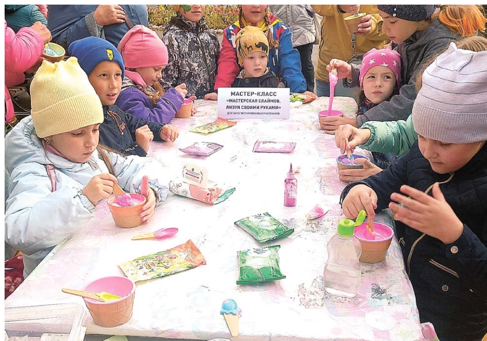
В парке «Огни города» работали интерактивные площадки