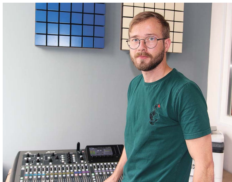
Студия звукозаписи открывает большие перспективы местным музыкантам

– Хочется, чтобы ребята ассоциировали это место с домом, где всё