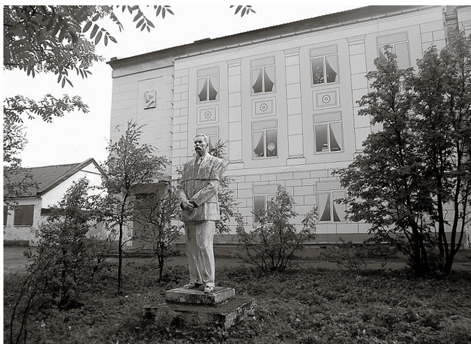
Школу № 1 для учеников закрыли в 2010 году. Здание пустовало ещё семь лет

В конце августа 1932 года школа готова к учебному году, она была очень красивой по тем временам.