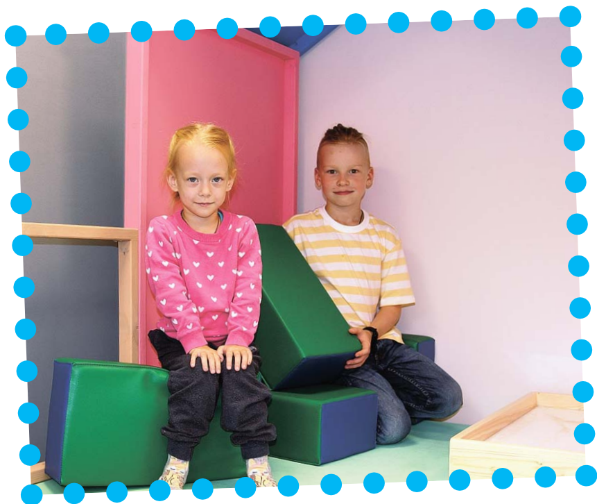
В «СОПКАХ» нашлось место и дошколятам