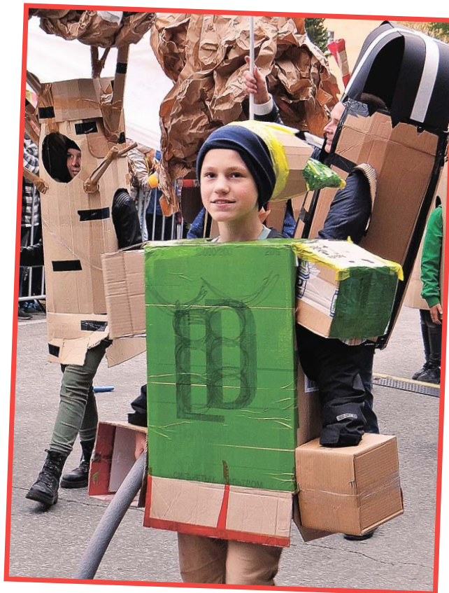
Шествие колонны в маскарадных костюмах: «люди-кристаллы», «люди-деревья», «люди Белой реки»...