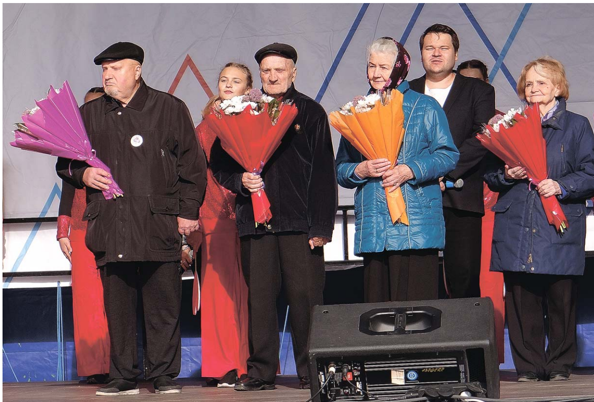
Город гордится своими жителями – почётными гражданами Апатитов