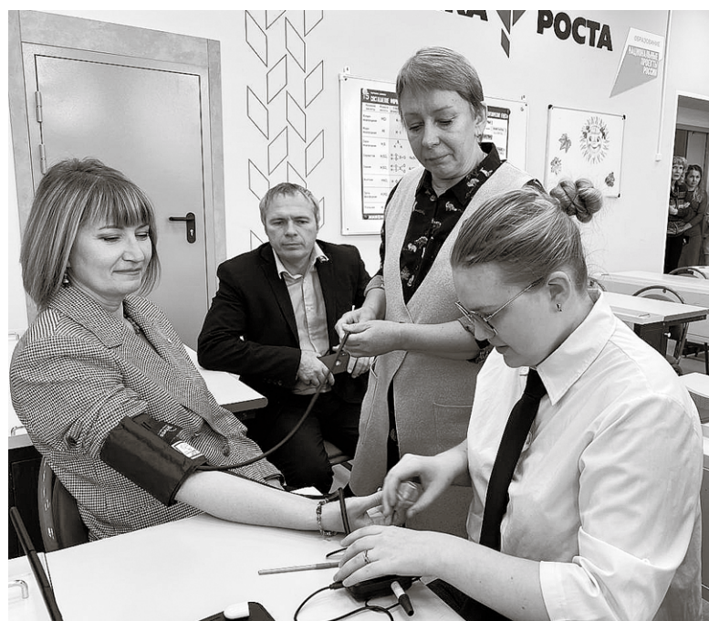
Возможности новых технологий проверили сразу

приобрели современное и технологичное оборудование для большой лаборатории, кабинетов физики, химии и биологии.