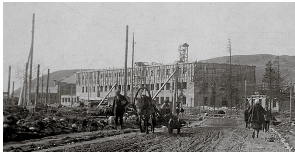
Июль, 1932 г. Идёт стройка