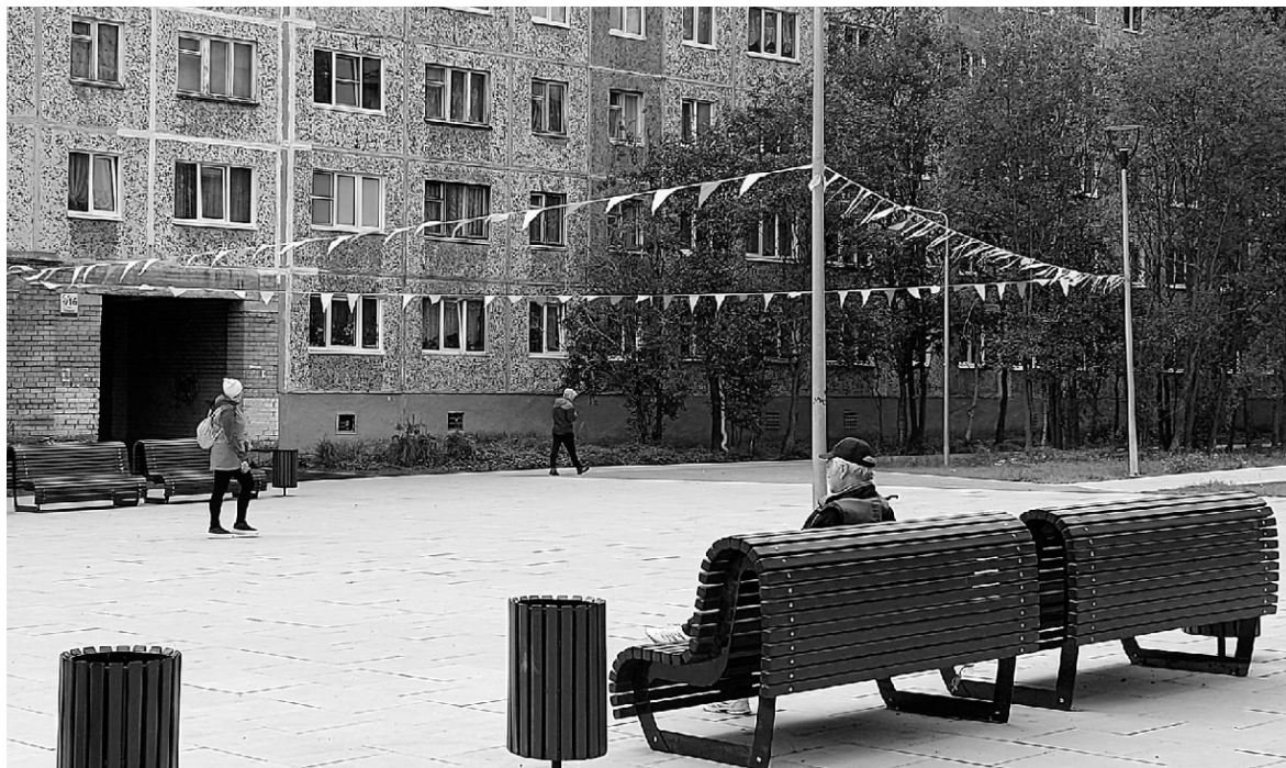
На улице Дзержинского теперь есть площадка, где с комфортом могут отдохнуть прохожие