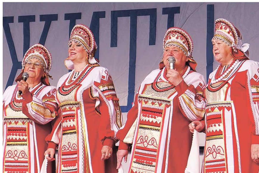
Народные песни всегда вызывают отклик у слушателей

Ольга ИЛЬНИЦКАЯ