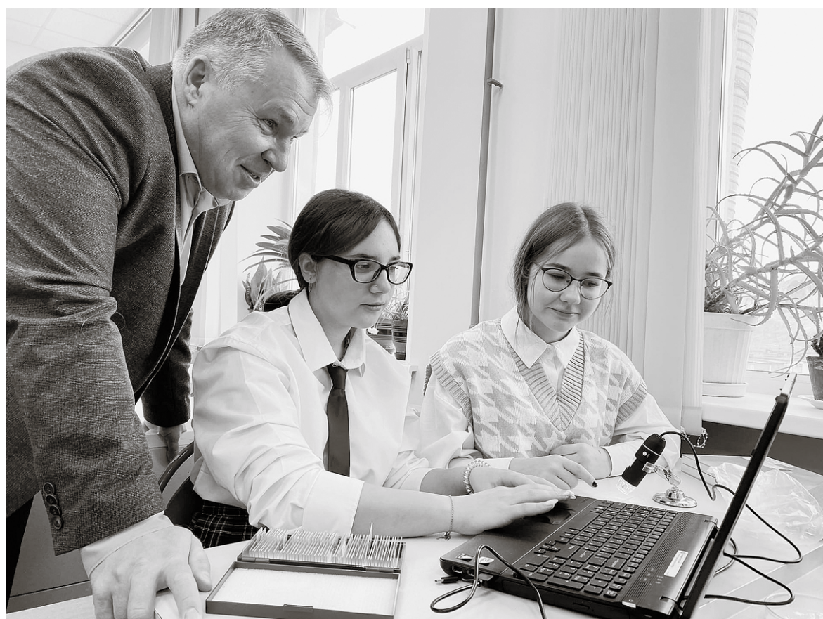
Вадим Турчинов высоко оценил условия для развития школьников