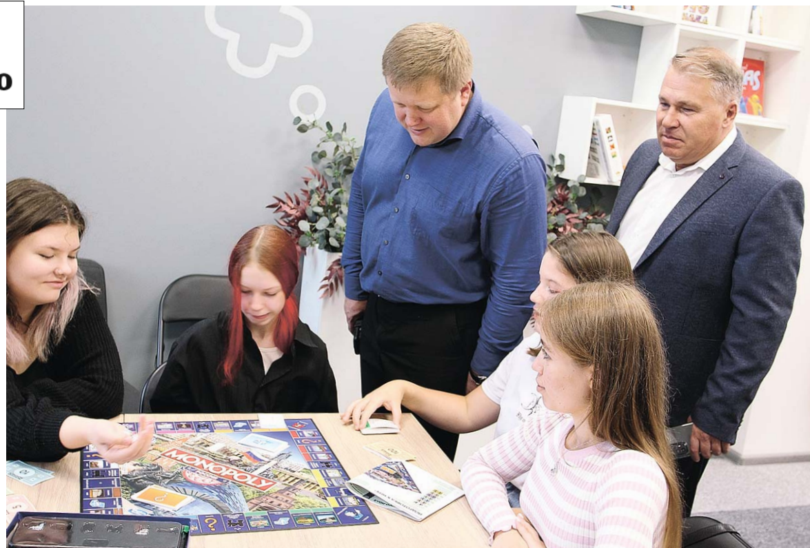
Почётные гости и хозяева сыграли в «Монополию»

– Когда мы планировали расширение сети «СОПКИ», то