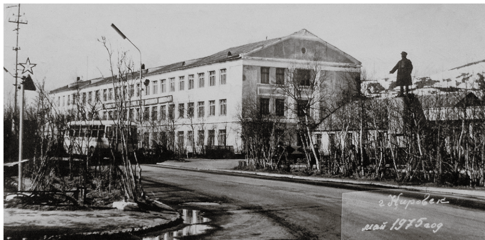
Так выглядела школа в 70-е годы