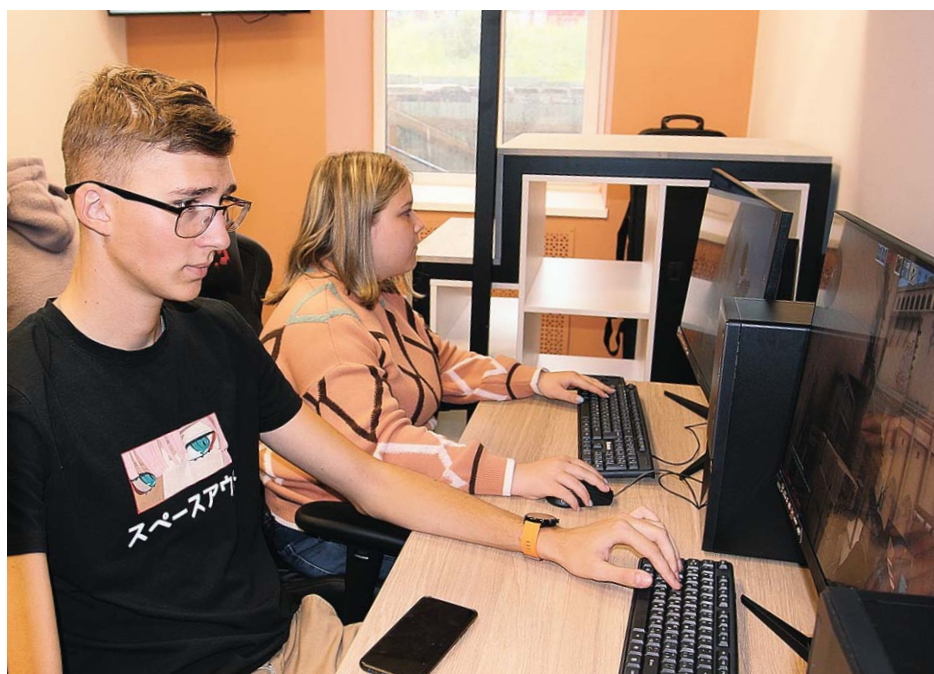
Для ребят закупили лучшее оборудование