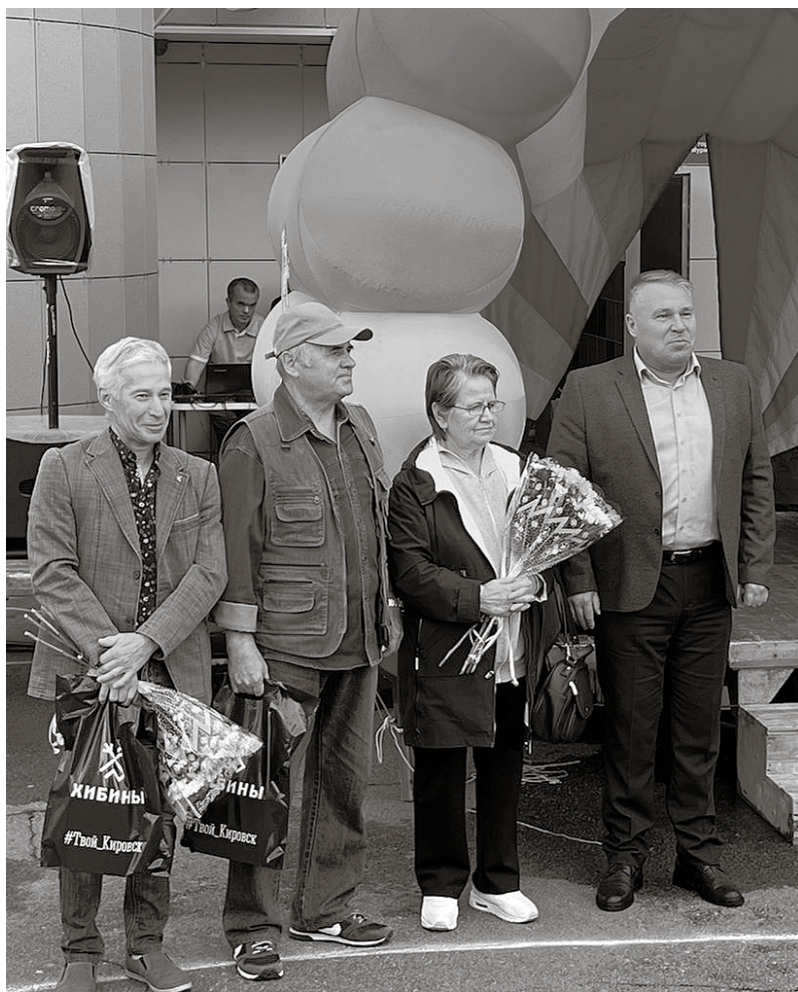
В день рождения посёлка его жителям дарили подарки