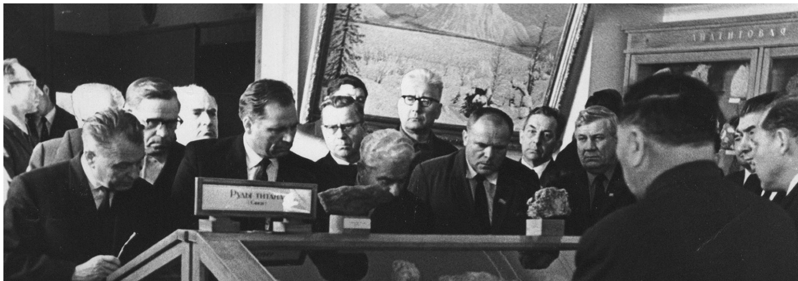
Участники Всесоюзного совещания по технике безопасности осматривают экспонаты минералогического музея техники