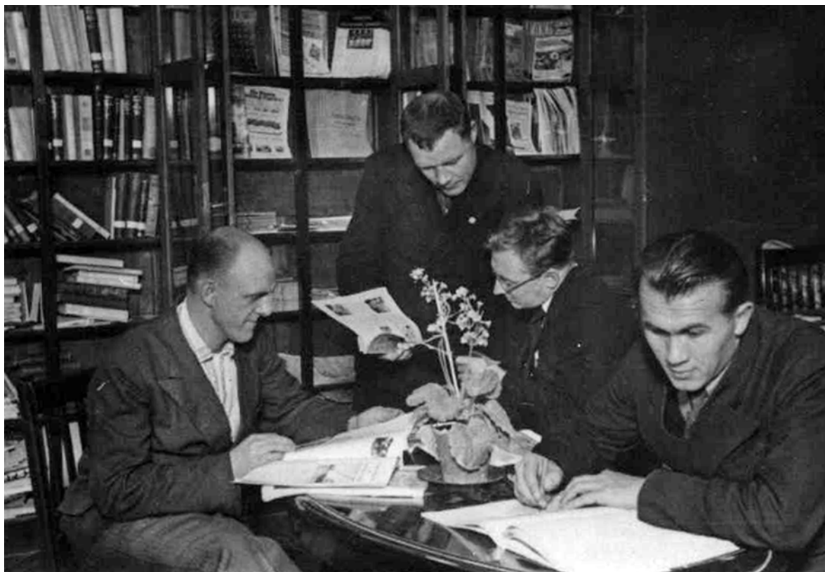
В отделе иностранной литературы в библиотеке Дома техники. 1937 г.

Знакомство с Кировским районном участии Северной экскурсии начали 10 июля 1937 года, а 12 июля состоялось открытие Дома техники. 17 участников международного конгресса геологов стали почётными гостями торжественной церемонии. Им показали документы, рассказывающие о строительстве первого города в Хибинах, панорамы рудника имени Сергея Мироновича Кирова, обогатительной