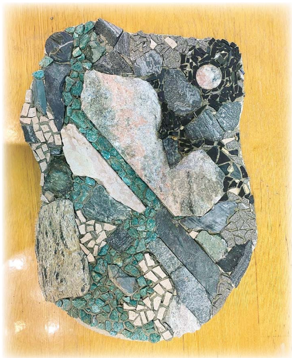
Одна из работ участников мастер-класса.

Апатиты. Седьмого августа в Центре современного искусства «Сияние» художник Фёдор Мухаметшин провёл для горожан мастер-класс «Мозаика из природного камня». Участники создавали панно из разнообразных по форме и текстуре образцов местных природных минералов – апатита, амethysta, кварца, амазонита; использовали в работах и керамогранит. В итоге получилось девять мозаик, в основу которых легли северные пейзажи и природные явления.