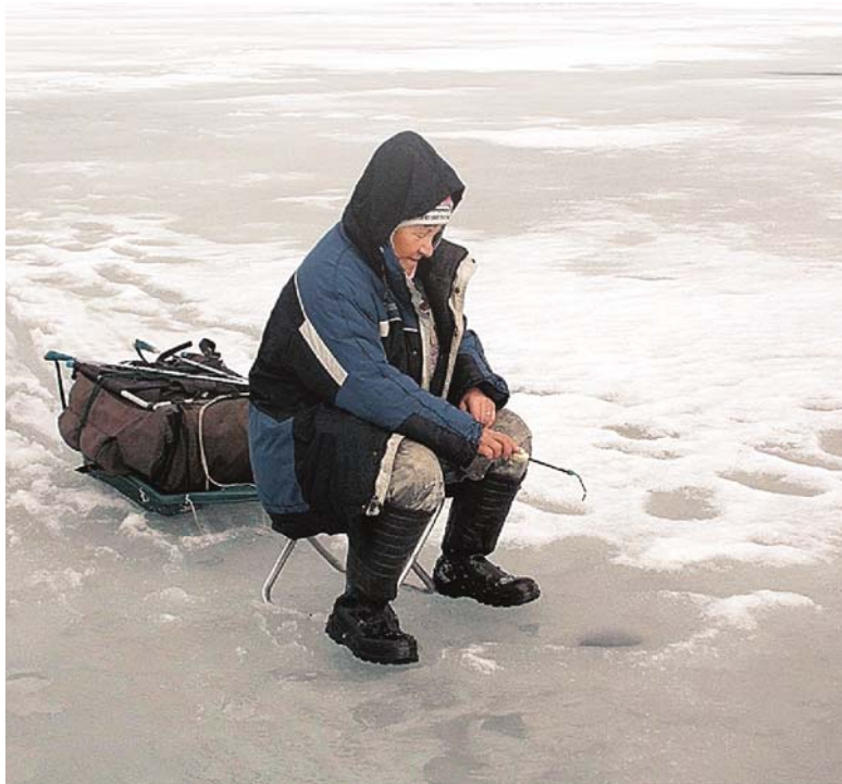
«Мастер подлёдного лова» в действии

удочку благодаря мужу сестры: порыбачила с ним на Имандре – и «заболела». Причём одинаково полюбила и зимний, и летний лов. Участвовала и в спортивных соревнованиях, например, в 2003 году стала «Мастером подлёдного лова», когда поймала сига – единственная из всех участников. Но рыбачке больше по душе не соревновательный азарт, а ловля на природе, без суеты, где не встретишь сетей, надоевших местным удильщикам.