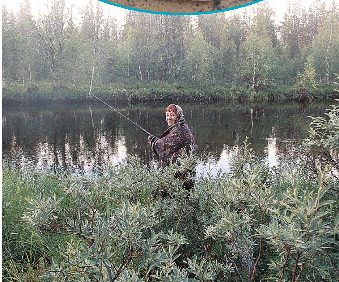
Любимые места для рыбалки – подальше от цивилизации