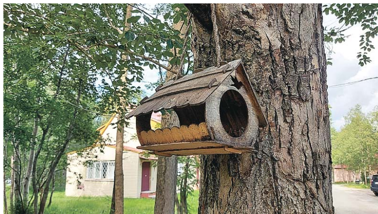
В Академгородке много красивых домиков. Разного предназначения