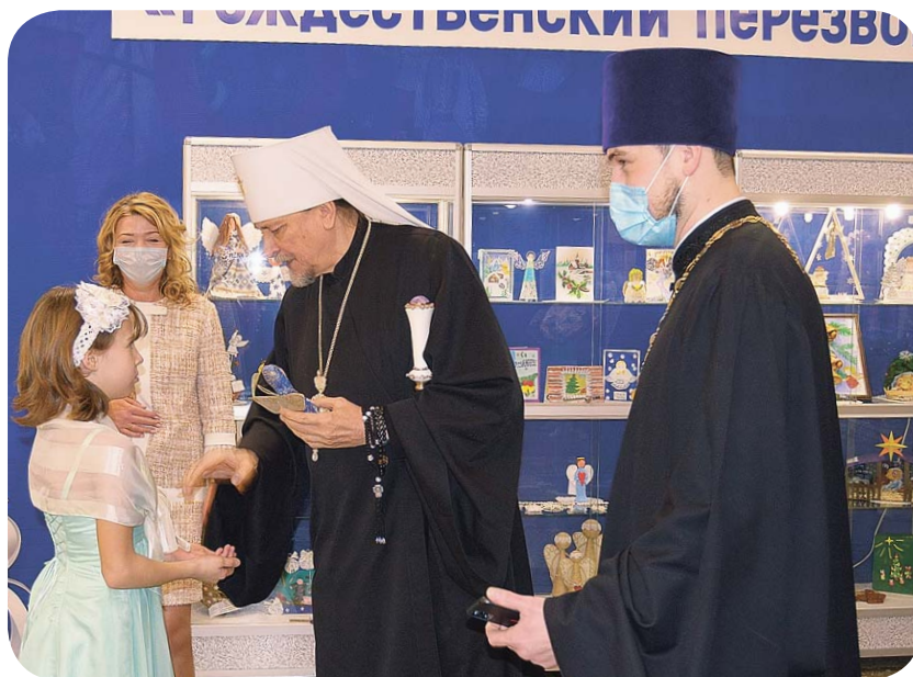
Ангел – в подарок владыке

сердце слышит, особенно юные души. Рождество Христово – сосредоточение русской души, и те традиции, которые присущи этому празднику, в полной мере реализованы здесь, на этом фести-