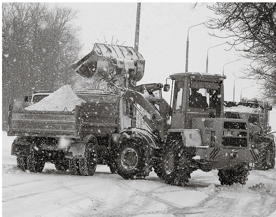
Стихия прошла, а работа осталась

Утром вторника были расчищены и приведены в относительный порядок все центральные дороги, открыто