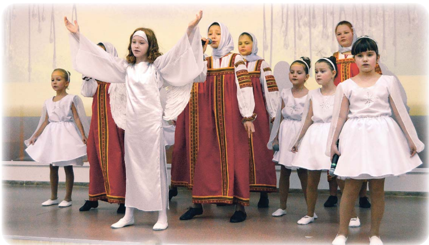
Совместная постановка учеников школы № 4 и ребят из воскресной школы храма Иверской иконы Божией Матери получилась яркой и выразительной

– Поздравляю, что именно ваш город явился инициатором такого духовного возрождения, – сказал он. – Мы всегда говорим о том, как важны традиции. И вот здесь мы видим полный расцвет древней традиции особого празднования Рождества Христова. Это глубинные корни, глубинные силы, которые передаются нам нашими предками и живут в нас. Эти ангелы, которыми наполнена выставка, сделанные руками наших юных северян, – это те самые ангелы-хранители, которых имеет каждый крещёный человек. Они незримы и неслышны, но