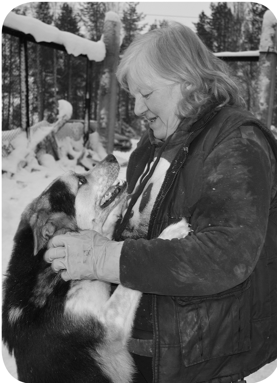
«Птичка» приютила 80 питомцев

Содержится в приюте около 250-280 собак. В последние два