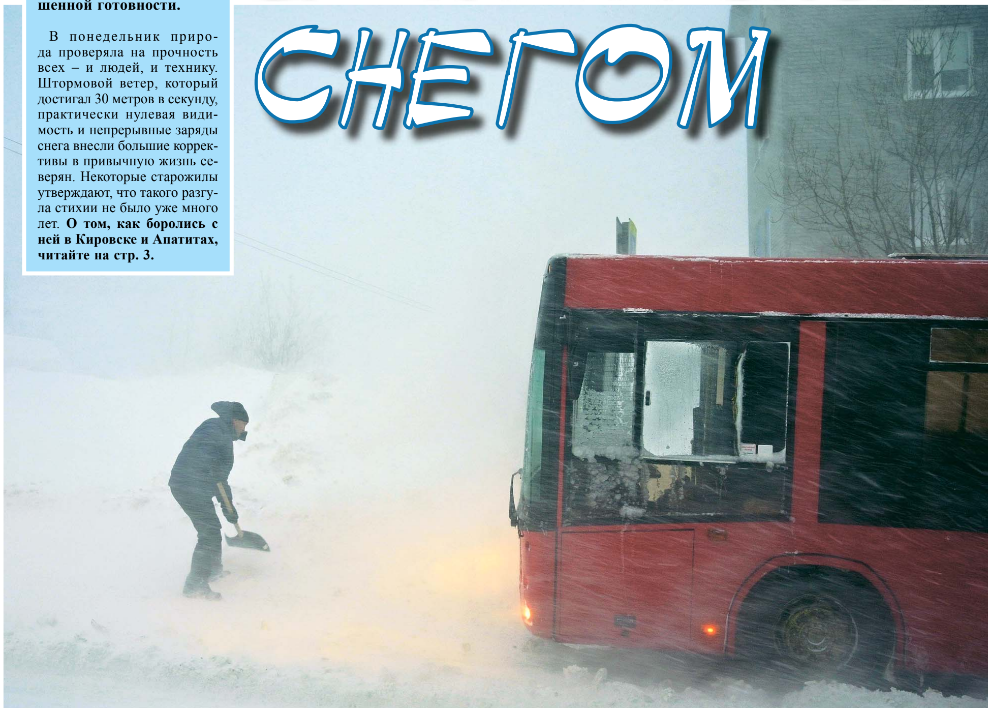
Вызволнение автобуса из снежного плена около конечной остановки в Кукисвумчорре, 17 января 2022 г.