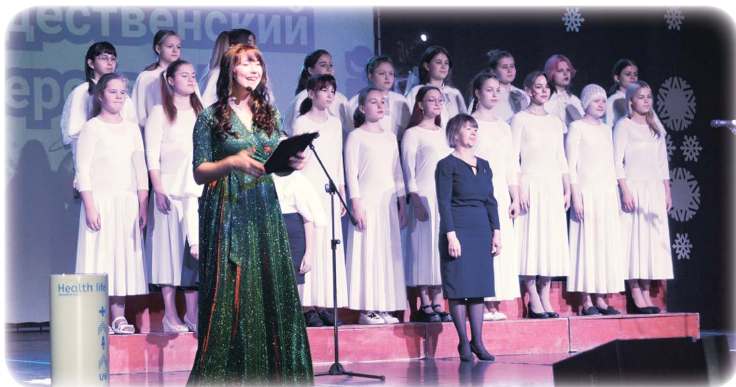
Открыл «Рождественский перезвон» хор детской музыкальной школы