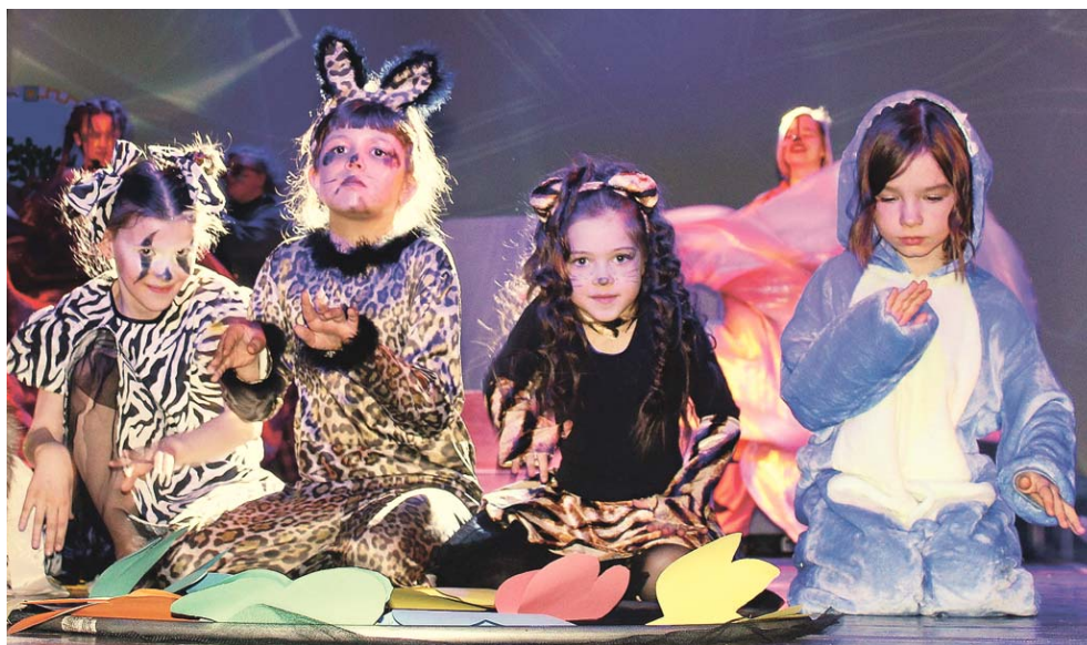
Юные актёры из «Театрашек» участвовали во всех массовых танцевальных сценах