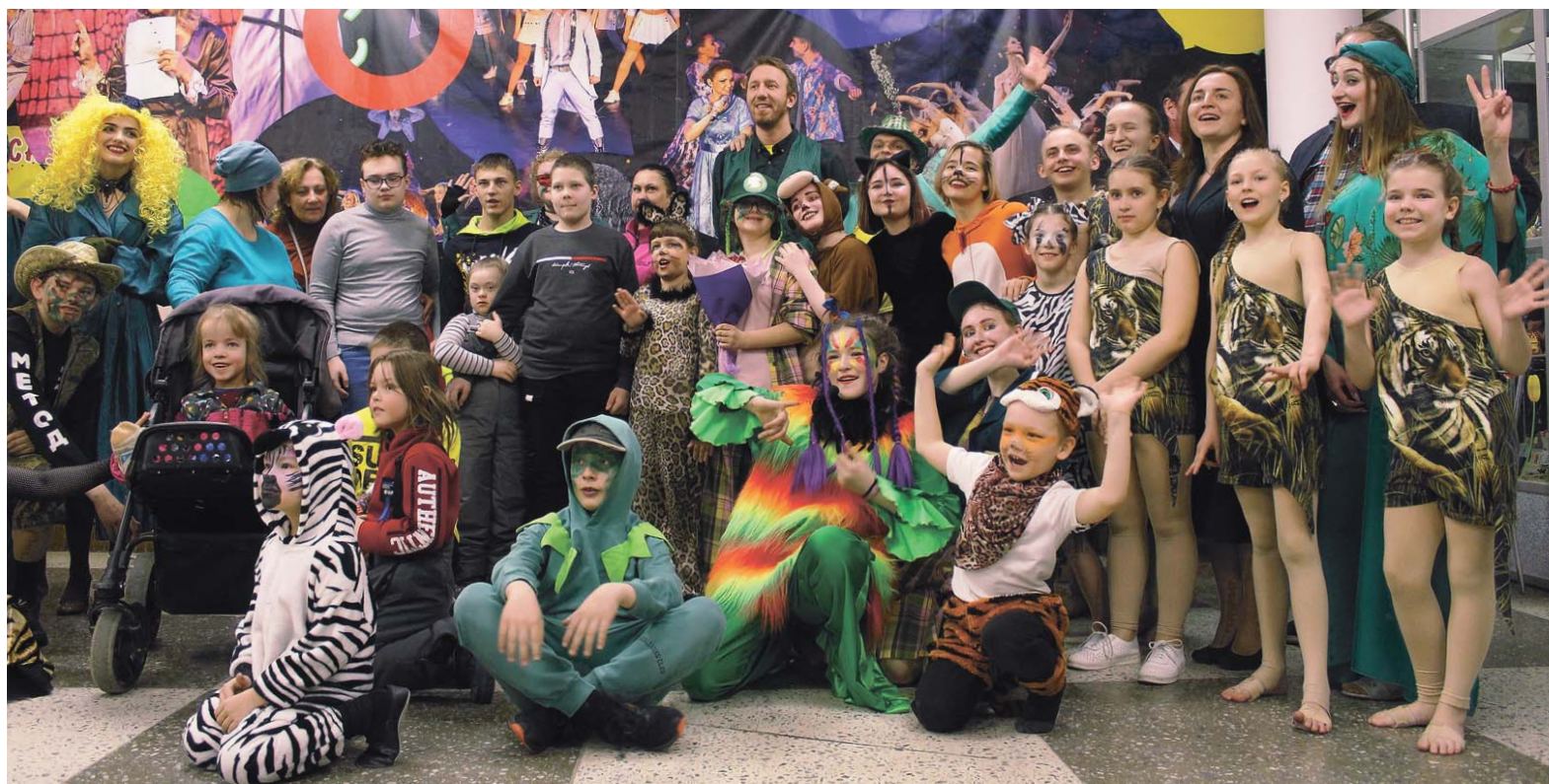
После спектакля все его персонажи вышли к зрителям на фотосессию