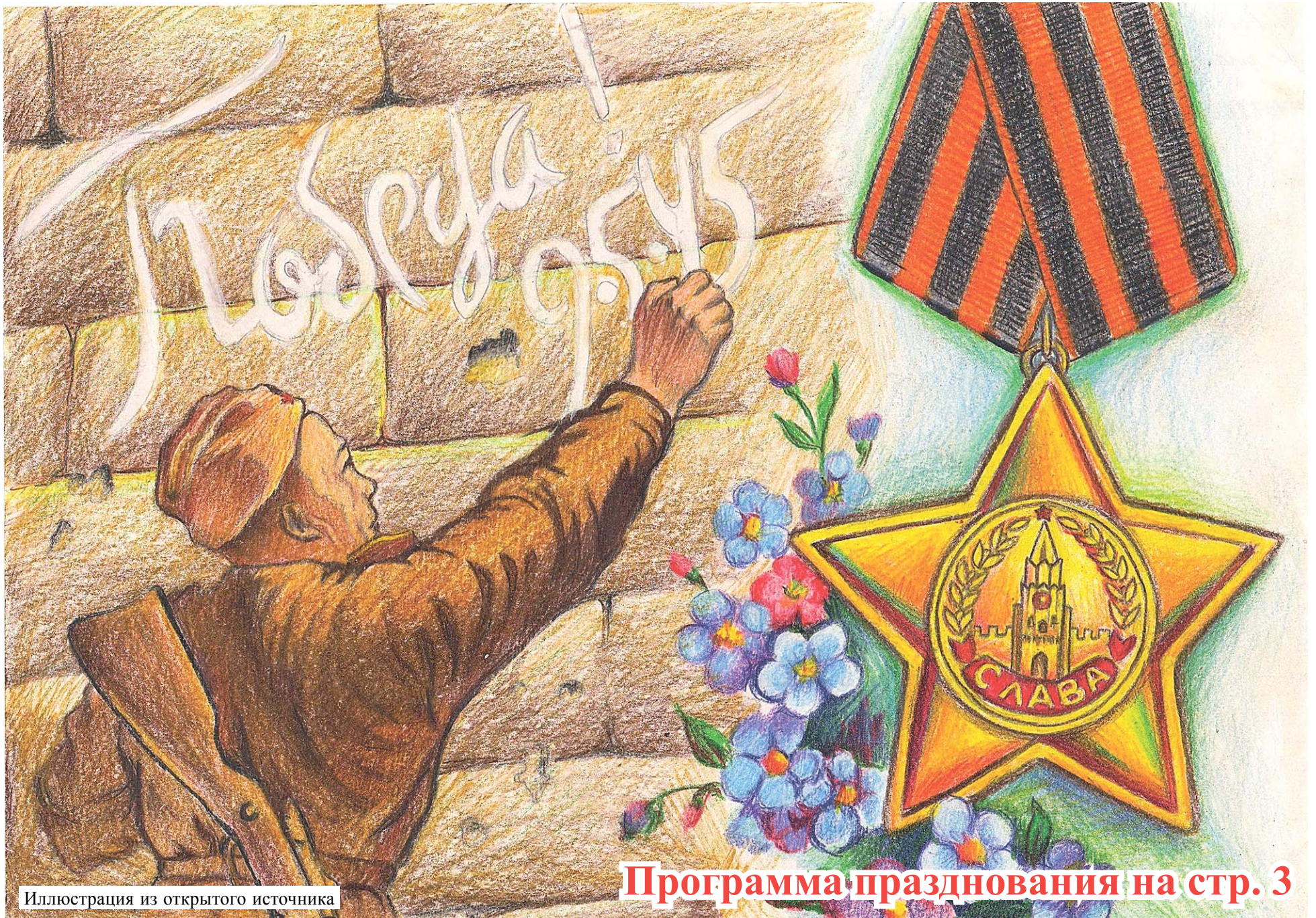
Иллюстрация из открытого источника