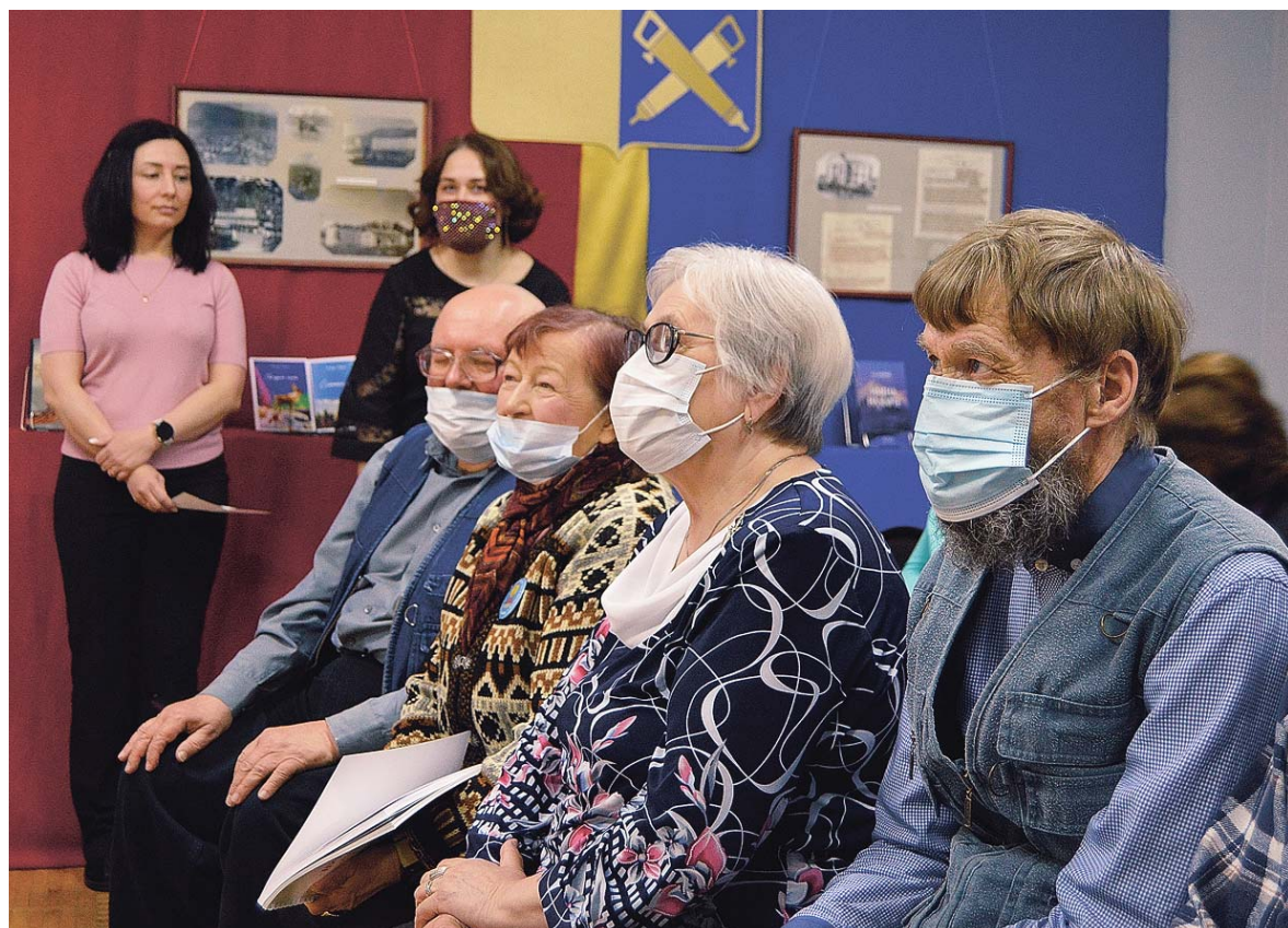
Друзья музея – это те, кто дружит с историей