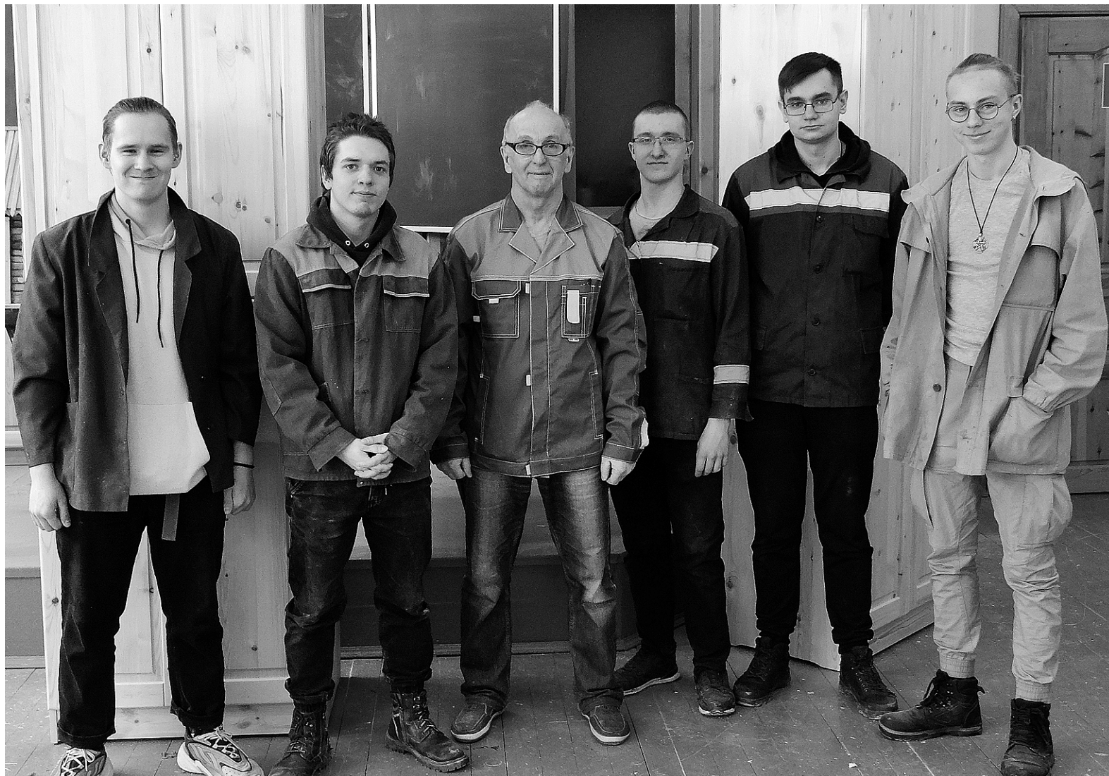
Мастер и его ученики: «Практика – это наша любимая часть обучения»