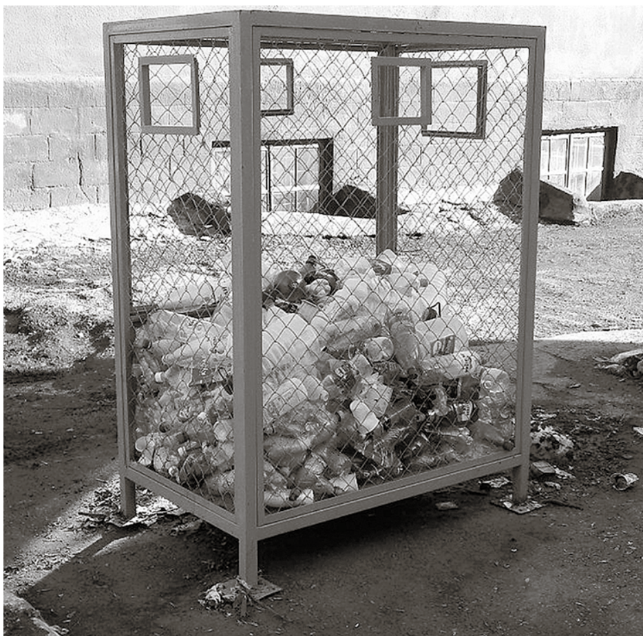
Вот так выглядит контейнер для пластиковых бутылок

С первого марта 2022 года только ФЭО может принимать ртутьсодержащие отходы (люминесцентные лампы, градусники). Система сдачи уже отработана: организация или предприниматель регистрируются на сайте федерального оператора, заключают договор, указывают, где находится их помещение, определённое под хранение ртутьсодержащих отходов.