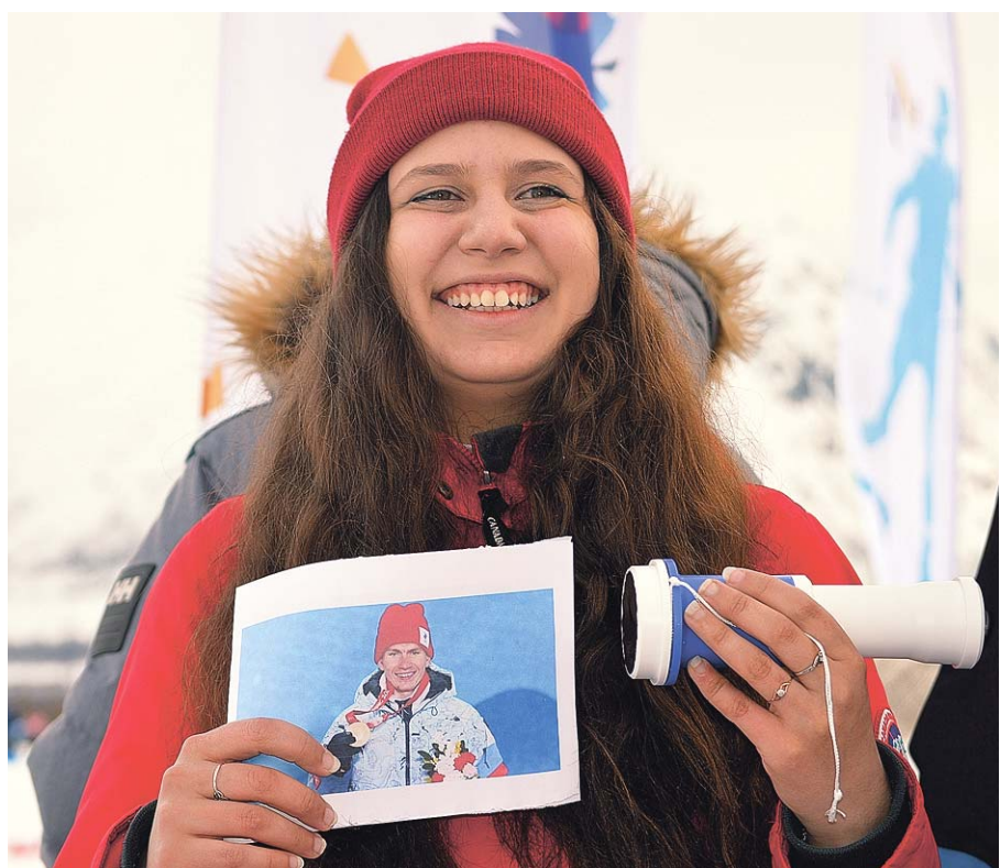
Мечта брянской болельщицы сбылась: она своими глазами увидела героев Олимпиады – 2022