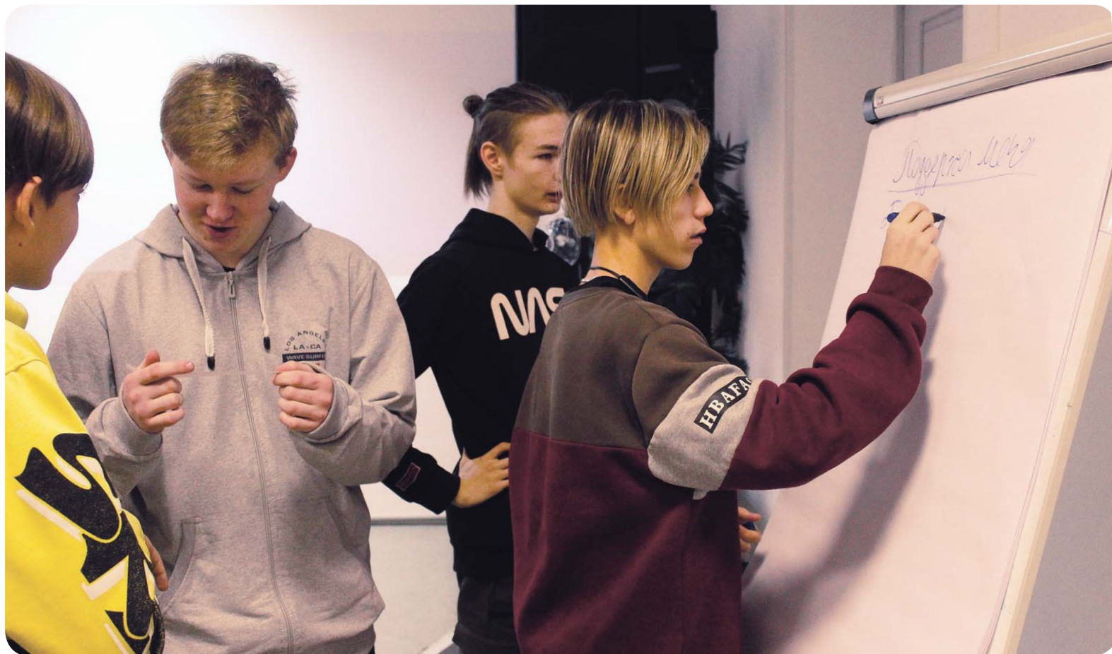
Ребята третьего сезона школы креативного творчества «ПроГовори» с увлечением выполняют задания от приглашённых экспертов

Кристина НОВИКОВА, фото автора и со страницы Ангелины Камневой соцсети «ВКонтакте»