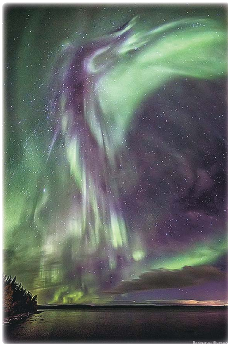
«Жар-Птица над озером Имандра»

Кураторы ЦСИ для экспонирования заказали в столичной фирме особую печать фотографий – метод, когда плотная, глянцева фото бумага накатывается на алюминиевую пластину, и при правильном освещении мощными спотами картина как будто светится изнутри! А так как фотографии отпечатаны на алюминированном основании с эффектом «парения», они отходят от стены и как бы парят в воздухе, что добавляет экспозиции ощущение объёма.