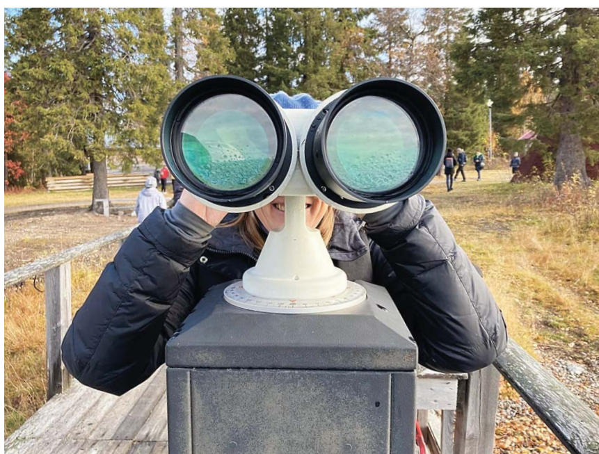
Одна из изюминок Лапландского заповедника

Она не просто рассказывала нам что-то, а вовлекала в процесс познания, получения но-