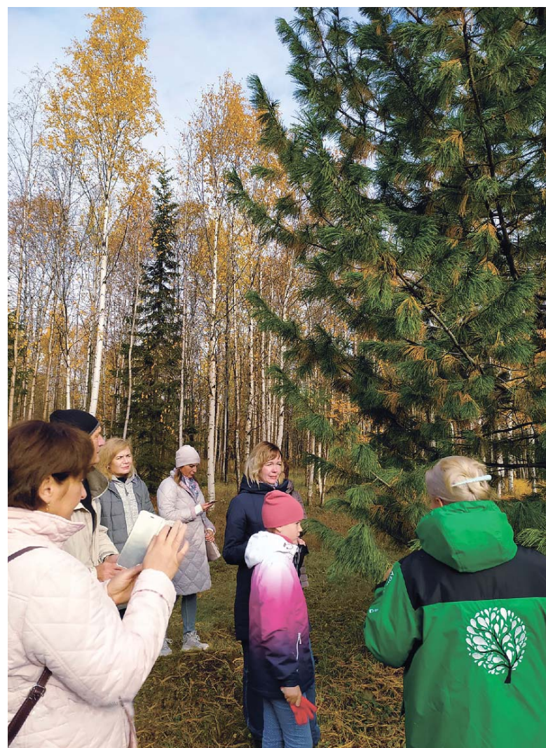
В апатитском дендрарии вы увидите деревья с разных континентов

Зоя КАБЫШ