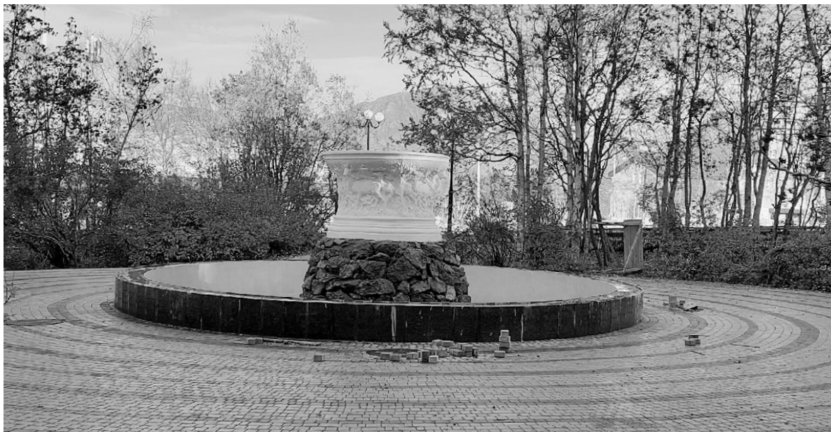
Фонтаны не только сохранили, но и полностью отремонтировали