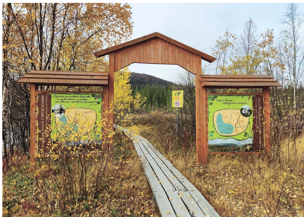
Дорожки заповедника зовут в путешествие