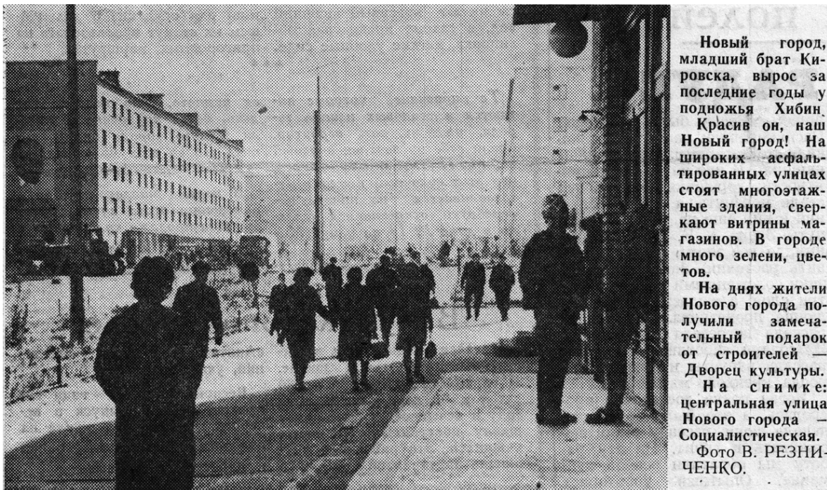
«КР», август 1965 г.