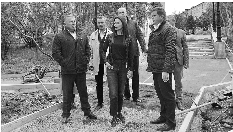
Работы на центральной площади – в финальной стадии, к концу сентября обещают закончить

В комплексе с развивающимся горнолыжным склоном «Большой Вудьявр», с которым парк граничит, его обновлённое пространство будет смотреться ещё более впечатляюще. Работу подрядчика и темпы благоустройства этой территории городские власти аттестуют оптимистично. Напомним, что проект благоустройства парка стал призёром всероссийского конкурса городской среды малых городов и исторических поселений и в этом качестве получил поддержку регионального бюджета в размере 58 миллионов рублей.