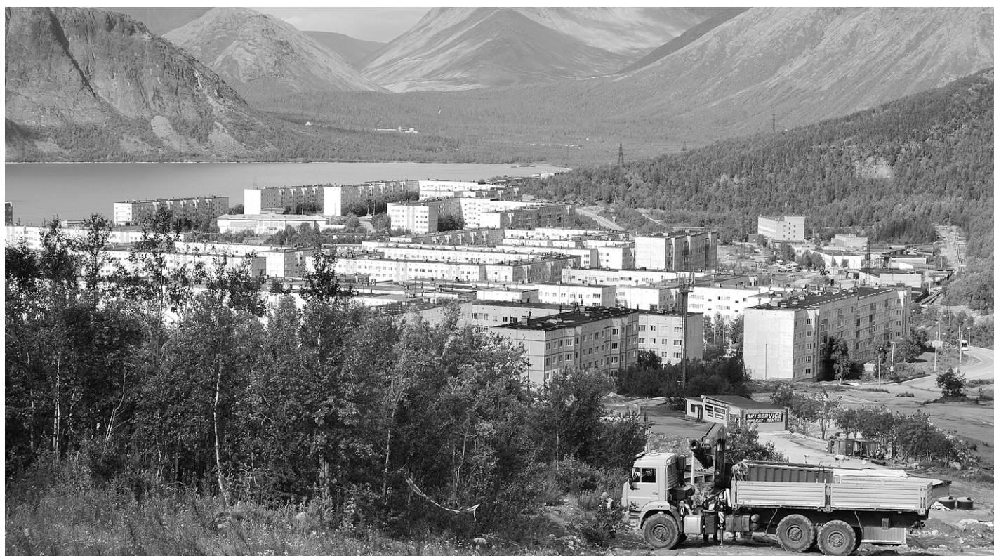
Прекрасная природа и труд людей делают город красивым и уютным

«КР» извещает о проведении жеребьёвки по распределению бесплатной печатной площади для публикации предвыборных материалов зарегистрированными кандидатами на дополнительные выборы депутатов Совета депутатов г. Апатиты шестого созыва по двухмандатному избирательному округу № 4 18 августа 2021 года, начало в 13 часов. Адрес проведения: г. Апатиты, ул. Коммунальщиков, 15, 1-й подъезд, 4-й этаж.