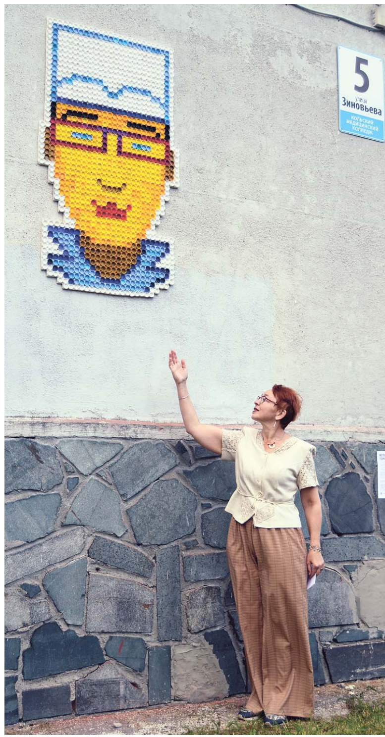
Автопортрет от выпускницы медучилища 1986 года – с любовью к профессии