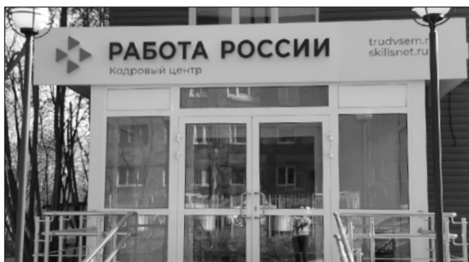
После регистрации на портале добро пожаловать в отдел по трудоустройству!

нацпроекту «Демография»? Это государственная услуга, которую предоставляет портал «Работа России» через сайт Trudvsem.ru. Войти на него проще всего через те же госуслуги, затем выбрать свой регион и внимательно просмотреть список специальностей и учебных заведений.