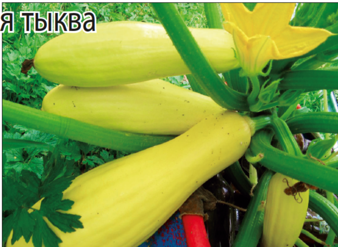
Кабачок - универсальный овощ, вкусен в самых разных блюдах, а молодой плод можно есть даже сырым, чуть замариновав в вкусной заправке. Растите и питайтесь с удовольствием!

Помните, для опыления кабачкам нужны пчелы, но и мухи с мошками справляются с задачей, поэтому с пчелоопыляемых кабачков у нас на севере можно получить хороший урожай, только не жалейте органиче-