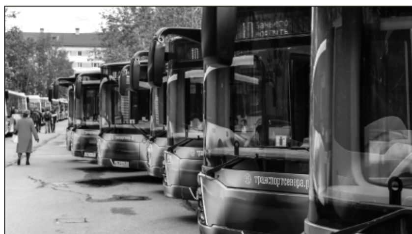
Скоро прокатимся в новеньких автобусах!

По маршруту №219 «Кандалакша - Полярные Зори - Апатиты (аэропорт «Хибины»)» автобус курсирует по вторникам и четвергам, делая остановку на улице Ферсмана. Из Кандалакши он стартует в 6 утра, из Полярных Зорь - в 6.50, на Ферсмана - в 8.10, в аэропорту - в 8.20. В обратном направлении маршрутка проходит те же остановки, стартовав из аэропорта в 18 часов и прибывая в Полярные зори в 19.40, в Кандалакшу - в 20.30.