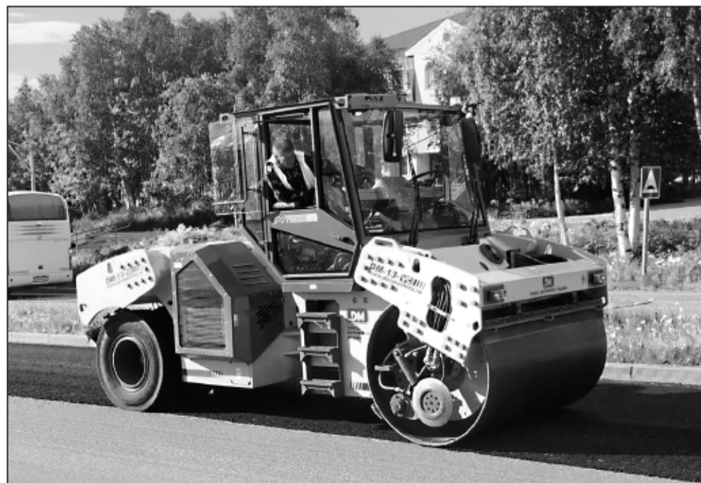
Асфальтоукладочную технику сегодня можно встретить по всему городу: утюжат до самой ночи!

Что касается дворов, то еще в начале марта городу были выделены деньги для благоустройства дополнительно 14 дворов, плюс несколько дворов приведут в порядок за счет экономии по результатам торгов - итогом в 2022 году отремонтируют сразу 23 апатитских двора. В каждом из них первым делом демонтируют старые опоры освещения, и граждане пугаются - куда, мол, потащили фонари? Не волнуйтесь, свет в каждом дворе появится обязательно, опоры установят новые.