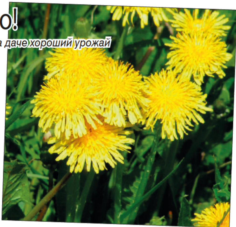
Чудесный одуванчик, который радует глаз и подходит для салатов, оказался опасным сорняком!

Тысячелистник - многолетний сорняк. Все растение опушено белесыми тонкими волосками. Стебель прямой или приподнимающийся, ветвистый. Тысячелистник обыкновенный широко используется как садовое растение. Устойчивым сорняком не является, однако в его запущенных посевах создаются неблагоприятные условия для развития культурных расте-