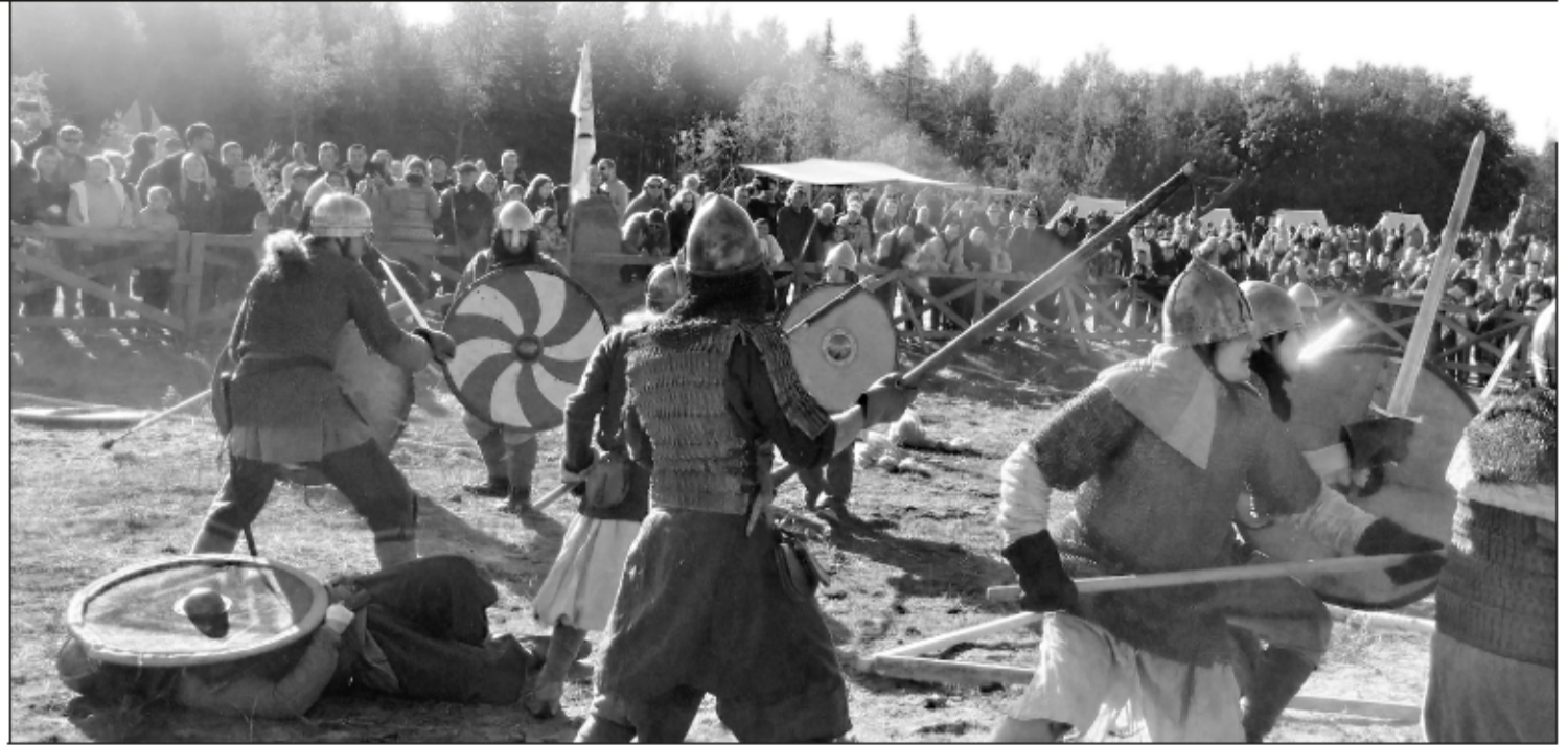
На фестивале викингов в Мончегорске всегда бывает жарко!

А 21 июня в 16 часов здесь пройдет акция «Добрый вторник» для тех, кто хочет стать волонтером, но не знает, куда обратиться. Волонтеры молодежного центра собираются вместе по вторникам, чтобы обсудить совместные мероприятия, в том числе и квесты. Новичков ждут 21-го, приходите и присоединяйтесь к волонтерскому движению! (12+)