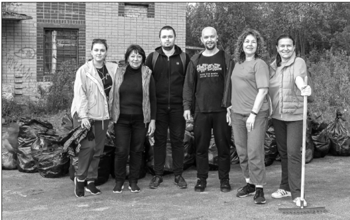
Всего в субботнике приняли участие два десятка человек: взрослые и дети, сотрудники КНЦ, те, кто живет в домах по соседству с парком и те, кто просто любит это место.

Напомним, Академгородок как парк объединяет зоны регулярной посадки растений и участки специально сохраненной естественной лесной растительности. Один из них выходит к улице Зиновьева и идеальным состоянием похвастаться не мож-