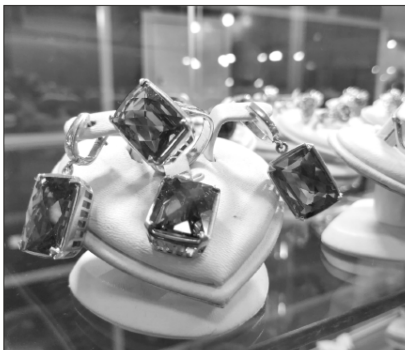
Симферопольская красота - ежегодно этот прилавок притягивает апатитских дам.