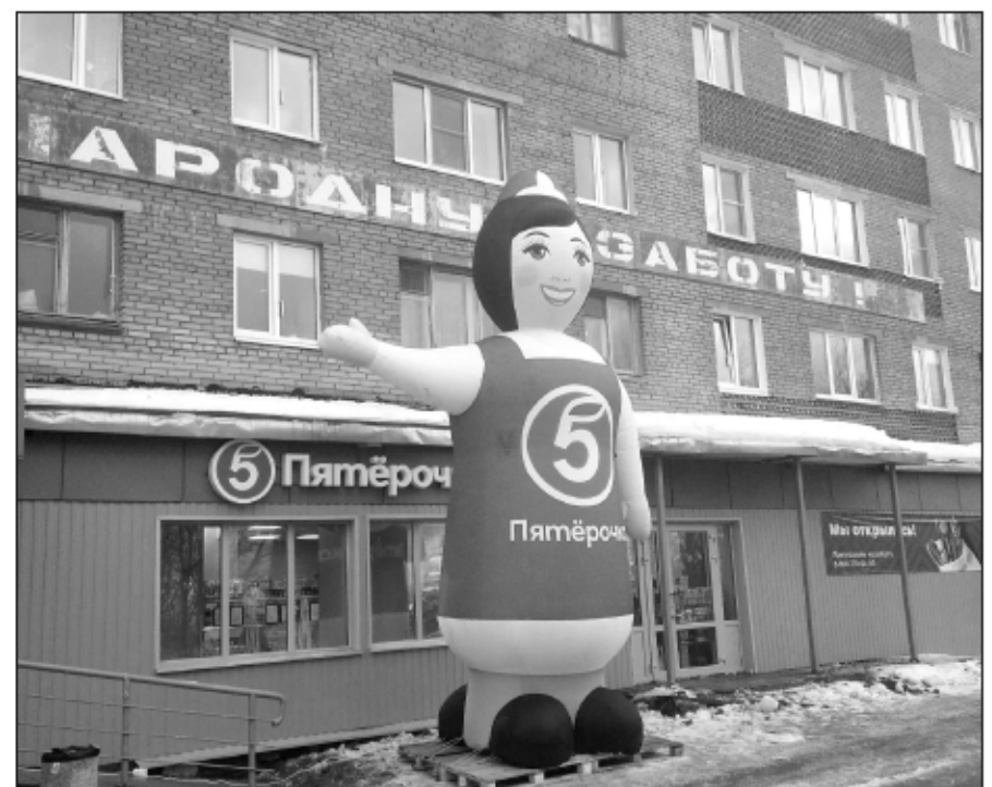
Открытие универсама на Северной, 25 оценили жители микрорайона - многие сфотографировались с этой красивой надувной «пятерочкой»!

А что касается появления торговой точки на Северной, 25, то это был настоящий сюрприз для жителей микрорайона. На всех подъездах в близлежащих домах появились листовки с приглашением посетить новый магазин. У входа в саму «Пятерочку» установили огромную, высотой в два этажа, надувную куклу. Давно пустующее помещение, где когда-то располагался универсам «Северное сияние», кардинально изменилось - стало просторным и светлым. И на Пригородной, и на Северной покупателей встречают залежи сахарного песка по 79 рублей за кило (слава богу, все уже запаслись). А вот и в том, и в другом магазине пока совсем небольшой выбор хлебобулочных изделий. Пустоваты полки со спиртными напитками. А в целом есть все, что мы привыкли покупать в «Пятерочках». В той, что на Пригородной, шире выбор хозяйственных товаров, бытовой химии и продуктов для здорового питания. Ну а цены... они везде оди-