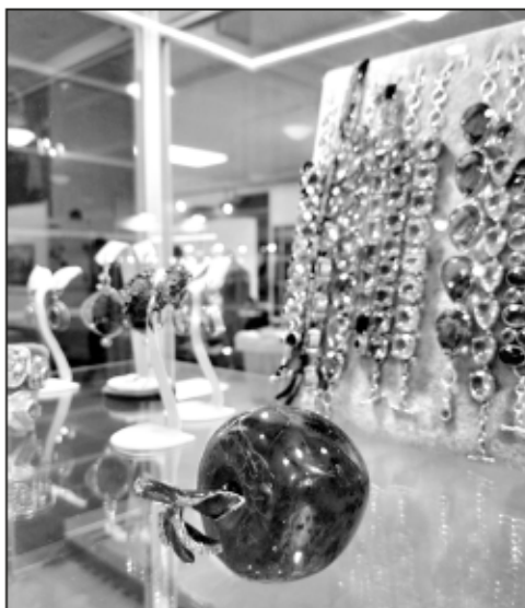
Можно сделать шары из минералов, а можно - яблочки.