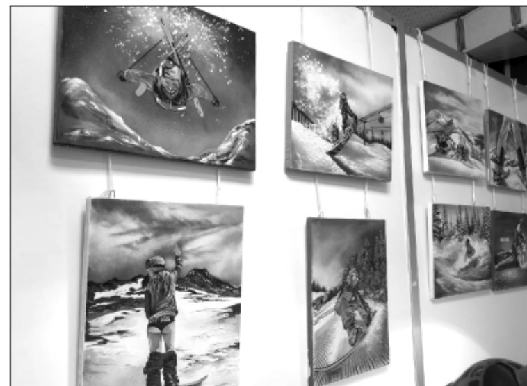
Говорят, каменную крошку изобрели в Апатитах. Но теперь это не только пейзажи, а и память о горнолыжных спусках...