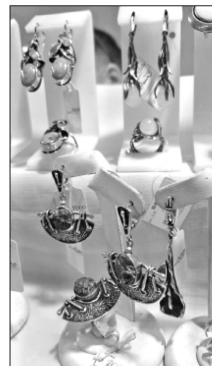
Много украшений с нефритом - настоящим весенним камнем!