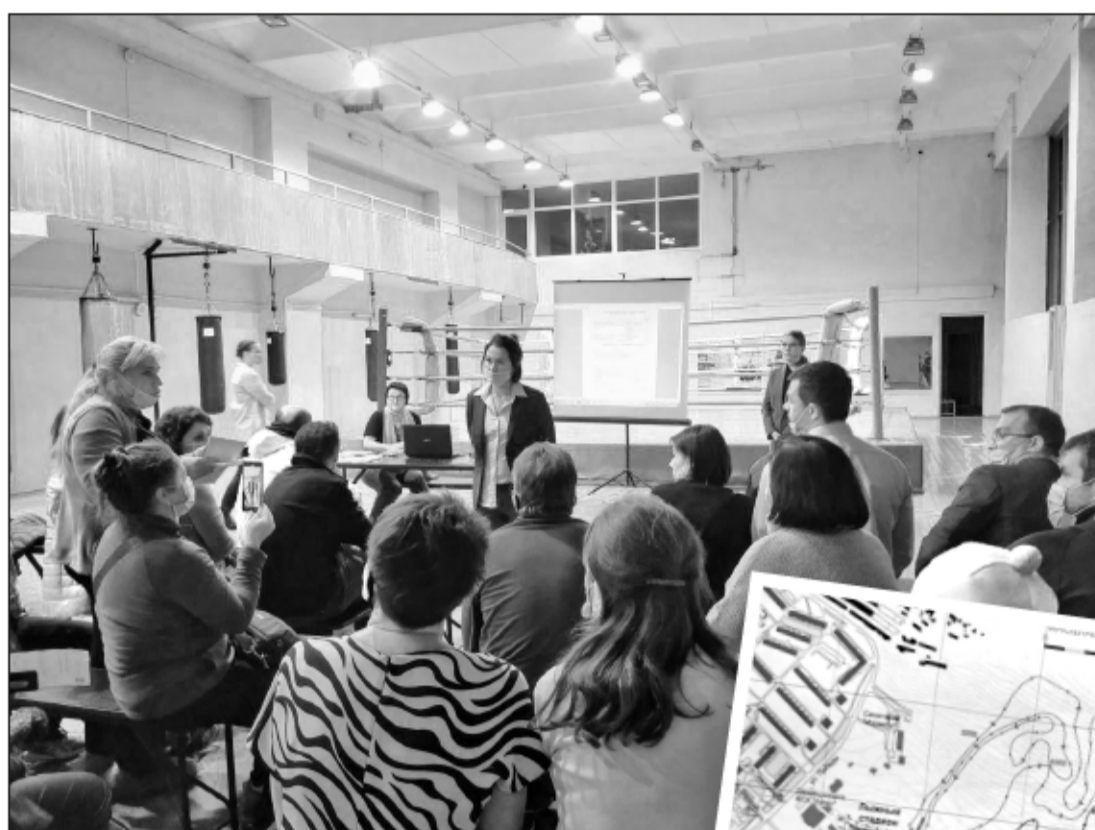
В зале бокса «Атлета» на собрание пришли заинтересованные в развитии городского спорта люди, и много. Общались горячо, но конструктивно.

Встреча рассчитана на всех любителей литературы - приходите, будет интересно! Есть небольшой входной сбор. (12+)