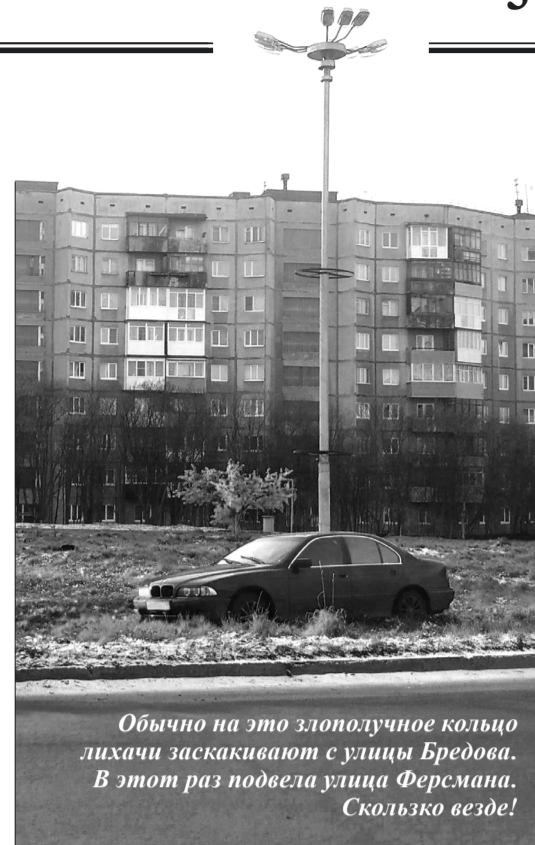
Обычно на это злополучное кольцо лихачи заскакивают с улицы Бредова. В этот раз подвела улица Ферсмана. Скользко везде!

А двумя днями раньше пожарно-спасательные подразделения приняли участие в ликвидации последствий дорожно-транспортного происшествия на трассе «Кола» под Апатитами - там в пять утра столкнулись сразу три грузовика. Фуру, которая двигалась в северном направлении, развернуло поперек скользкой дороги, в нее врезался грузовик, который не смог остановиться из-за гололеда, и сразу же их нагнал и третий грузовой автомобиль. Спасатели отключали аккумуляторы, подавали ствол на тушение кабины «MANa», смывали с трассы следы горюче-смазочных материалов. Водители в аварии не пострадали.