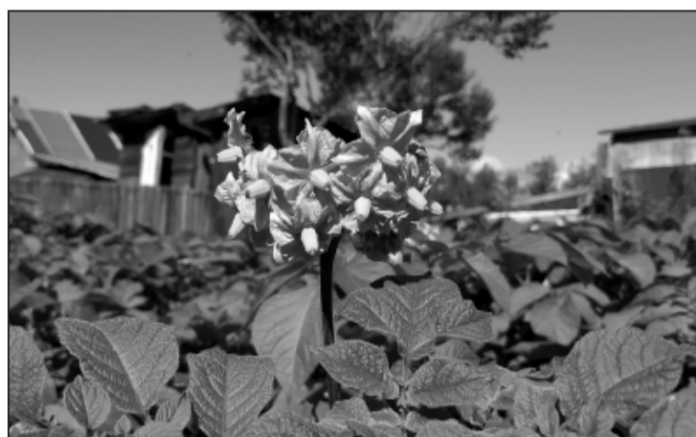
Пока что наиболее успешно арктические гектары северяне используют, выращивая картофель для собственных нужд.

Власти Мурманской области отдали под бесплатные «Гектары Арктики» более 731 га, что составляет 5,04 процента территории области. Это один из самых больших показателей по сравнению с другими арктическими регионами - участниками программы, которые отдали менее одного процента своих территорий. В первые полгода земельные участки в Мурманской области площадью не более 1 га смогут получить только жители региона. Далее в программе сможет принять участие любой житель России.