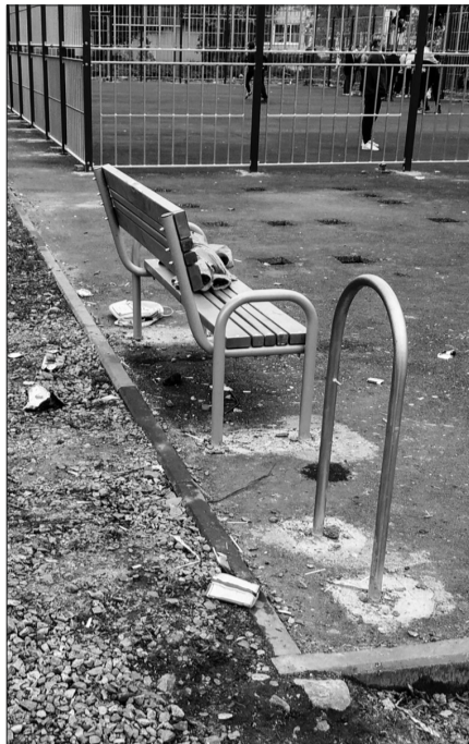
Лавочки есть, а урн - нет.

В ходе оперативно-розыскных мероприятий сотрудники уголовного розыска задержали 32-летнего жителя города, безработного и ранее неоднократно судимого за кражи. Он во всем признался и пояснил, что украденный велосипед продал, а вырученные деньги потратил на собственные нужды. В подъезд проник с помощью универсального ключа.