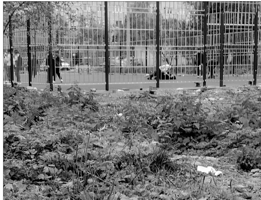
Пока не очень понятно, для чего предназначена площадка: сейчас тут только орут, валяются и громко включают музыку.