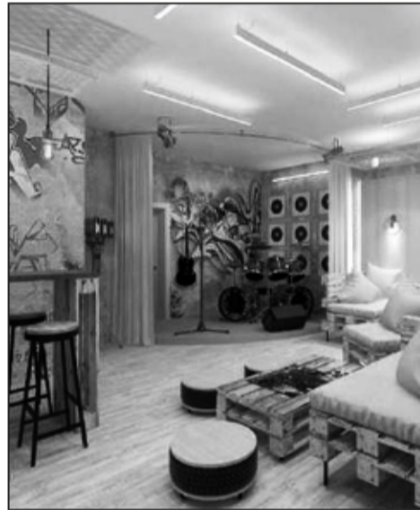
Такой планирует быть библиотека через год.

Не забудут тут и детей дошкольного возраста - для них откроют зал «МаМалышДОМ», где дети с родителями смогут выбрать книжку, поиграть, в том числе в