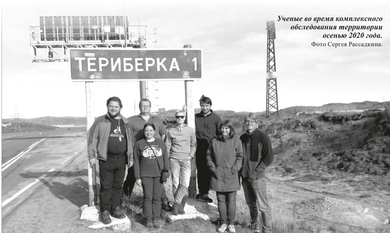
Ученые во время комплексного обследования территории осенью 2020 года.