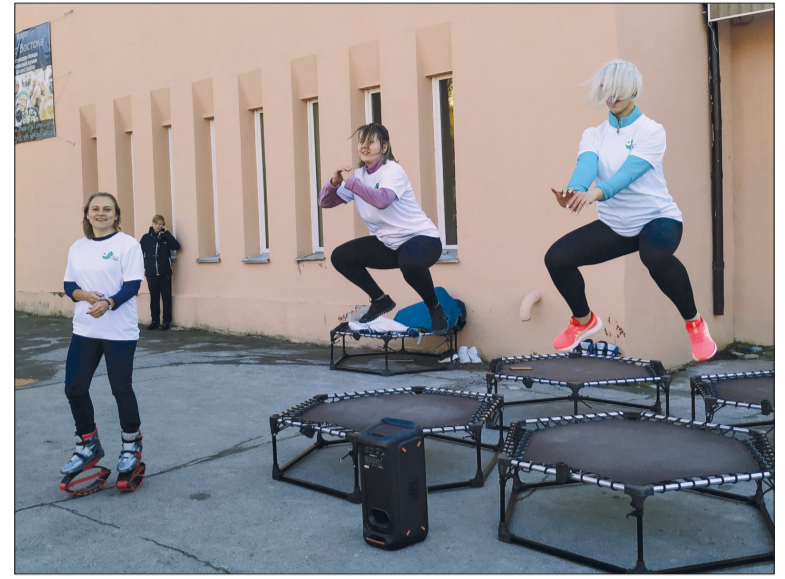
«Девушка, хотите попрыгать с нами? Это бодрит и согревает!»