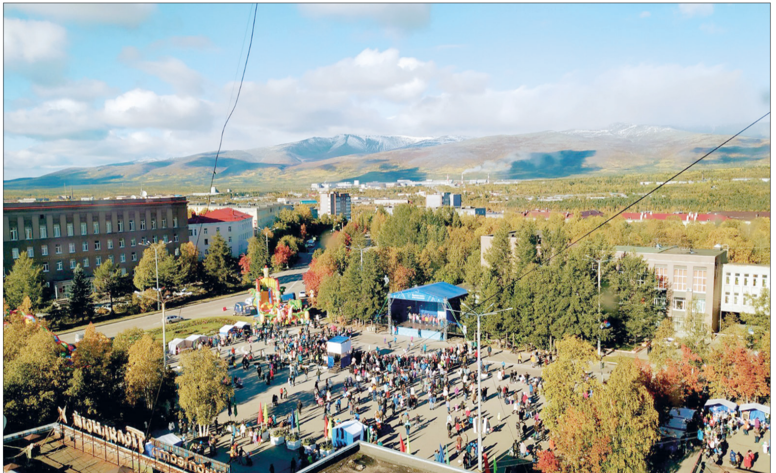
Природа подарила жителям Апатитов солнечный денек: вся область была затянута серыми облаками, а у нас - праздник!

Удивительно трогательным оказался момент костюмированного флешмоба «Звездный юби-