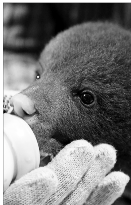
Медвежат выкармливают очень жирными молочными смесями.

- Благодаря авторской методике, мы можем вырастить медведя диким, - рассказывает Василий. - Медвежат