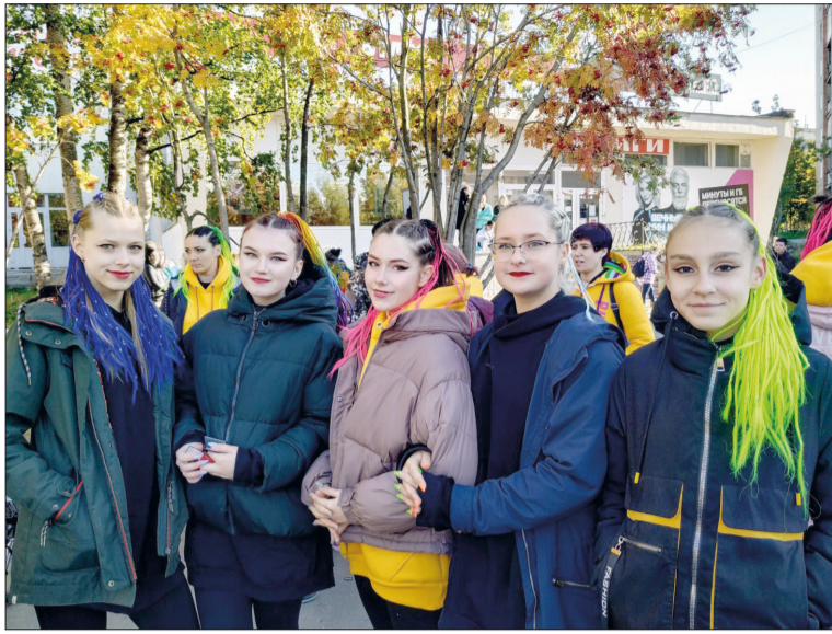
Студия «Pulse» и выступала на сцене, и приглашала всех потанцевать вместе на площадке и вообще всюду, где захочется!