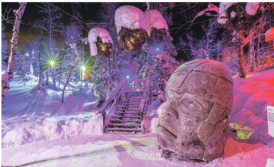
Чудеса «Леса» захватывают воображение