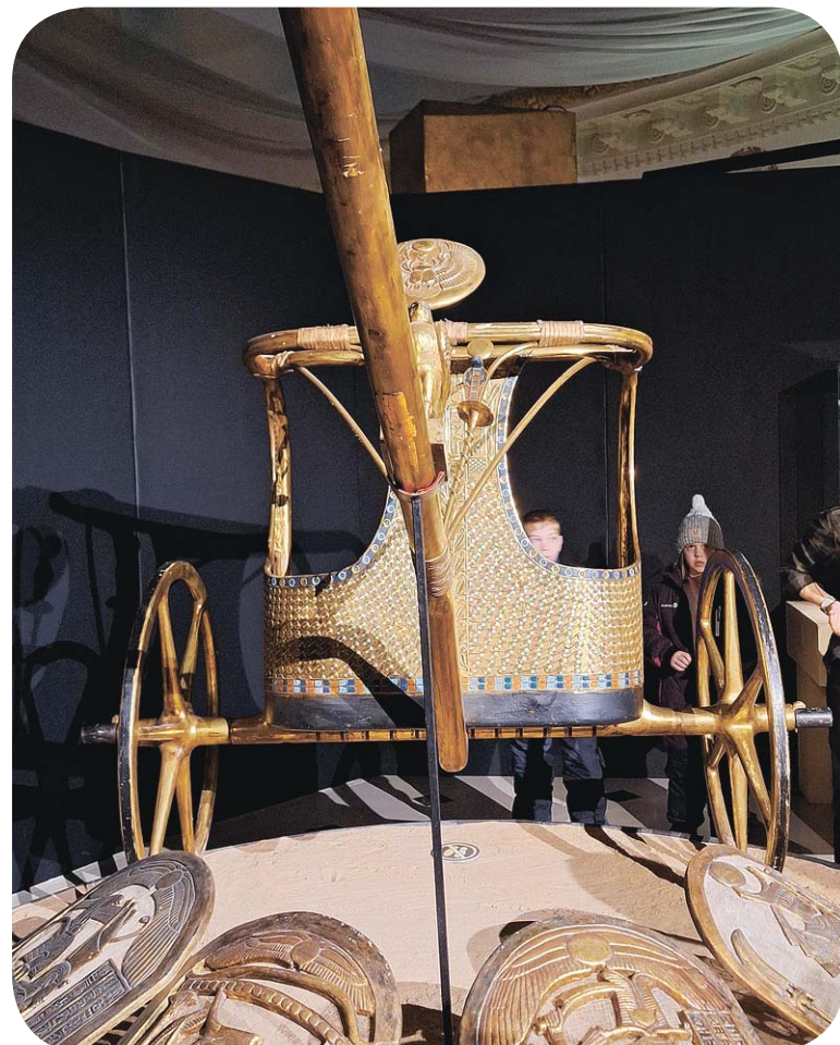
Колесница фараона Тутанхамона