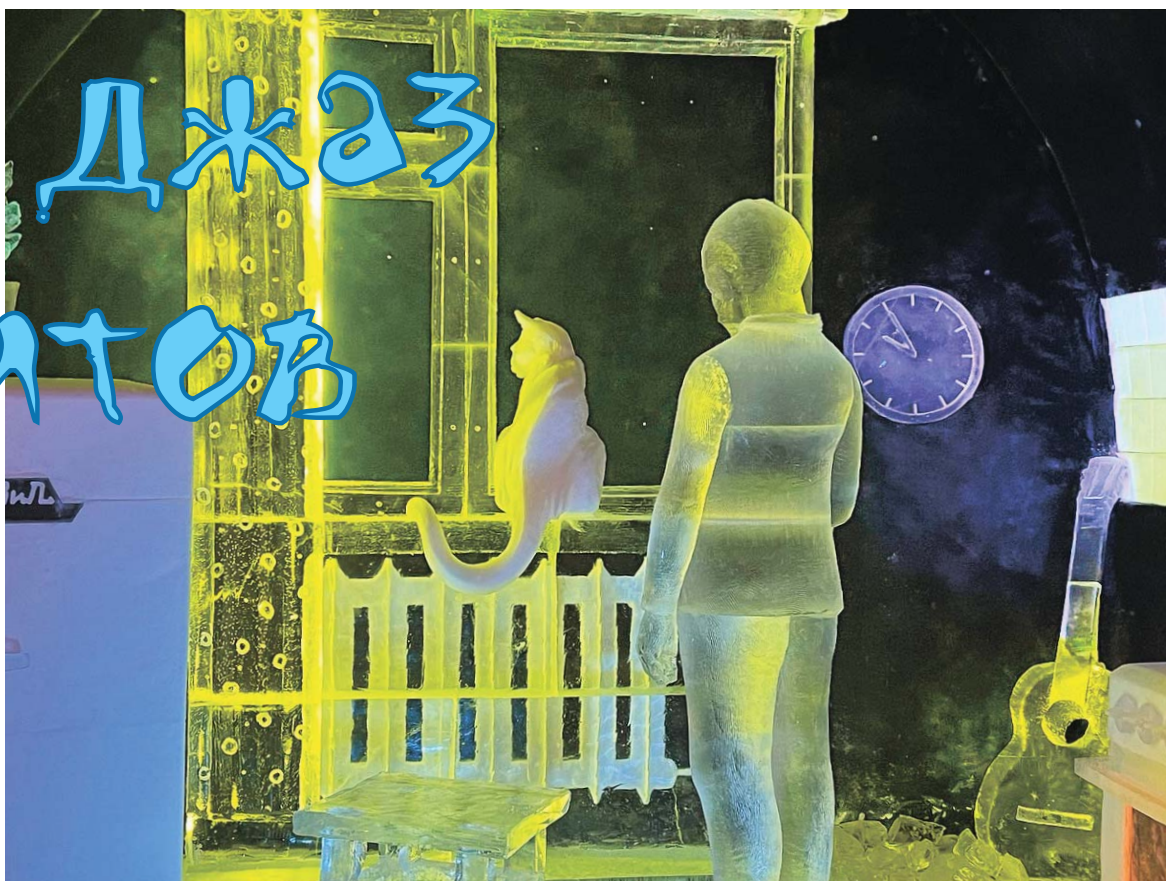
Человек и кошка