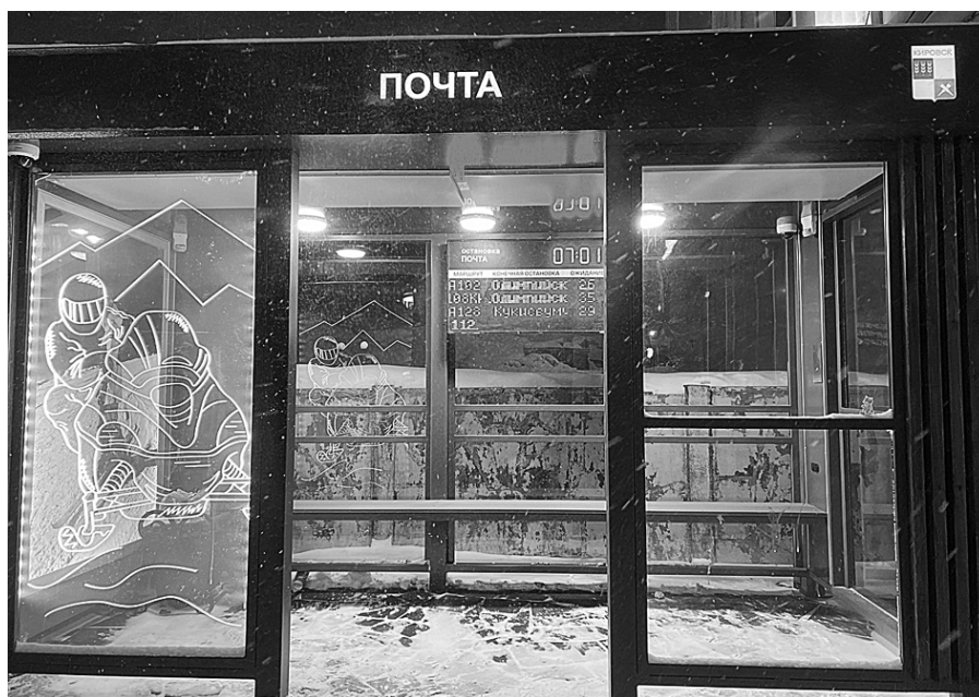
Новые остановки выглядят очень современно

Любовь АБИТОВА, фото со страницы «Курорт Большой Вудъявр» соцсети «ВКонтакте»