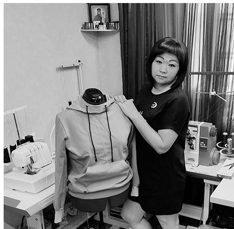
Эти северянки заключили соцконтракт и исполнили свою мечту