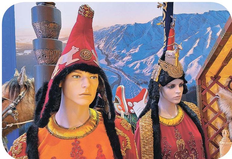
Традиционные костюмы народов России бывают и такими