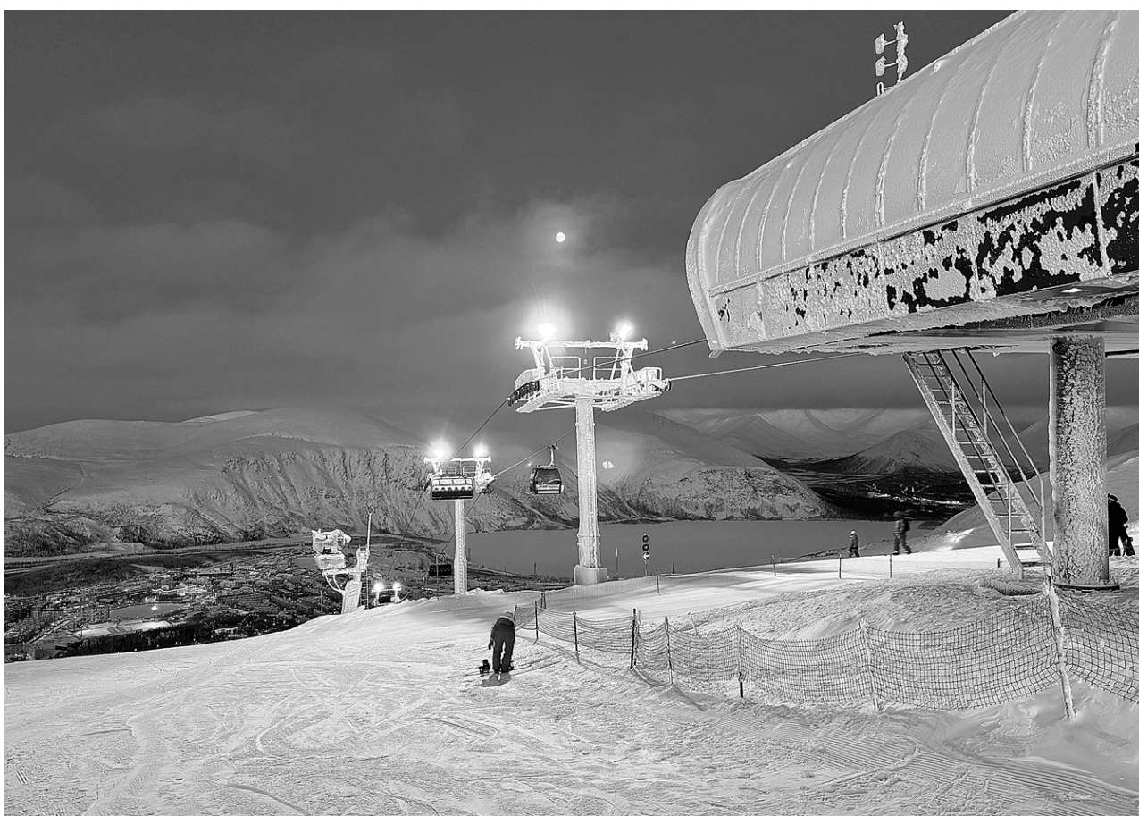
Этот вид известен всей России

И даже сильные морозы, которые стояли в первые дни наступившего 2024 года, не стали помехой для позитивных отзывов об отдыхе в Хибинах от многочисленных туристов. К слову, курорт «Большой Вудъявр» в январе посетили на 25 процентов