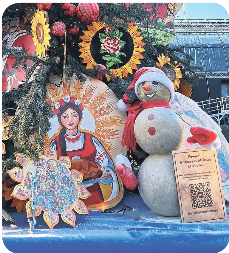
Ёлка от Краснодарского края: подсолнухи, казаки и... песковик с пляжа