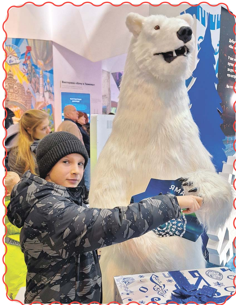
В России есть медведи – бурые и белые!

Правительство Москвы организовало уникальную выставку: