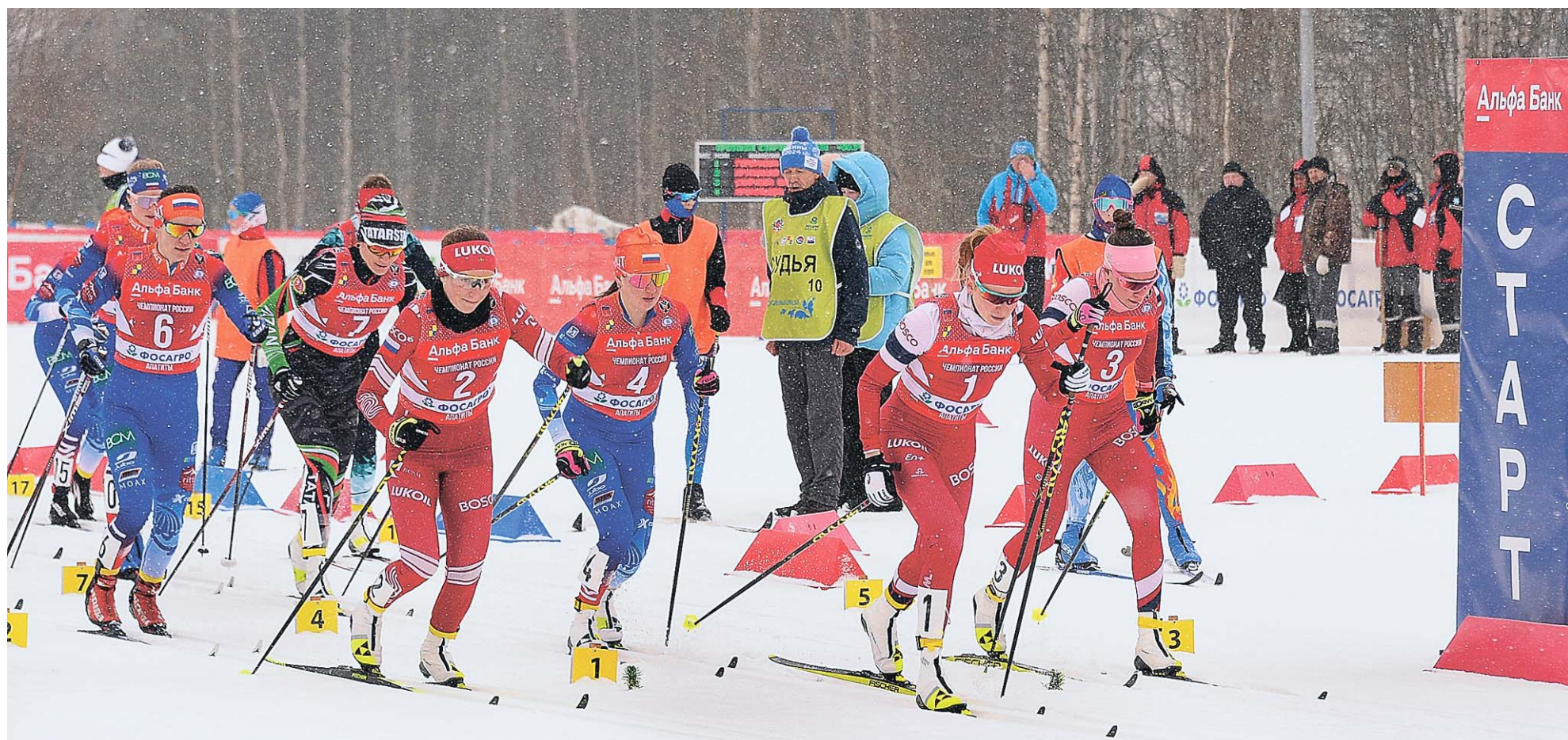
Масс-старт лыжниц. Зрители поддерживали девушек все три часа!