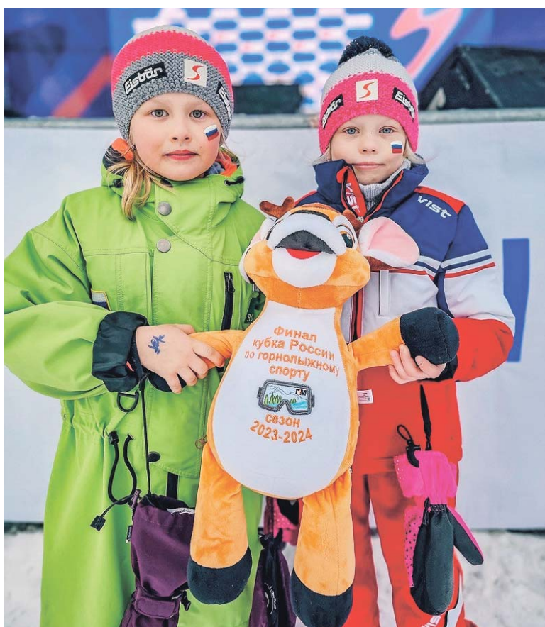
Будущие чемпионки болели от души