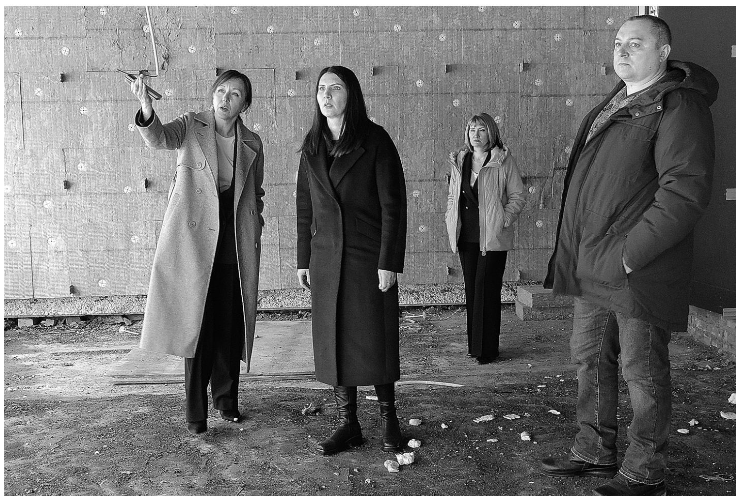
Объёмы работ капитального ремонта в школе № 10 значительные, но на сегодняшний день всё идёт по графику