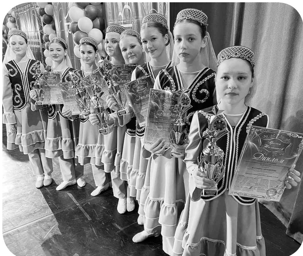
Дипломы за красочный татарский танец