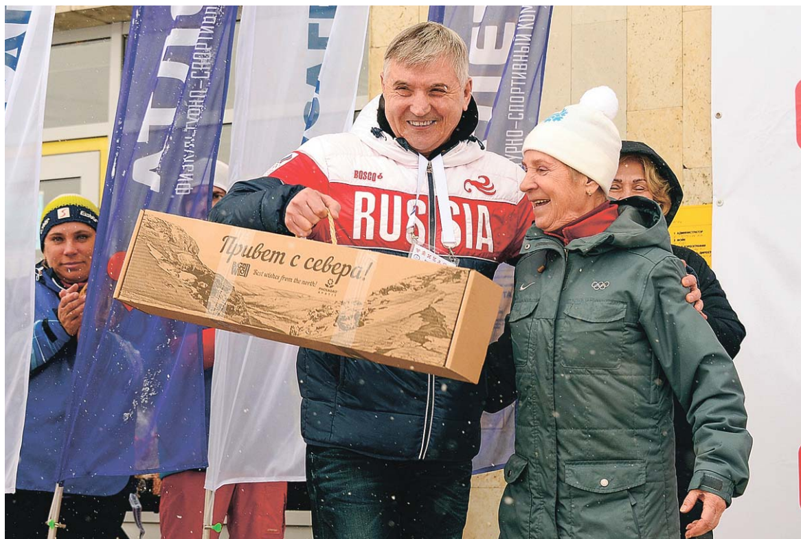
Олимпийской чемпионке Любви Мухачёвой вручили подарок от администрации города

И вот изматывающее состязание позади. Спортсменки приходят к финишу под