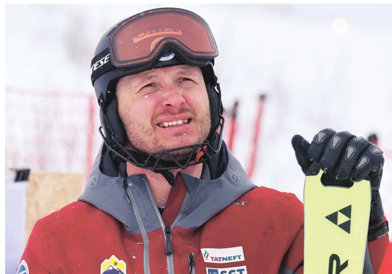
Александр Хорошилов – лидер сборной страны