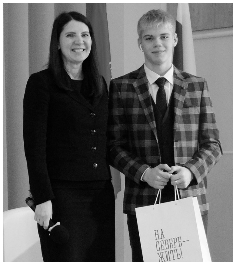
Авторы самых интересных вопросов получили памятные подарки