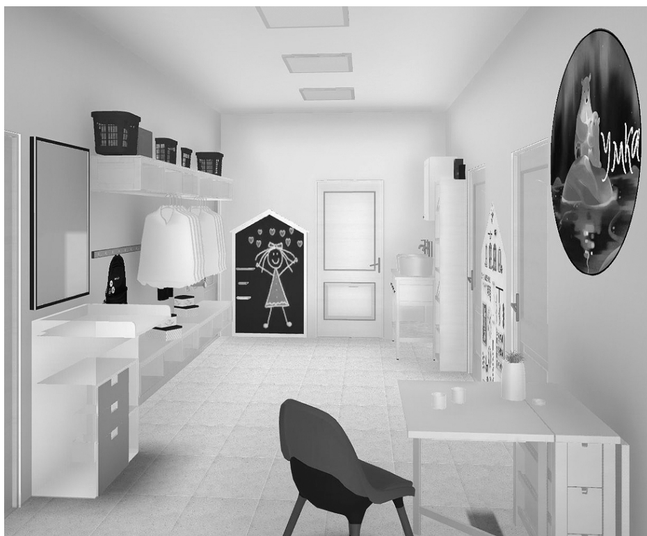
Такой станет группа в детском саду № 21 уже в мае

Ольга ИЛЬНИЦКАЯ, фото из открытых источников