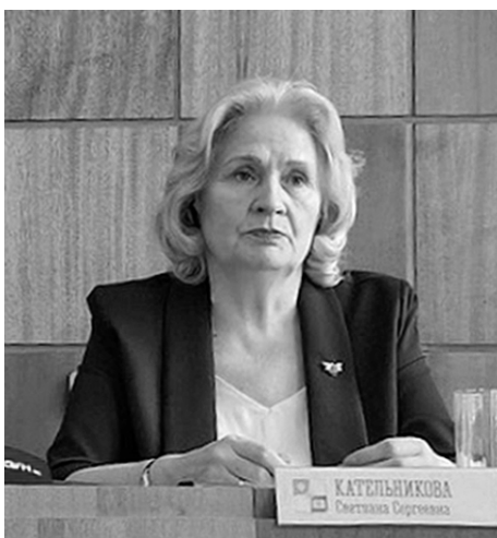
Глава города: «Нужно учесть каждый голос в пользу Апатитов»