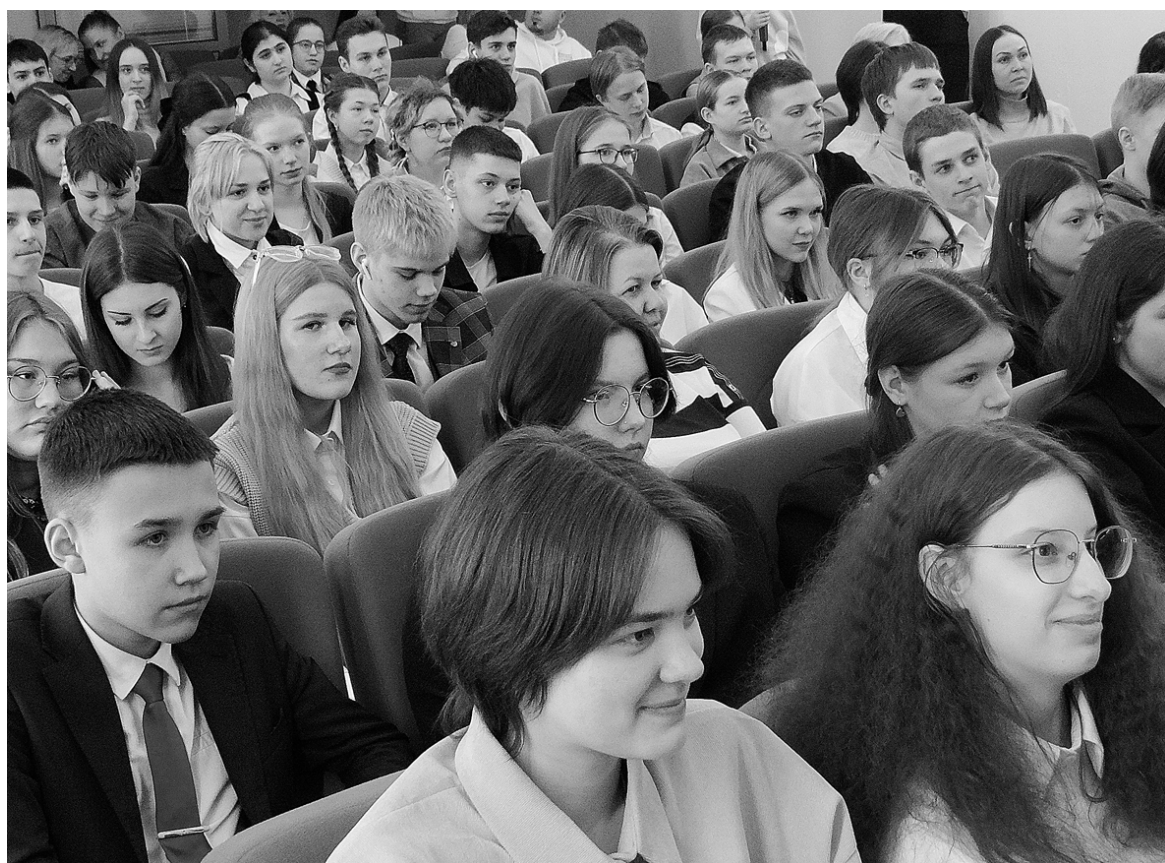
Полтора часа беседы с министром образования пролетели для всех участников встречи незаметно