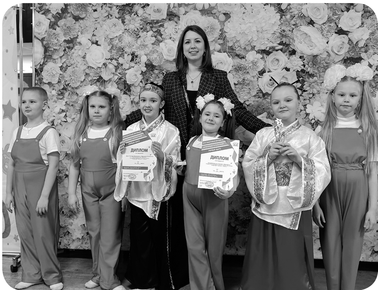
Первые победы вдохновляют!