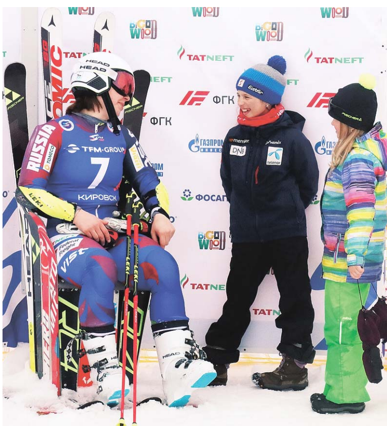
Таланты и поклонницы

Подготовила Вера НИКОЛАЕВА по информации федерации горнолыжного спорта России