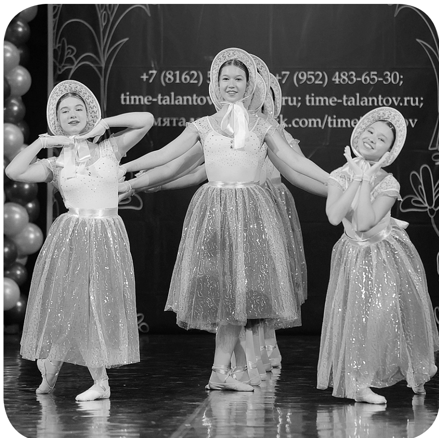
Юные балерины Кировска покорили питерское жюри

Подготовила Вера НИКОЛАЕВА, фото из открытых источников