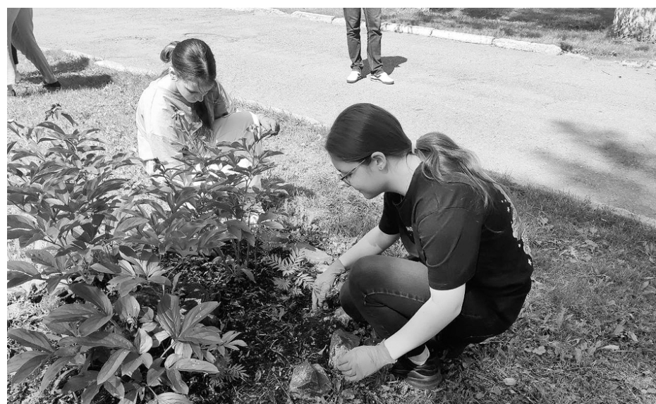
В число временных работ входит и озеленение города

Начато обновление образовательных организаций, выигравших гран-