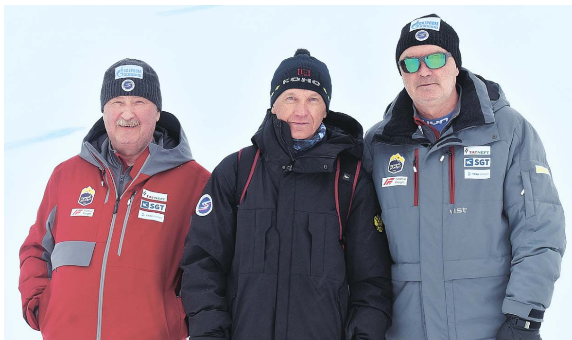
Высший тренерский состав ФГЛР