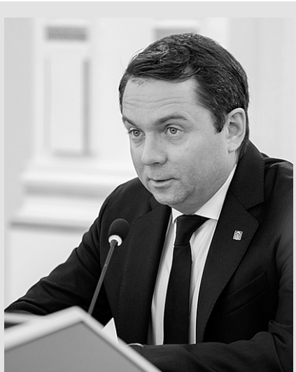
Андрей ЧИБИС, губернатор Мурманской области

Выборы Президента России – безусловно, историческое событие и для нашего региона, и для всей страны. Спасибо всем северянам, которые выполнили свой гражданский и патриотический долг, пришли на избирательные участки либо проголосовали с помощью ДЭГ, тем самым определив стратегию развития нашей страны на следующие шесть лет. Эта консолидация жителей достойна уважения и благодарности.