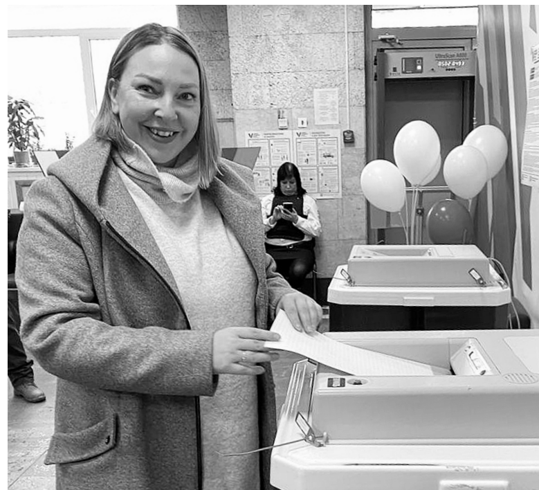
Свои бюллетени избиратели опускали в автоматизированные комплексы обработки