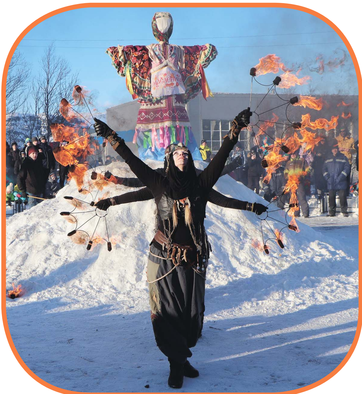
Файер-шоу от татра огня «ОМА»