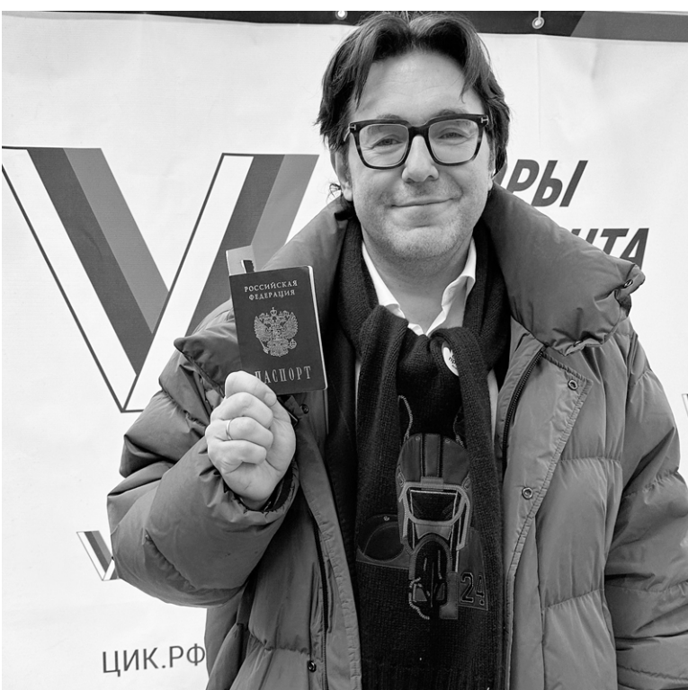
Андрей Малахов специально приехал, чтобы проголосовать в родном городе