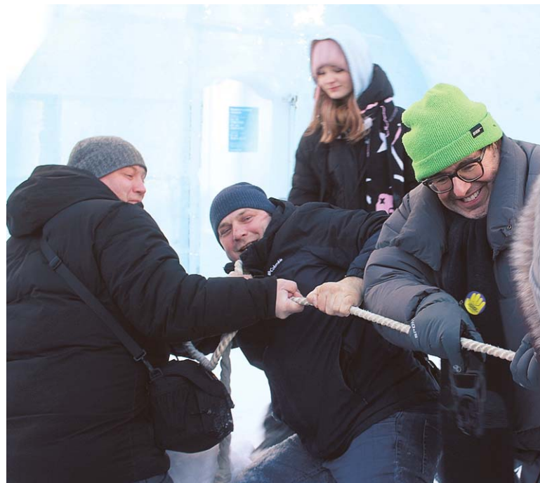
У арт-катка «Сияние» придумали с десяток развлечений для апатитчан