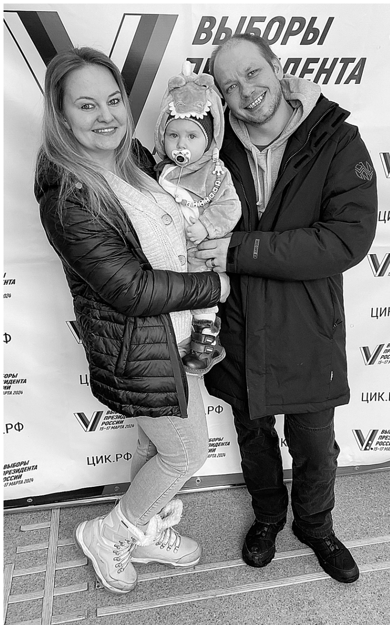
Семья Казьминых: «Мы голосуем за будущее страны и своих детей»