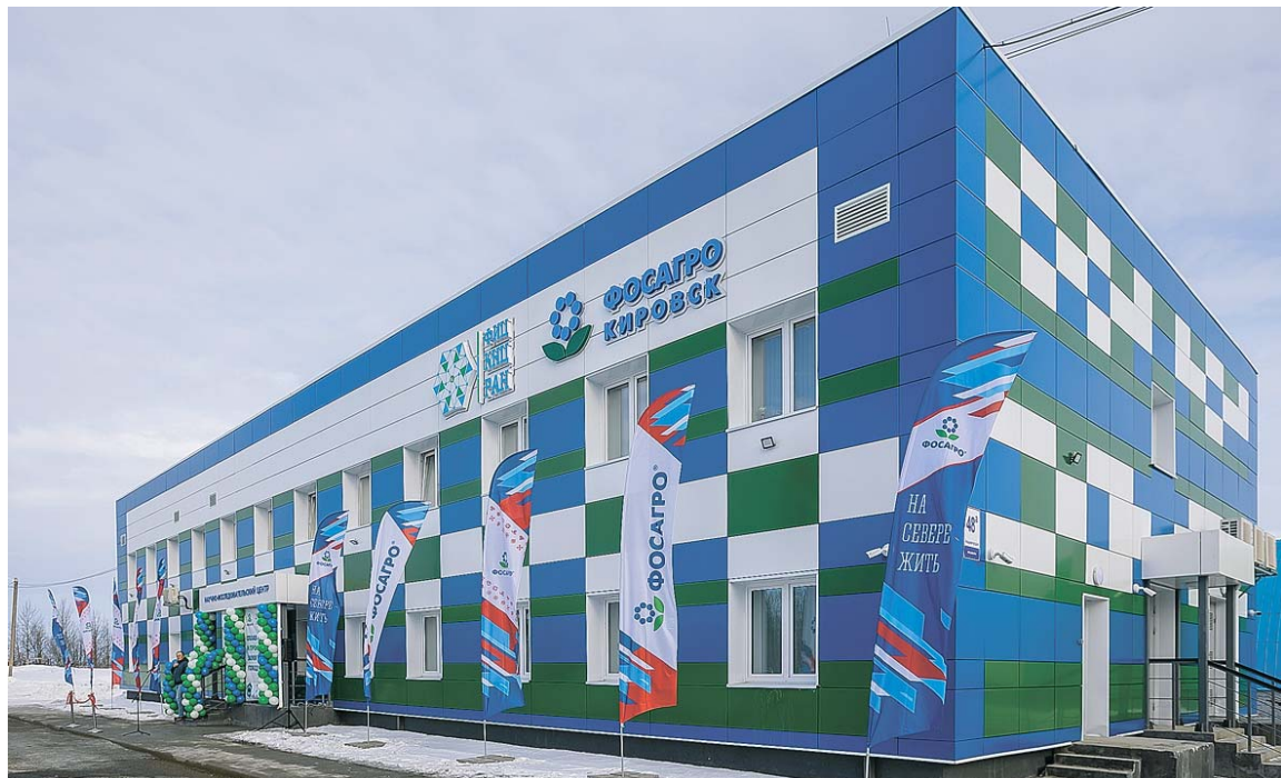
Новое здание находится рядом с институтом химии