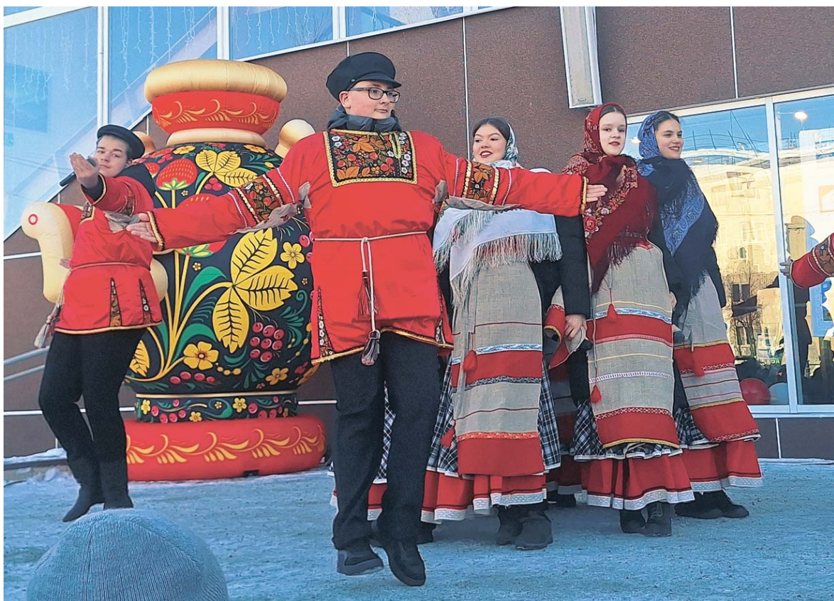
Ансамбль «Забава» веселил гостей

Вера НИКОЛАЕВА