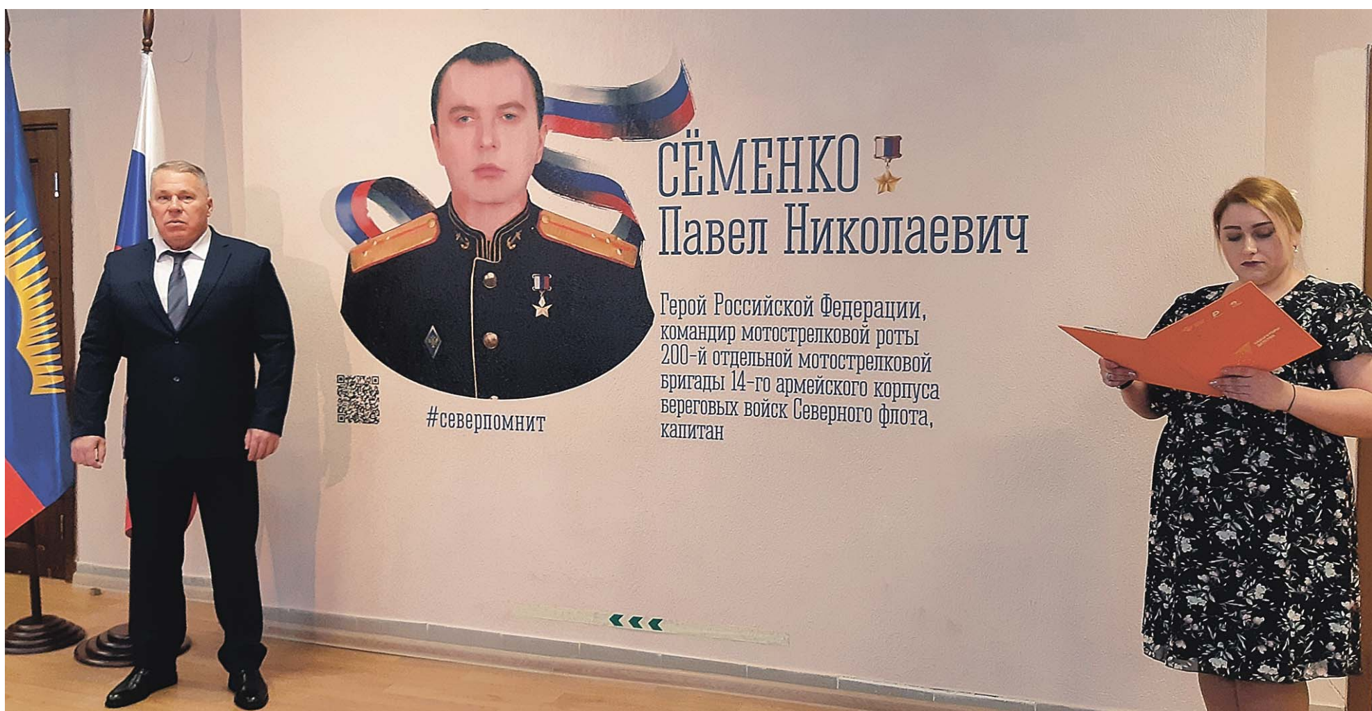
Вадим Турчинов: «Лица настоящих героев всегда должны быть на виду»