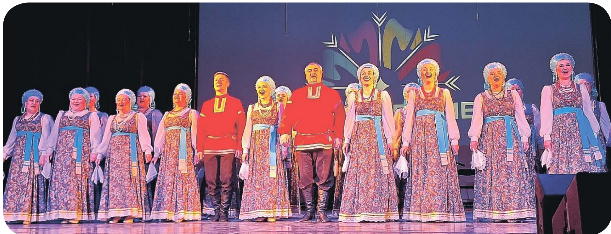
Ансамбль песни и танца «Россия» имени Владимира Колбасы