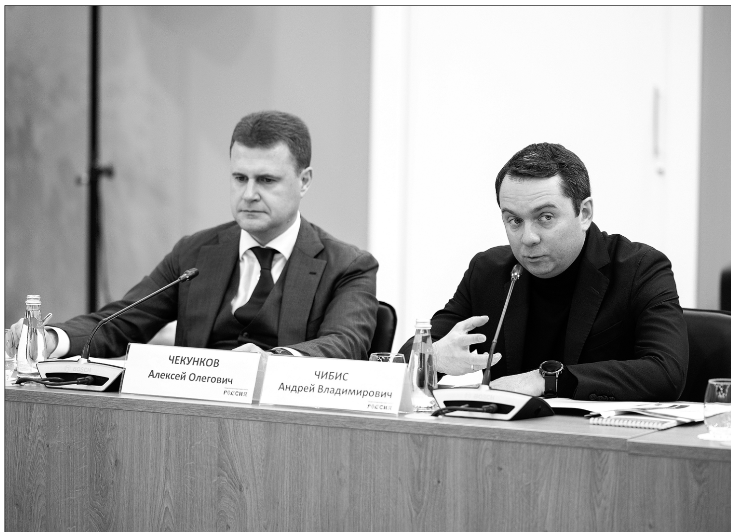
Губернатор Мурманской области предложил приоритезировать национальные проекты для Арктики по аналогии с Дальним Востоком

80 процентов заполярных школьников получают дополнительное образование в рамках президентского нацпроекта. В