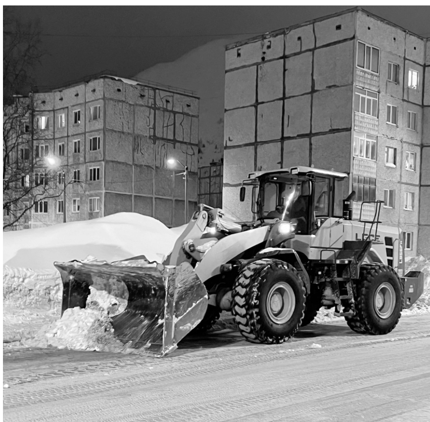
Улица Олимпийская: вечерняя расчистка трассы

Обильные снегопады существенно прибавляют работы дорожным коммунальным службам. По официальной информации, с начала зимы в этом году только с городских территорий уже вывезено более 170 тысяч кубометров