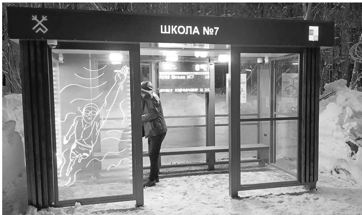
Новые остановки функциональны и комфортны

Любовь АБИТОВА, фото автора и со страницы «Твой Кировск» соцсети «ВКонтакте»