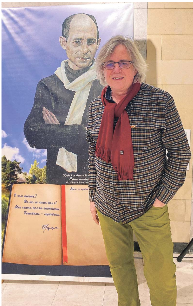
Известный поэт-песенник Александр Шаганов выделил время в своём графике выступлений в Заполярье и заглянул в библиотеку на Чтения

Гость из Москвы сказал, что он в восторге от встречи с апатитчанами и приятно удивлён, что в городе проводят такие тёплые культурные мероприятия. В завершение поэт-песенник исполнил свою известную «Там, за туманами», добавив к знакомым строчкам: «Ждёт Севастополь, ждёт Камчатка, ждёт Кронштадт – и Апатиты ждут родных своих ребят...»