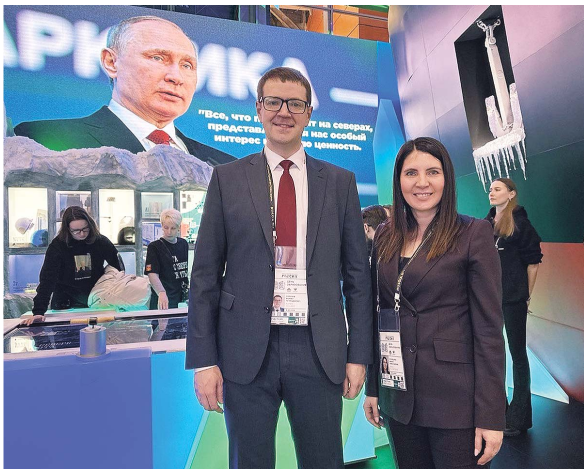
Министры образования Республики Карелия и Мурманской области Роман Голубев и Диана Кузнецова