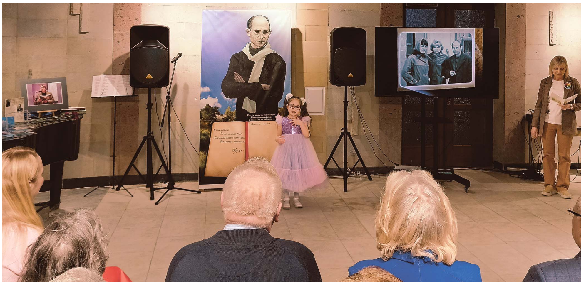
Юные тещы выбрали небольшие стихотворения Николая Рубцова о животных и природе