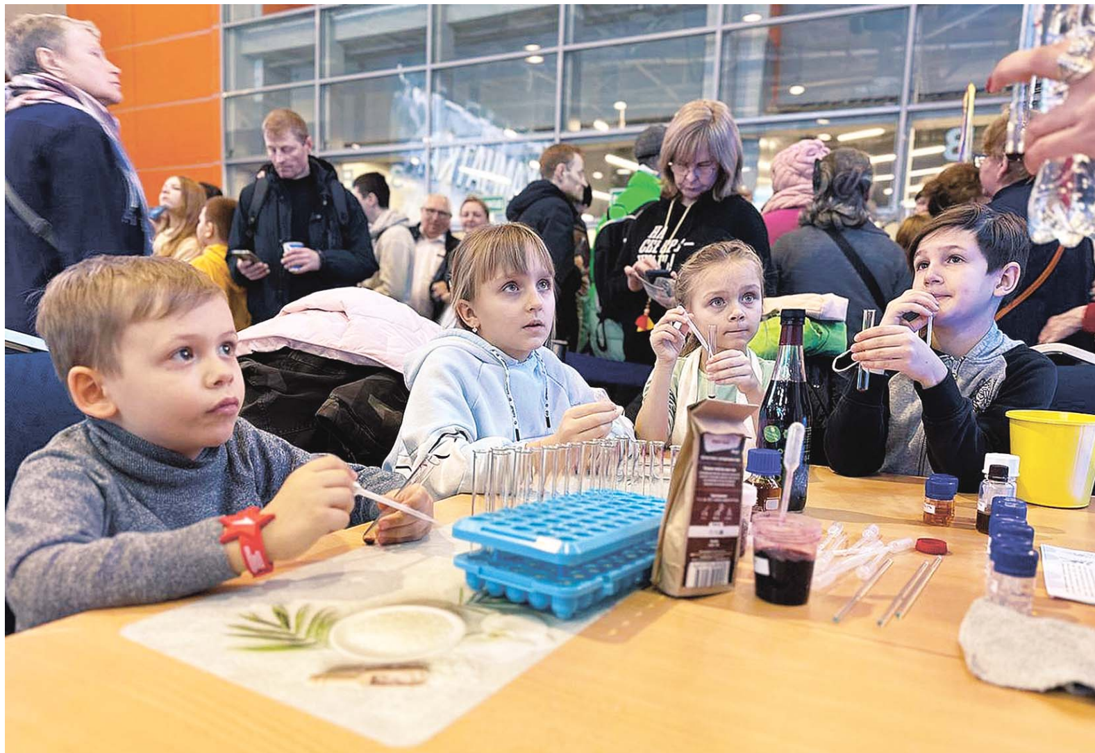
Безопасные реактивы и очень интересное занятие!

В лаборатории молекулярной кухни участники познакомились с новейшими достижениями науки в технологии при-