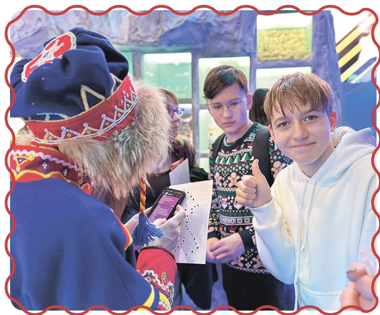
Многообразие Кольского Заполярья впечатлило юных гостей

– В целом выставка-форум «Россия» в День образования была очень схожа по наполнению с нашим муниципальным фестивалем «Наука 0+», только