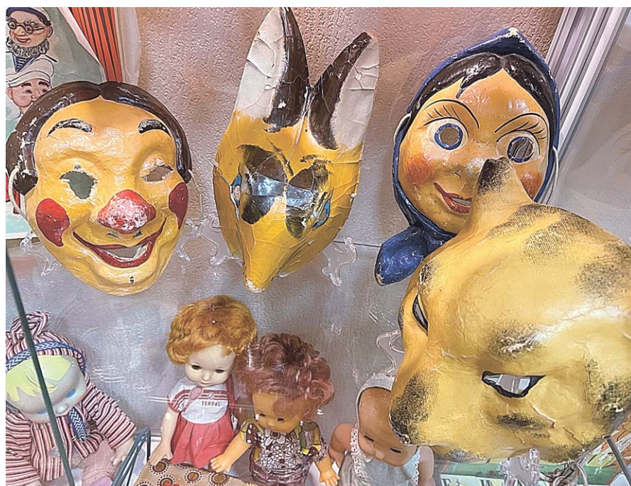
Этим маскам – не один десяток лет