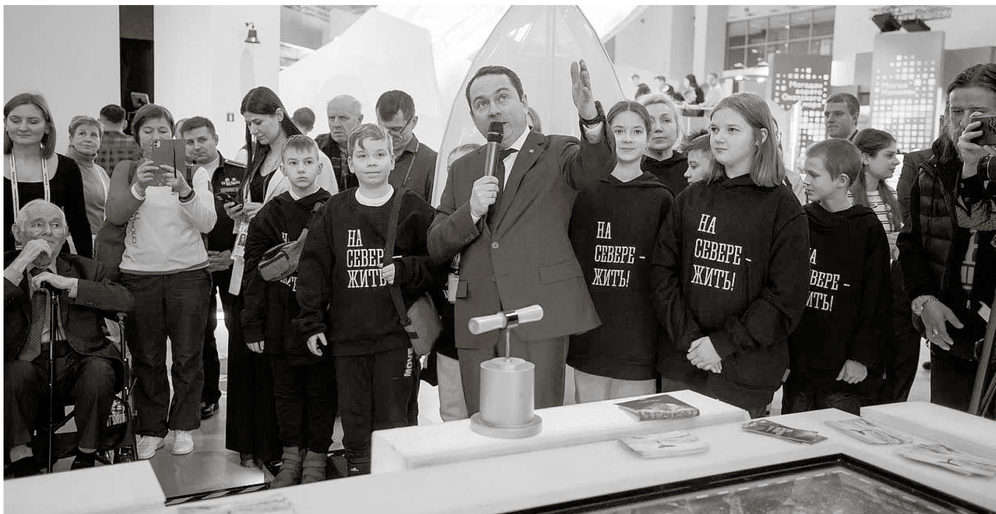
Андрей Чибис провёл экскурсию по стенду Мурманской области на международной выставке-форуме «Россия»