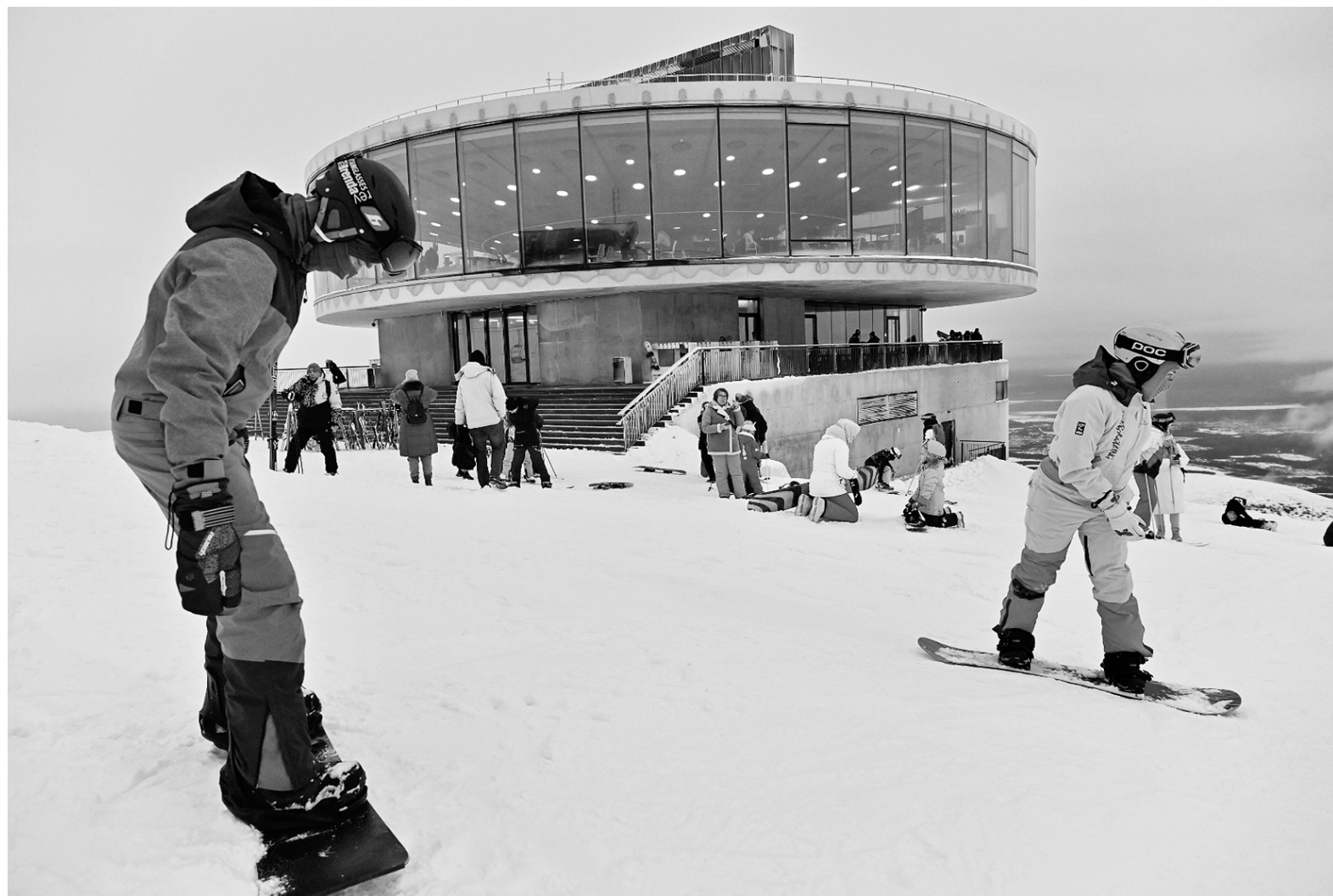
Проехать по свежему снегу ноября — прекрасно!

Вслед за ростом туристического потока на курорте постоянно ведётся работа по развитию его инфраструктуры и повышению качества сервиса. Сегодня «Большой Вудъявр» — это 30 километров трасс разного уровня сложности, перепад высот на которых достигает 600 метров. Здесь всё продумано до мелочей — прокат инвентаря и снаряжения, к услугам гостей опытные инструкторы, специалисты идеально готовят трассы благодаря системе искусственного оснежения, есть комфортное освещение в