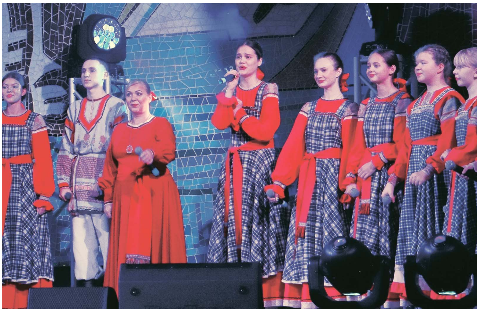
Ансамбль «Забава» исполняет песню «Россия моя»