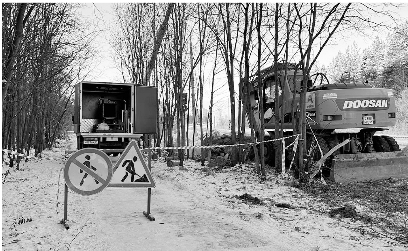
Аварию на теплотрассе проспекта Сидоренко устранили максимально оперативно

Ольга ИЛЬНИЦКАЯ, фото из открытых источников