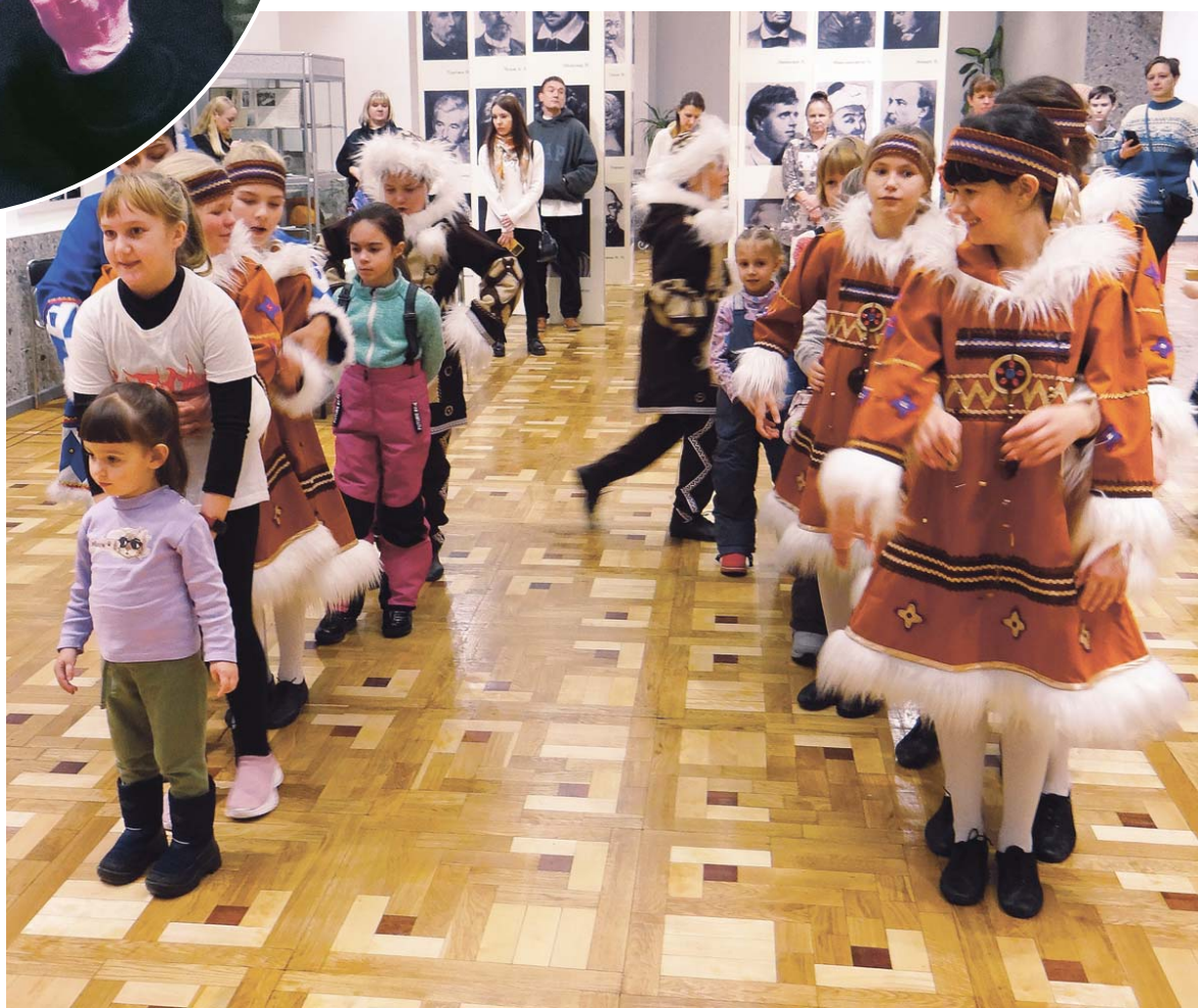
Игры у русских и саамских детей одинаково весёлые!