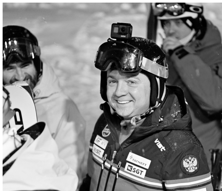
Губернатор области Андрей Чибис оценил трассы Хибин на «пятерку»!