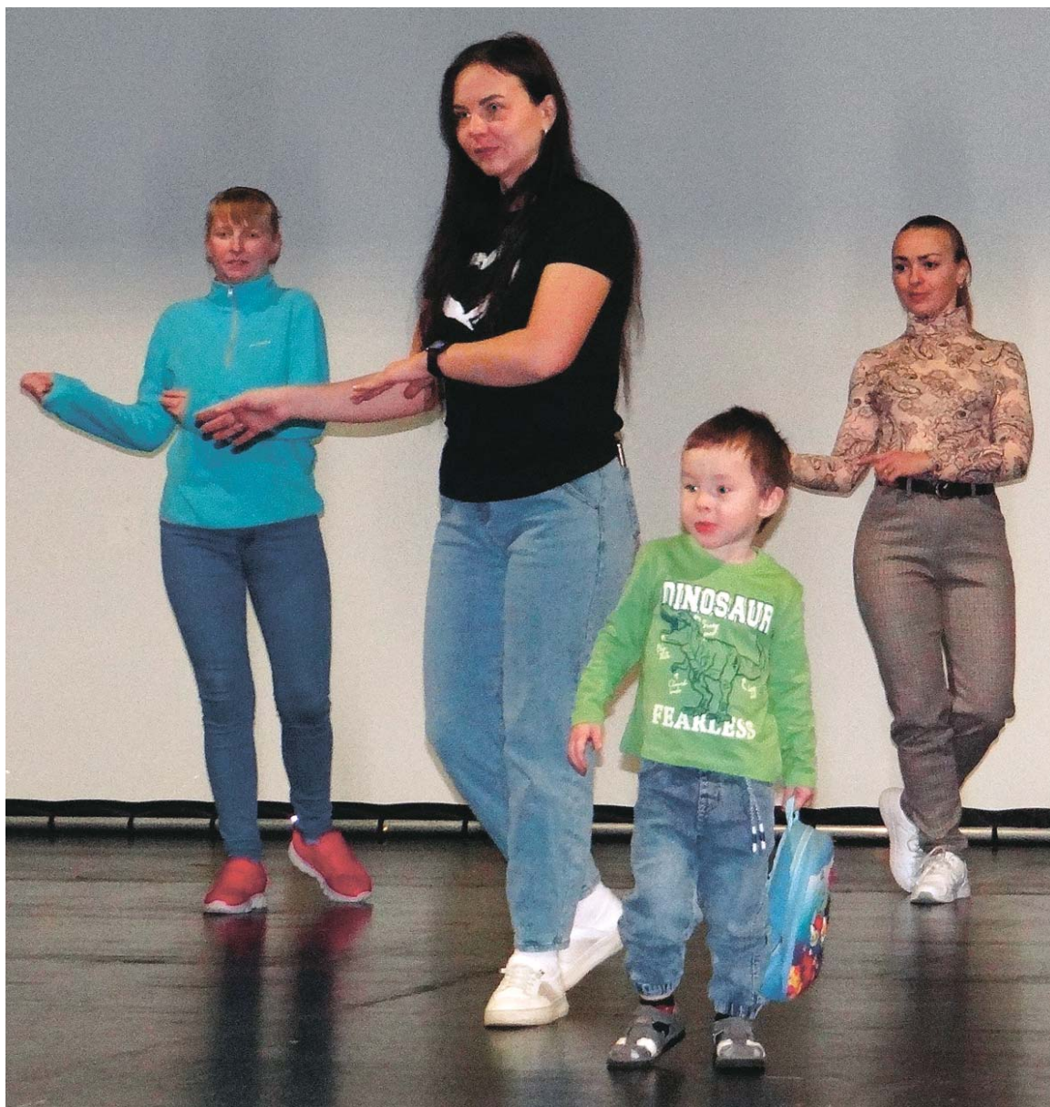
Лучшая поддержка – вместе и на репетиции, и на конкурс!

– Захотела доказать себе, что и я чего-то стою. Да, у меня есть семья, две замечательные дочери, работа – но всё шло так спокойно и ровно, что я перестала к чему-то стре-