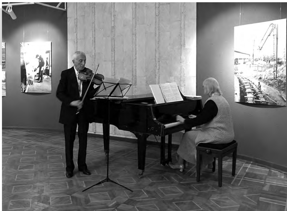
Библиотеки – очаги культуры каждого города

– Ещё одно направление плана «На Севере – жить!» – грантовые конкурсы. В этом году 34 творческих проекта получи-