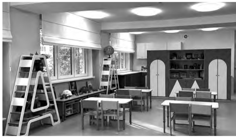
Развивающее пространство для малышек в детском саду