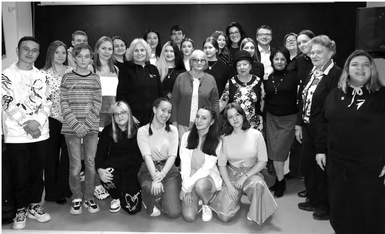
В Апатитах много добровольцев, готовых отдавать своё время и силы тем, кому требуется помощь!