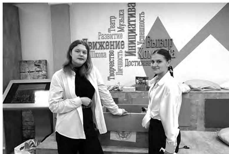
Центр детских инициатив в школе № 5 никогда не пустует

– Пока да, и только в сфере образования. Но уже готов работать и по области, нужный опыт есть!