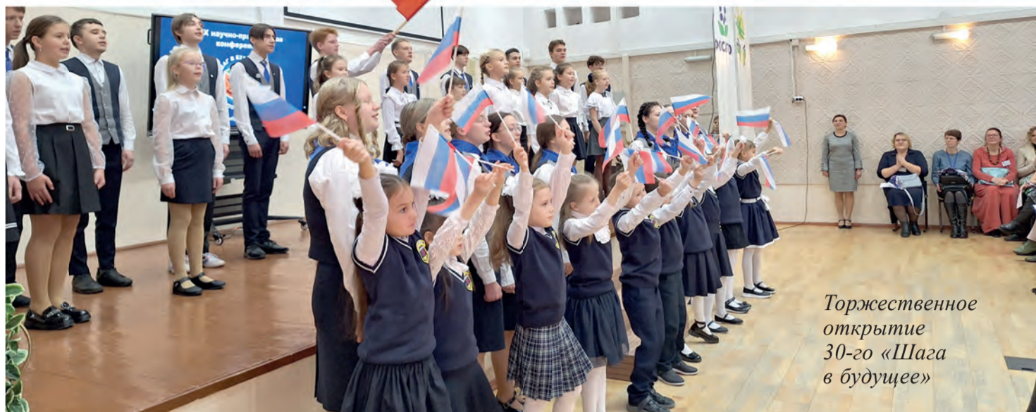
Торжественное открытие 30-го «Шага в будущее»