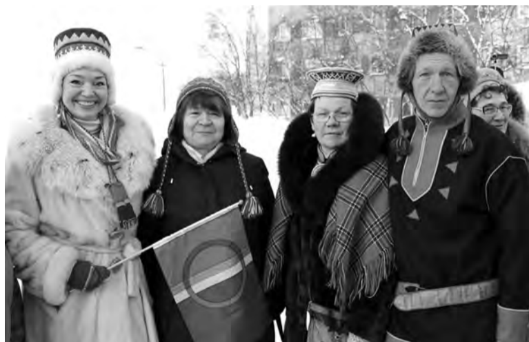
Крайне важно сохранять традиции и самобытность коренных народов

ного минкульта для НКО реализует проект «Творческий бизнес «Придумано в Арктике»». Организация проведёт исследование творческих товаров и услуг, создаваемых малым и средним бизнесом Мурманской области, по итогам которого будет создан региональный реестр субъектов креативных индустрий. Творческие предприниматели будут представлены на созданном интернет-портале.