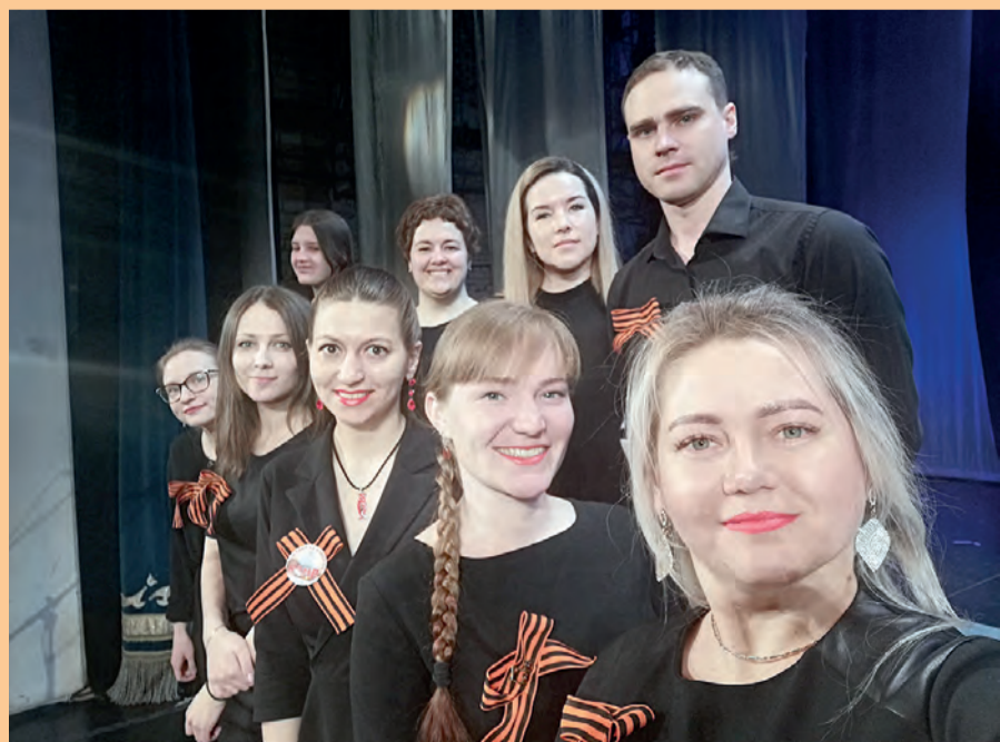
Хор «Виктория» выступает на всех городских праздниках. С неизменным успехом!

Ольга ИЛЬНИЦКАЯ