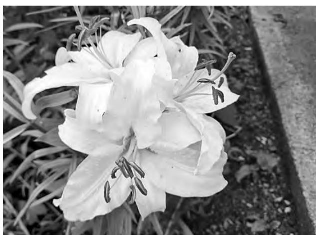
Этой осенью цветы держатся и в Апатитах, и в Кировске особенно долго

Апатиты. Муниципалитет победил в первом региональном конкурсе по озеленению.