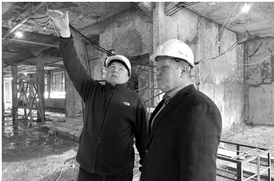
Масштабные работы – на постоянном контроле главы администрации

Напомним, на первом этаже «Большевика» после реконструкции появятся четыре кинозала, планетарий, который будет вмещать до 42 человек и проводить до десяти сеансов в день. Два кинозала смогут принять по 150 человек и два – по 140. В подвальной части обновлённого здания появится гардероб, на вто-