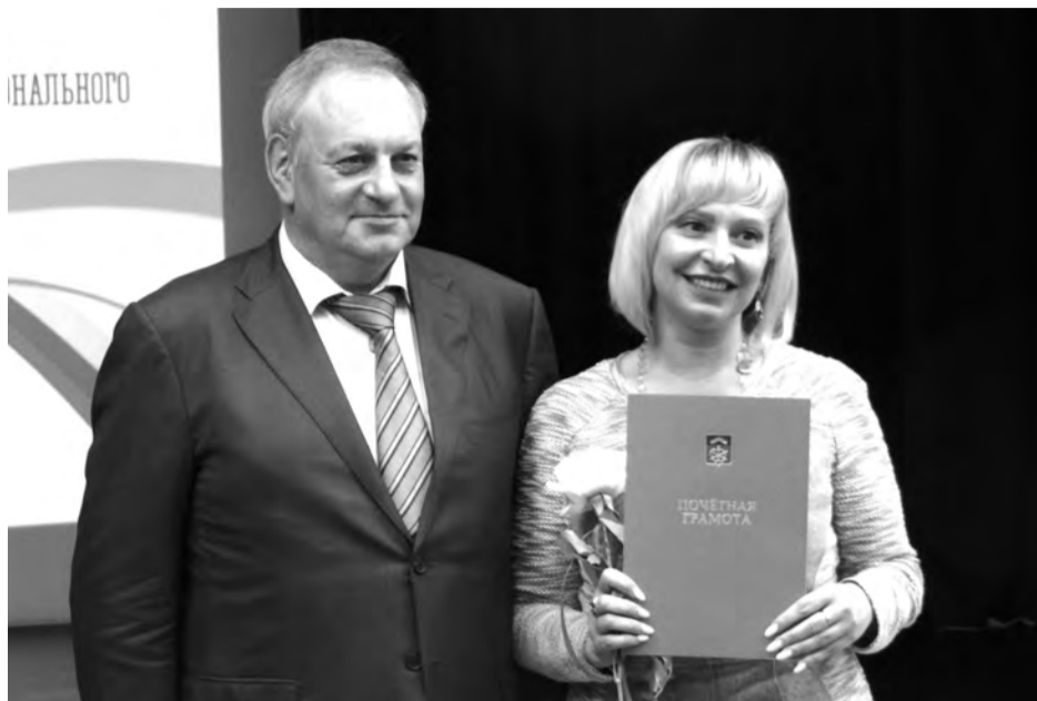
Награды в сентябре – хорошая мотивация держать высокую планку весь учебный год!

Апатиты. Традиционное сентябрьское совещание работников образования прошло на нескольких площадках.