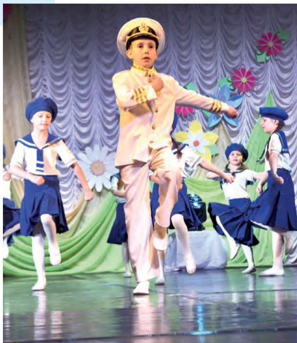
В творческих коллективах Дворца культуры занимаются и взрослые, и совсем юные артисты