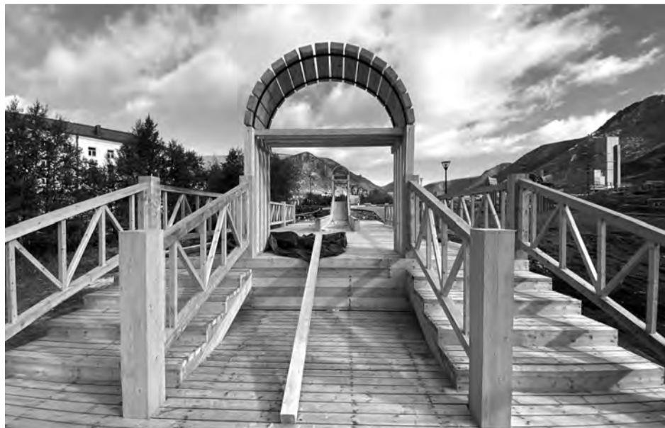
Сквер в микрорайоне Кукисвумчорр становится местом притяжения горожан

Губернатор поставил задачу социальному блоку регионального правительства рассмотреть представленные подходы и подготовить комплексную программу.