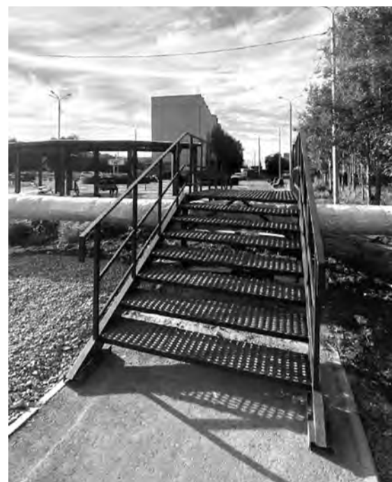
Теперь все дороги к школе № 4 удобны и безопасны

смонтировали скейт-парк; для самых маленьких северян, проживающих в Териберке и Оленьей Губе, приобрели зимние деревянные горки; в Краснощелье оборудовали площадку для семейного отдыха; в Варзуге и Чавангье старые мостки заменили на новые деревянные тротуары.