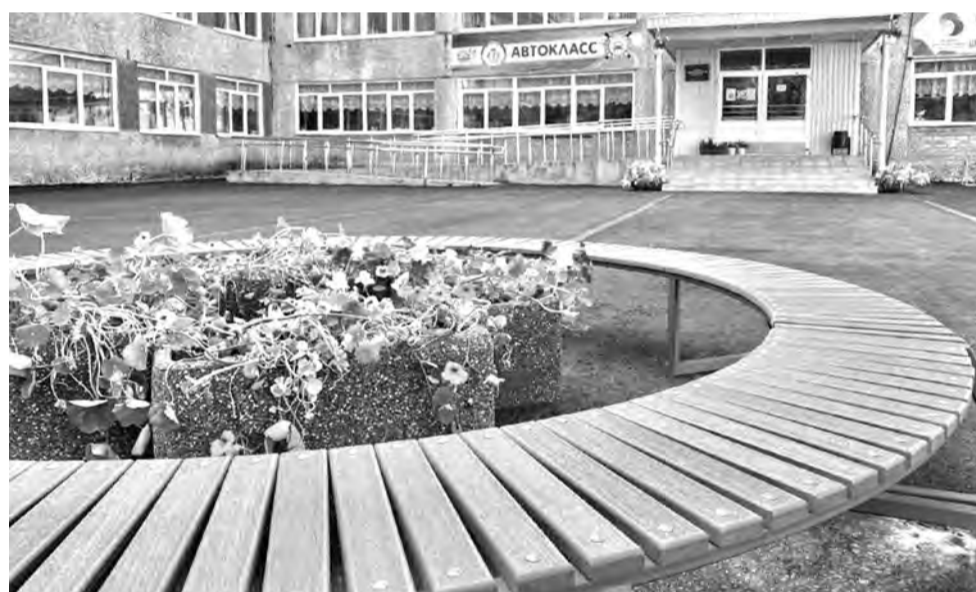
Обновлённый двор школы № 14

62 проекта в разных муниципалитетах уже получили финансовую поддержку в рамках губернаторской программы «На Севере – твой проект»