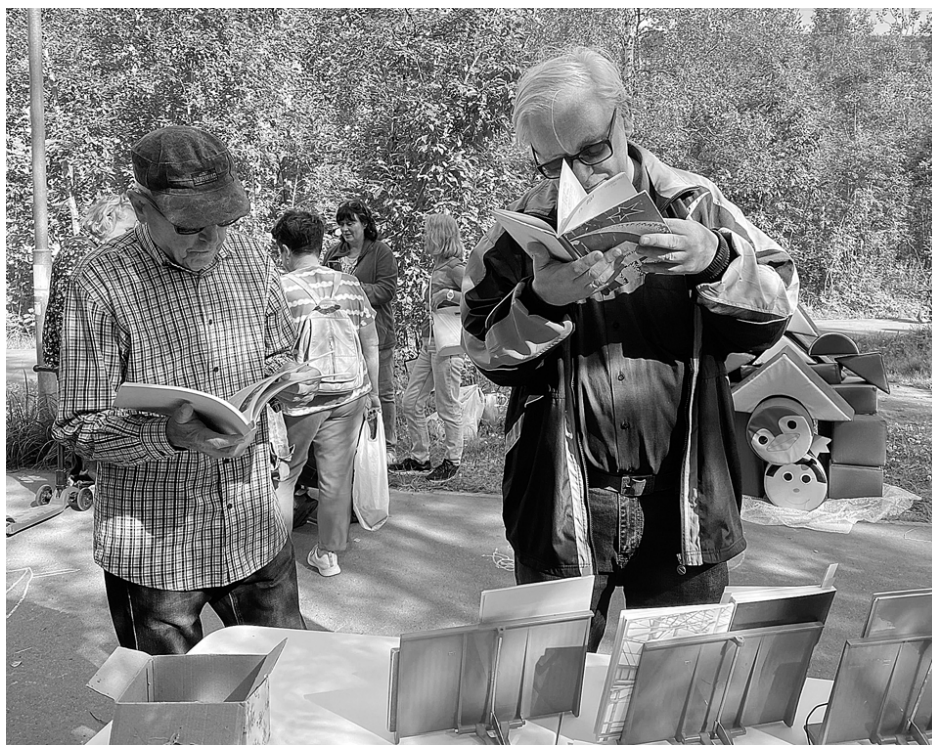
Листая страницы книг, хранящих историю людей – строителей Апатитов

Ольга ИЛЬНИЦКАЯ