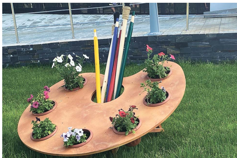
Необычная инсталляция украшает территорию молодёжно-культурного центра «ДРОЗД-Хибины»

которыми в мэрии налажено тесное сотрудничество. Работники ПОСВИР отбирают сорта растений, наиболее устойчивые к особенностям капризного северного лета, тем самым внося вместе с администрацией Кировска заметный вклад в озеленение города. Они также высаживают деревья и кустарники, ухаживают за посадками. Так, на центральной площади после большой реконструкции можно увидеть сотни