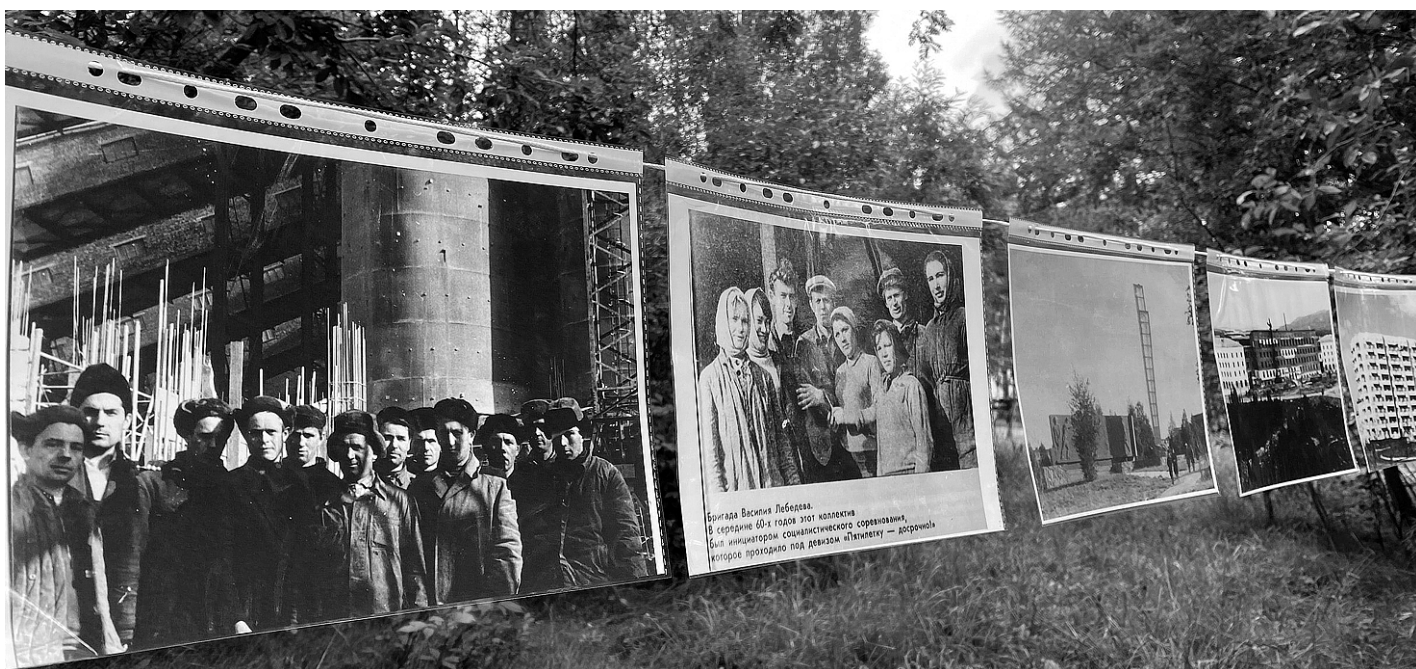
Одна из самых любимых экспозиций гостей – документальные снимки разных лет

Апатиты. Работы по обустройству «островков безопасности» в завершающей стадии, в городе их появилось четыре: один у бывшего магазина «Север», два – в Старых Апатитах возле спуска с путепровода и ещё один – при въезде в город на улице Жемчужной. На объектах осталось только разместить дорожные знаки и нанести на бортовые камни дорожную вертикальную разметку – это позволит сделать островки более заметными на проезжей части в тёмное время суток.