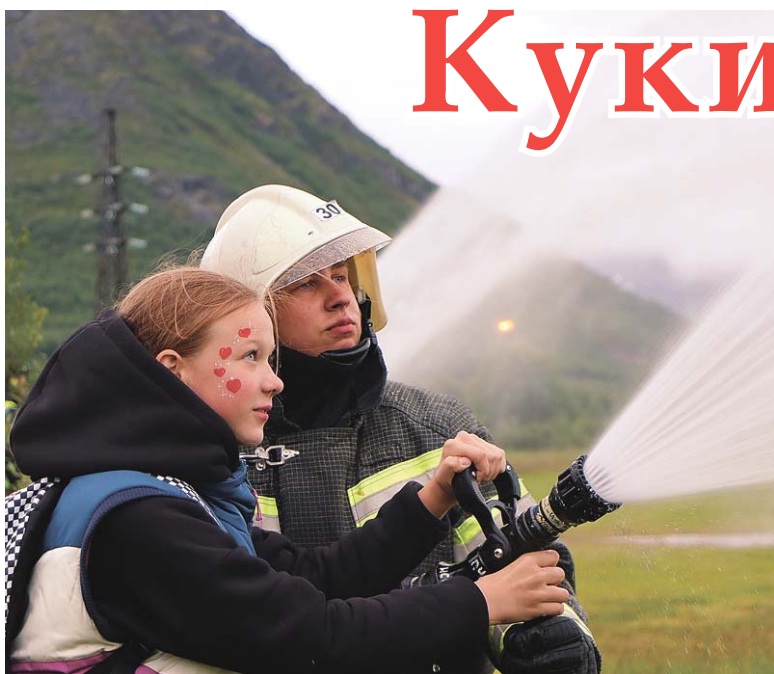
Наблюдать работу пожарных всегда интересно