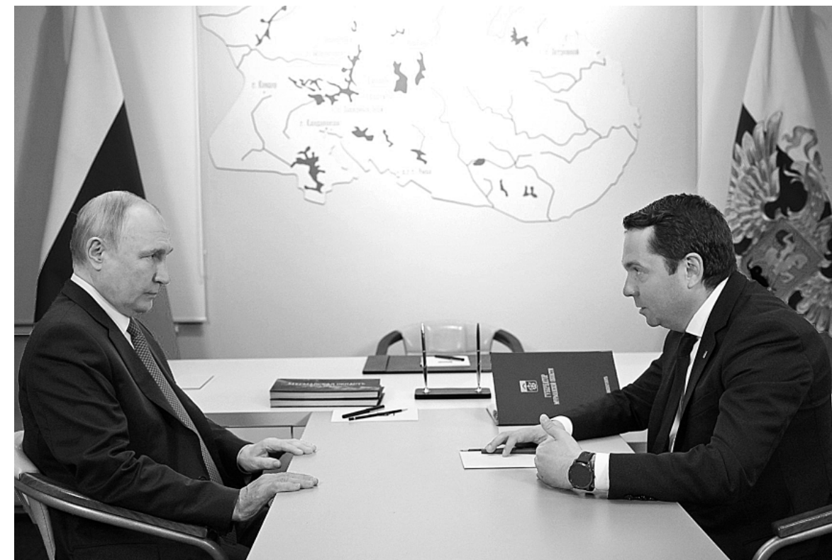
Президент России Владимир Путин и губернатор Мурманской области Андрей Чибис.

– Общий объём затрат, необходимый для создания надлежащих условий для жизни и службы тех, кто обеспечивает нашу безопасность, – 283,5 миллиарда рублей. Это строительство новых домов и капремонт существую-