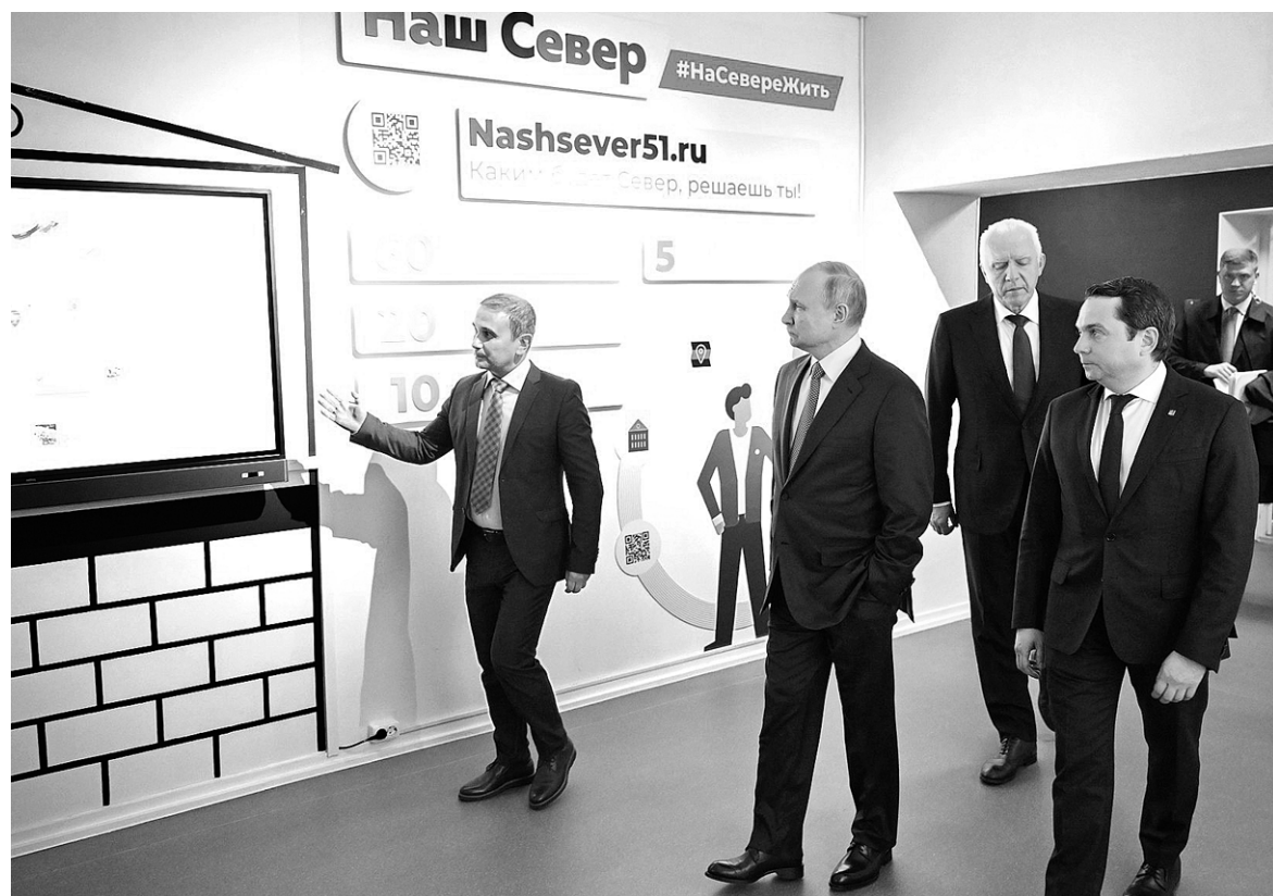
Осмотр Центра управления регионом Мурманской области.

Подготовила Вера НИКОЛАЕВА, по информации, предоставленной мининформ политики Мурманской области