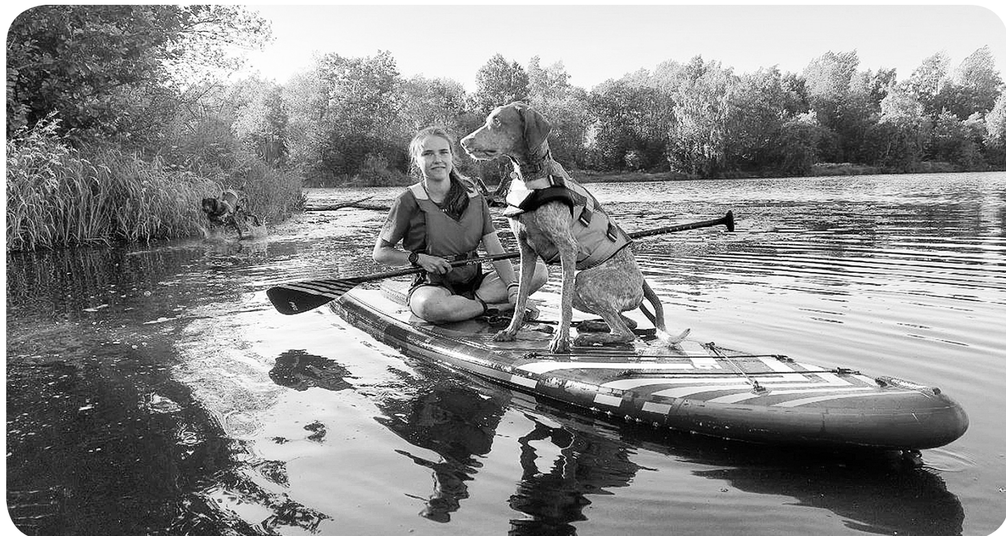
Озеро. Сап. Девочка. Собака

Ольга ИЛЬНИЦКАЯ