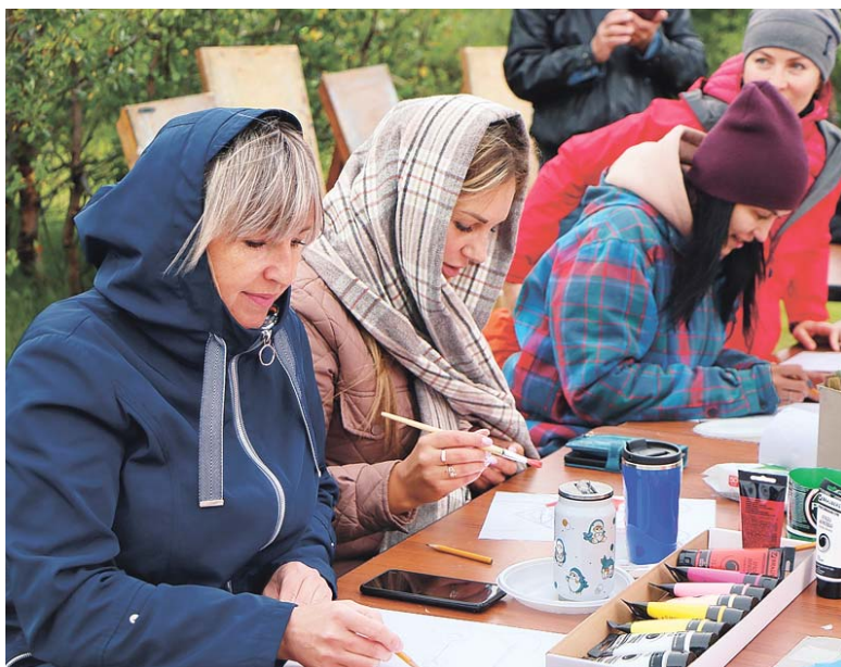
Мастер-класс от известного художника

Кировск. На поле Умецкого состоялся праздник, посвящённый дню рождения микрорайона.