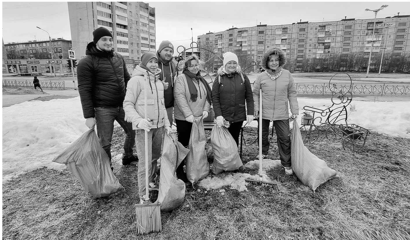
Апатитчане все вместе подготовили участок для благоустройства