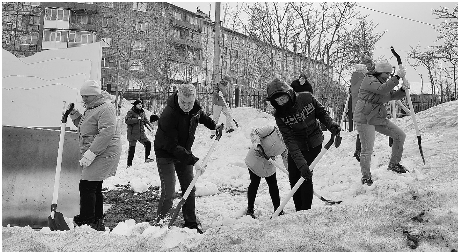
Кировчане вышли на всероссийский субботник