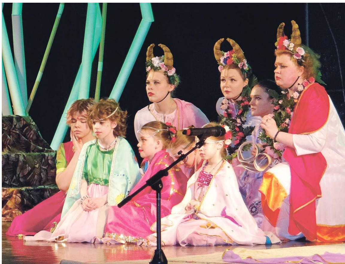
Артисты студий «Диалог» и «Театрашка»