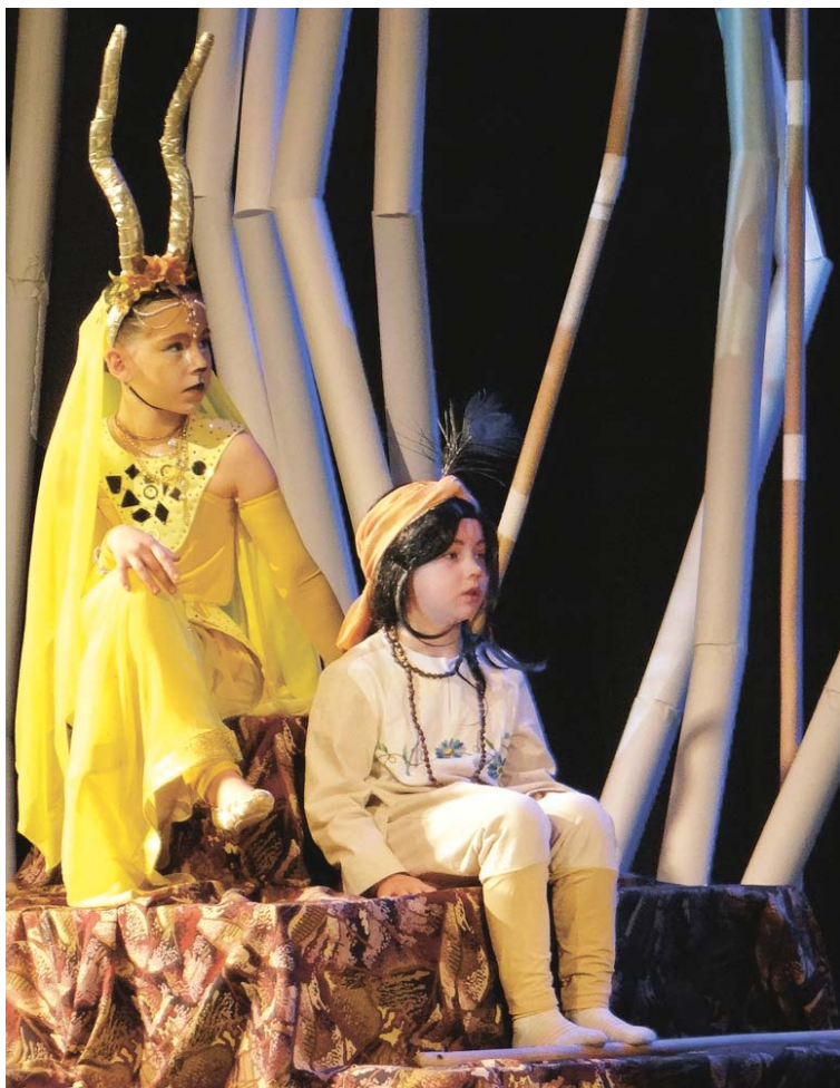
Золотая Антилопа и Пастушок

Апатиты. Во Дворце культуры показали «Легенду о Золотой Антилопе».