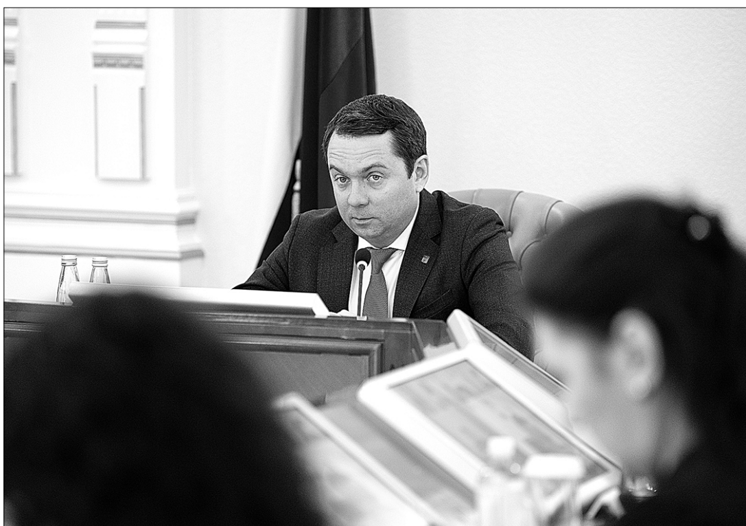
Андрей Чибис: «Региону нужны технические кадры»

Продолжается приёмная кампания на программы высшего образования. В этом году абитуриенты будут подавать документы уже в объединённый Мурманский арктический университет.