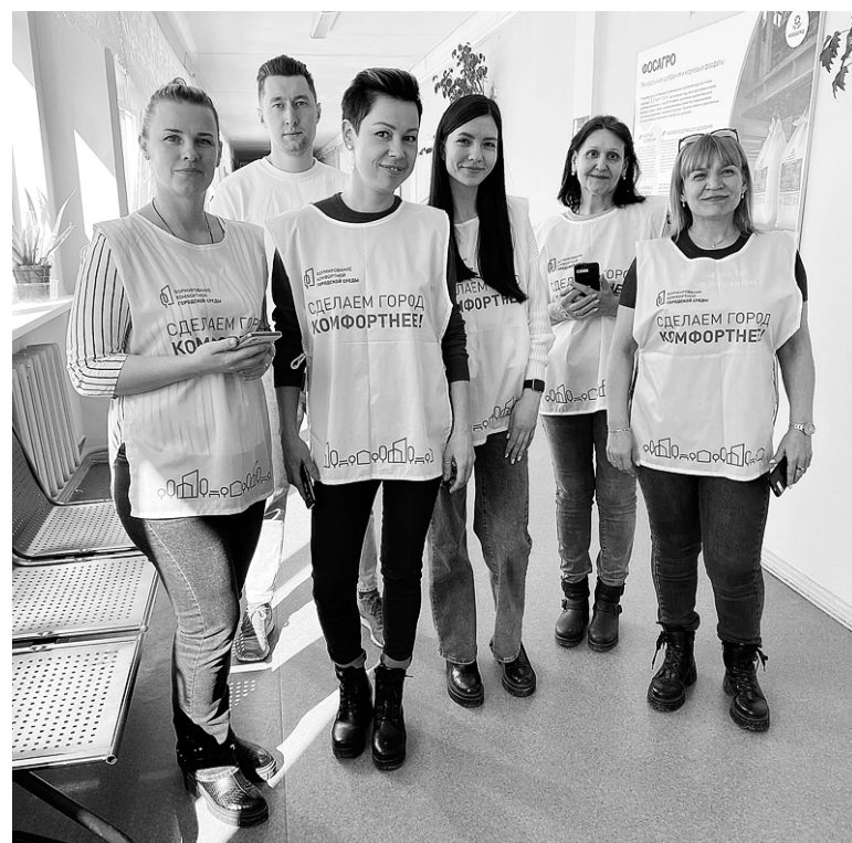
Кировские волонтеры помогут проголосовать в школе, на работе и дома

Выбрать новую территорию, которую также сделают удобной и уютной, кировчане от 14 лет смогут до 31 мая на сайте 51.gorodsreda.ru. Выбрать можно между сквером у кинотеатра «Большевик» и площадкой в районе школы № 10 посёлка Коашва. Всего в