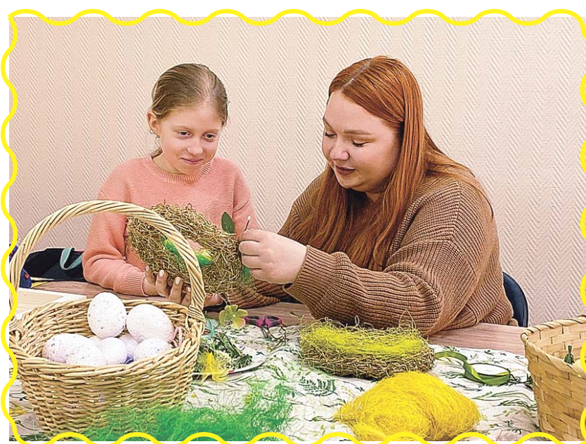
Представители проводят ярмарки, конкурсы и мастер-классы

Мероприятия, которые помогут развитию профессиональных компетенций и обмену опытом в бизнес-сообществе, приурочили к празднованию Дня российского предпринимательства. Официальная дата праздника – 26 мая, но уже с начала апреля бизнесмены организуют различные площадки для презентации своих товаров и услуг, участвуют в программах, где можно