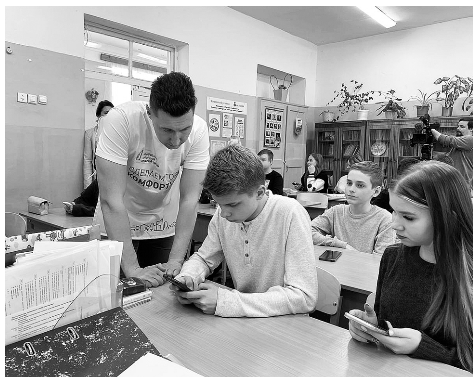
Помочь в процессе голосования – задача волонтеров

Вера НИКОЛАЕВА, фото Татьяны НИКУЛИЧЕВОЙ