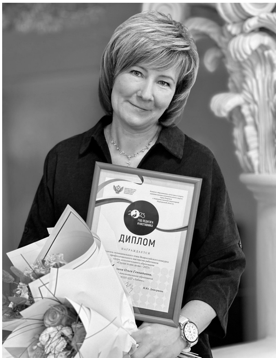
Проект Ольги Булыня нашёл признание и у детей, и у коллег

Вера НИКОЛАЕВА