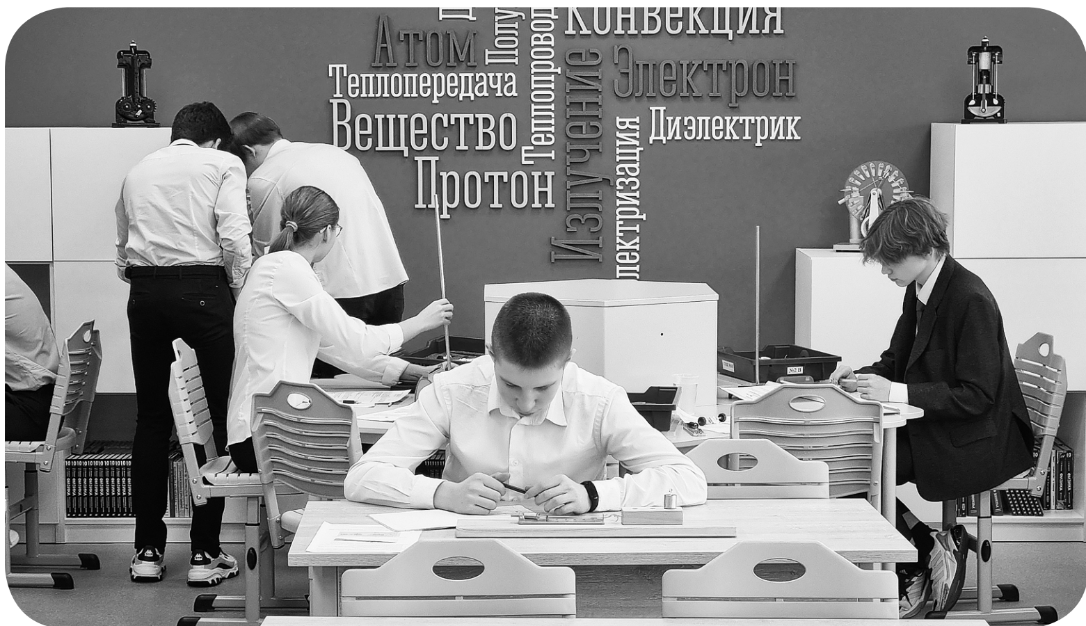
«Уникум» в школе № 10 – обновлённый кабинет физики