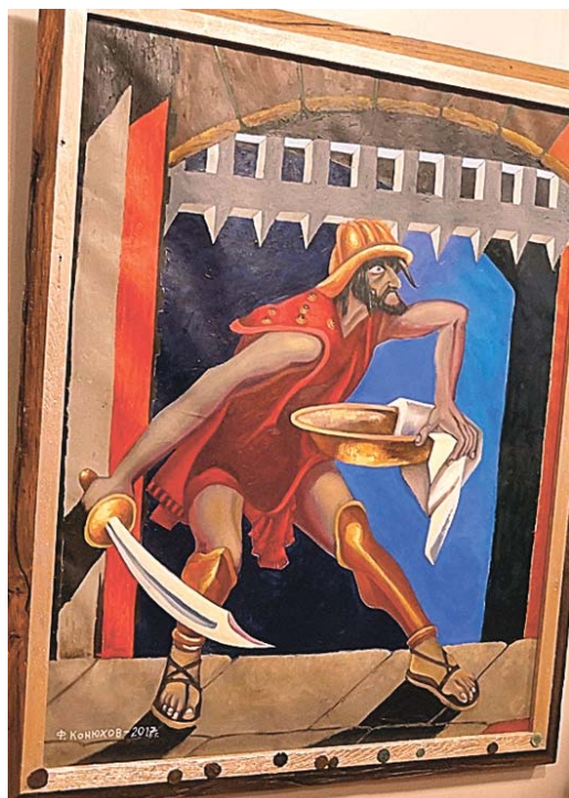
«Воин. Усечение головы Иоанна Крестителя». 2017 г.