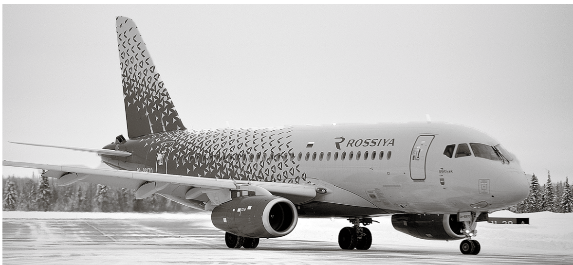
Стоместный «Суперджет» доставит в Питер быстро и, скорее всего, недорого

первого рейса – в Хибинны на 93 процента, отсюда – на 83. И приняли решение выставить ещё один самолёт. В итоге – пять рейсов в неделю на отечественном самолёте «Суперджет-100» со стоместной загрузкой, – сказал он. – Что это даст? В первую очередь, развитие пассажиропотока и турпоточка: сто мест в день – это потенциально 25 тысяч кресел в течение года при пяти рейсах в неделю. Стоит учесть, что широкая маршрутная сеть даёт возможность прилететь не только из Питера, но привезти туристов с нескольких десятков направлений: 24 зару-