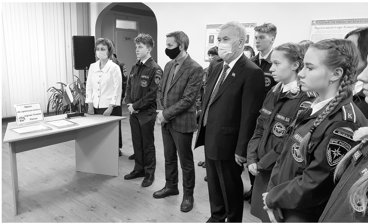
Рассказывать новым поколениям о героическом прошлом своей страны – лучшее патриотическое воспитание