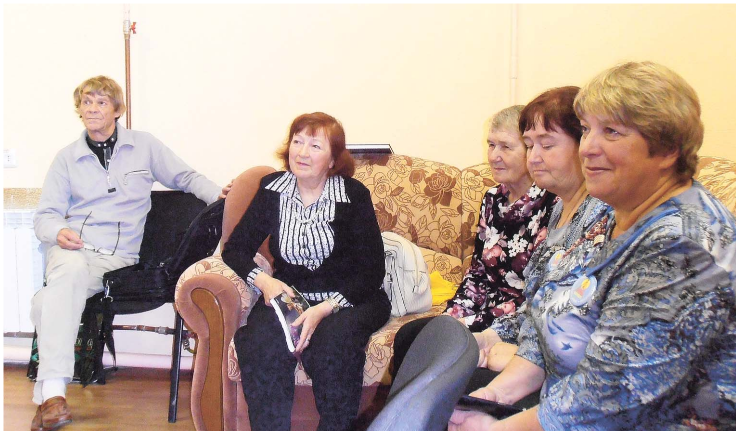
На традиционных чтениях ЛИТО «Алаш».