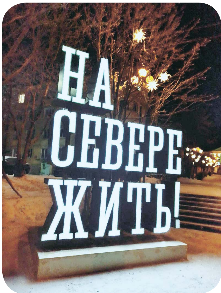
Светящаяся фоторамка со знакомым всем девизом