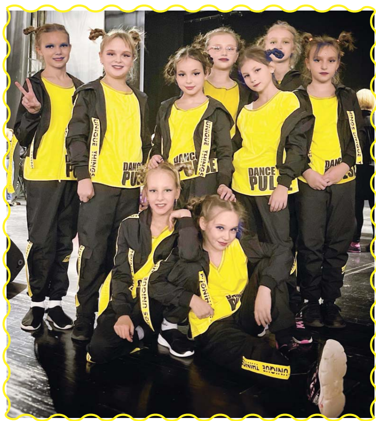
Юные участницы студии «PulseGold» выступили с танцем «Тролли»