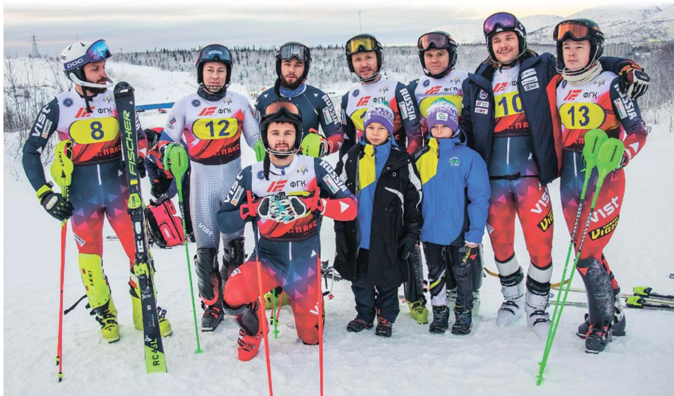
Юные зрители Кубка России смогли не только наблюдать за лучшими горнолыжниками, но и сделать с ними памятные фотографии.

Кировск. Здесь проходит первый этап Кубка России по горным лыжам.