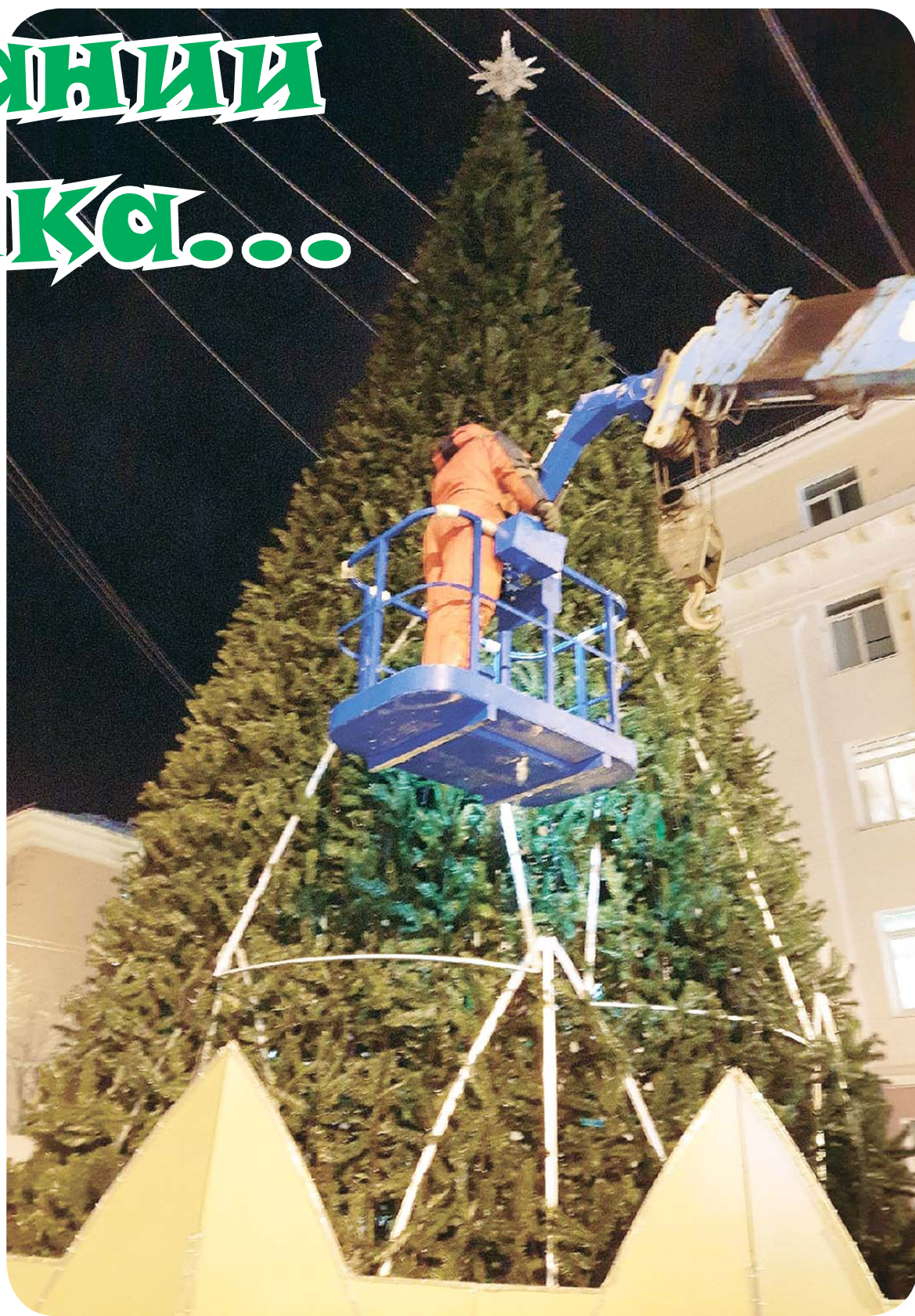
На зелёную красавицу повесят и гирлянды, и шары

Украшения, которые устанавливали в городе раньше, по-прежнему будут радовать жителей: на крыльце Дворца культуры установят лихую