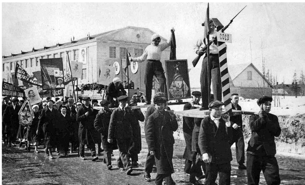
Демонстрация 1 Мая. 1937 г.

Материал подготовила Татьяна ПИВОВАРОВА, ведущий архивист государственного архива Мурманской области в г. Кировске