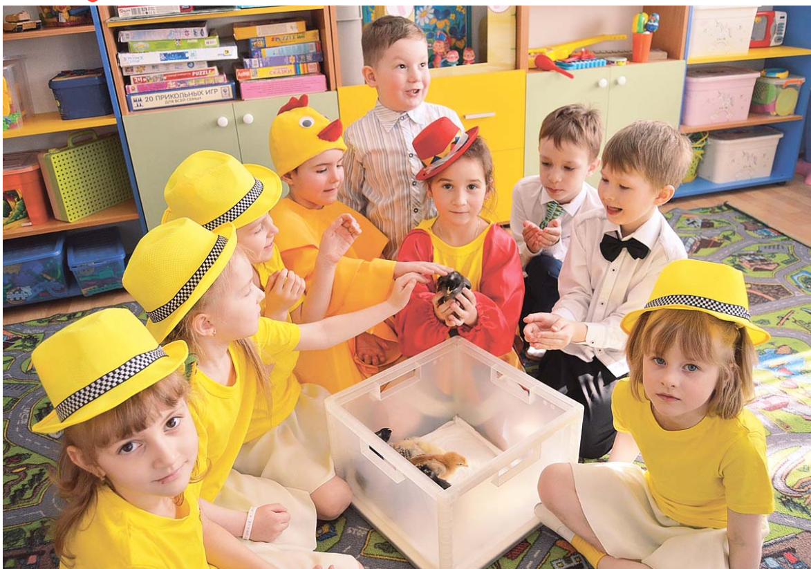
Юные исследователи теперь знают о цыплятах больше, чем иной взрослый

За месяц, что шёл проект, дети узнали о курицах и яйцах больше, чем многие из нас, взрослых горожан – с помощью педагогов и родителей, конечно. Ну, а самое главное – своими глазами увидели, как работает инкубатор, как вылупляются птенчики и какие они крохотные и беззащитные в первые дни жизни. И да – узнали, что из магазинных яиц цыплята появиться не могут,