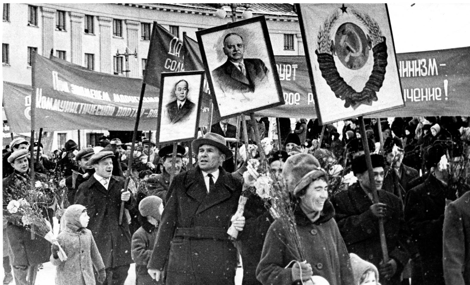
Демонстрация трудящихся Кировска 1 мая 1964 г.

Приближается Праздник Весны и Труда, такое название он получил в 1992 году. В советские годы это был день Интернационала и День международной солидарности трудящихся всех стран. Как его отмечали в Хибинах в разные годы прошлого столетия, рассказывают архивные документы.