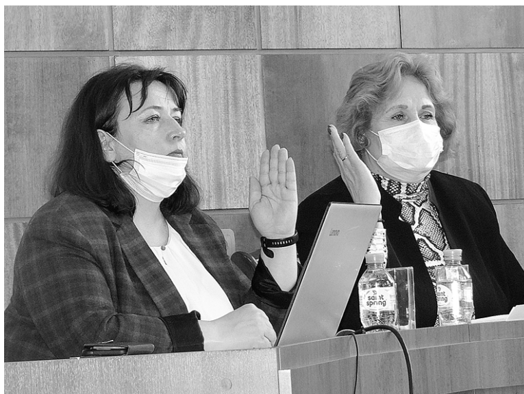
В принятии решений депутаты были почти единодушны

До того как 10 марта в стране ввели мораторий на проведение внеплановых проверок, специалисты ОМК провели 136 таких мероприятий в сфере муниципального земельного