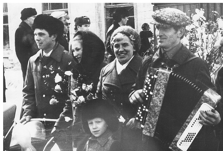
Первомайская демонстрация в Кировске. 1976 г.