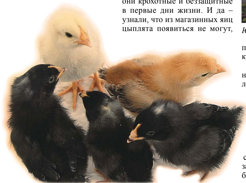
Куриные детки похожи на своих мам, а потому все разные

потому что на птицефабриках куры несут их без петуха.