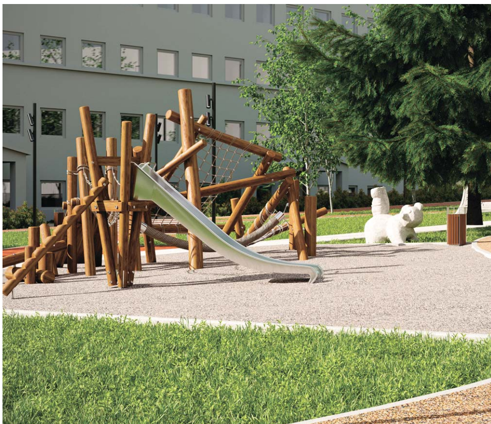
Этот игровой комплекс – безопасный аналог лазания по деревьям