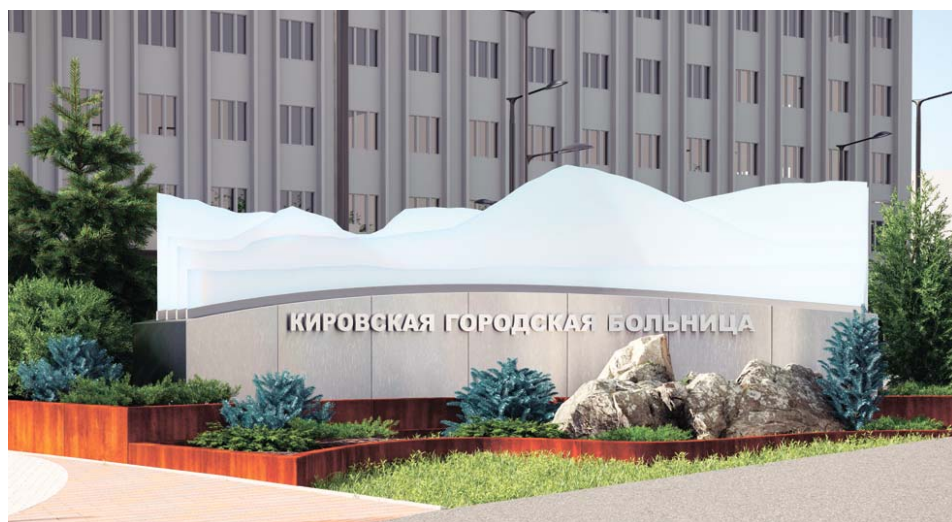
Пример оформления въездной группы

Подготовила Светлана АНДРЕЕВА, иллюстрации из открытого источника