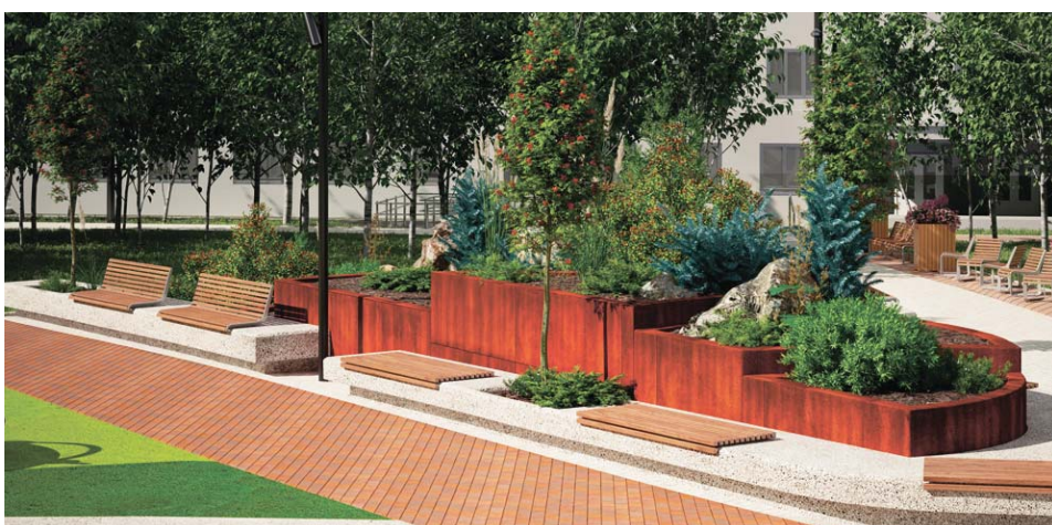
Лавочек в сквере хватит для всех, кто хочет отдохнуть, подышать свежим воздухом и пообщаться