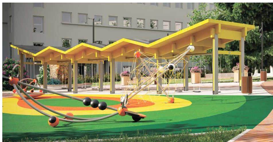
В таком детском городке не будет ссор из-за того, что кто-то дольше катался!