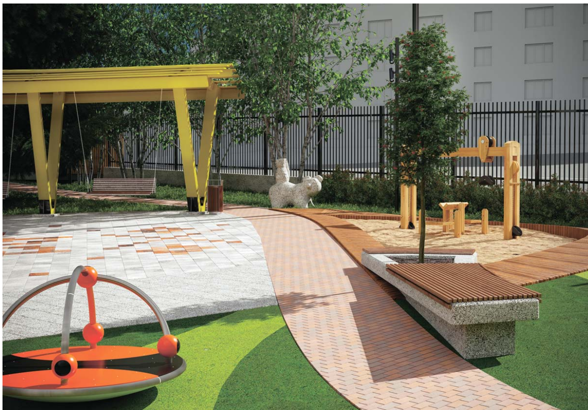
Во всех трёх вариантах благоустройства большое внимание уделено детским игровым зонам