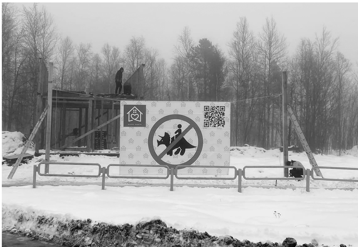
«Катание на трицератопсах запрещено»