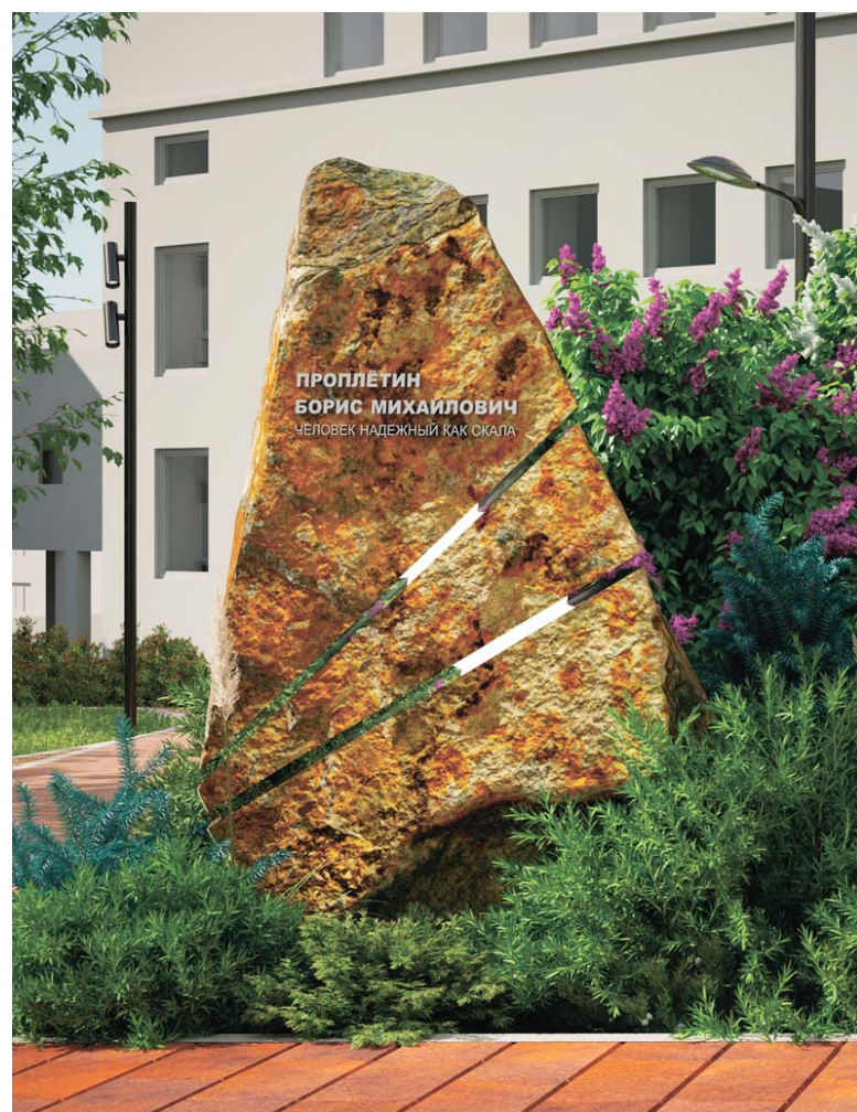
Основополагающий элемент сквера – памятный камень Борису Проплётину