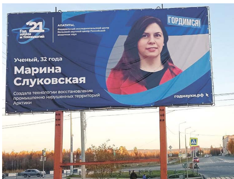
Героев надо знать в лицо

– Увлечения детей меняются с большой скоростью. Сейчас старший сын хочет стать архитектором, а младший – физиком, – рассказала наша