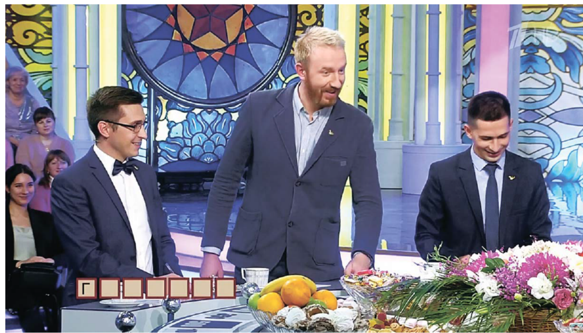
Обстановка на шоу оказалась по-настоящему домашней

– Так и есть. Леонид Якубович перед игрой к нам зашёл, спросил, зачем мы сюда приехали. Мы по-честному ответили, что хотели повидаться, потому что конкурс в 2019 году сдружил участников, до сих