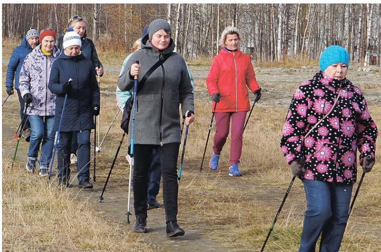
Ходьба – спорт для любого возраста

Участники двинулись в путь, шагая и двигая руками «по науке», восхищаясь осенним днём, выглянувшим солнцем и поразительно красивым притихшим лесом вдоль «Тропы здоровья». Поскольку само ме-