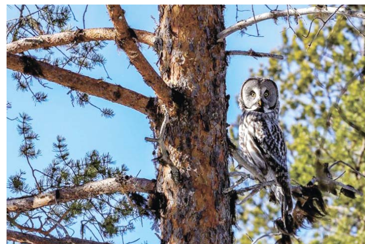
Бородатая неясыть. На страже гнездового участка

Кировск. В центральной городской библиотеке имени Горького работает традиционная ежегодная передвижная фотовыставка «В объективе Лапландский заповедник – 2021». Каждый посетитель сможет виртуально посетить потаённые уголки прекрасной и нетронутой природы Лапландского заповедника, увидеть мир флоры и фауны Заполярья. Все фотографии сделаны сотрудниками заповедника на охраняемой территории. Сотрудники библиотеки предлагают также участвовать в конкурсе на выбор лучшей фотографии. Результаты конкурса будут переданы в Лапландский заповедник. Посмотреть фотоальбом можно на страничке Центральной городской библиотеки им. А.М. Горького соцсети «ВКонтакте».