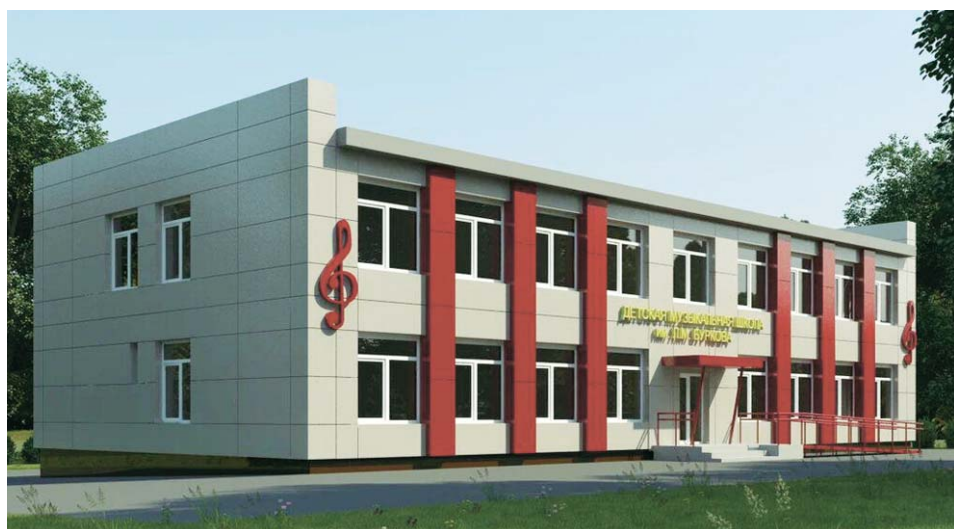
Так будет выглядеть здание школы после ремонта