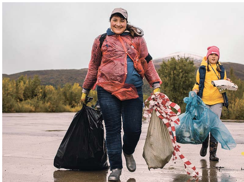
Мусор азартно собирали и сортировали, несмотря на погоду!

Апатиты. – Кировск «Чистые игры» – субботник в виде соревнований – собрали полторы сотни экологов на берегу Имандры.