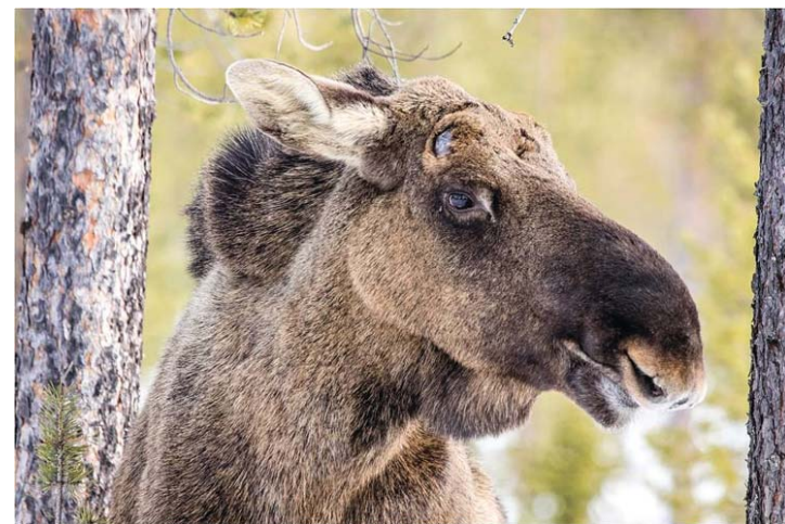
Лось. Молодой бычок-сеголеток