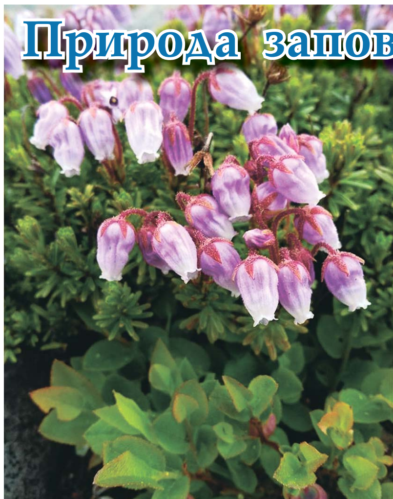
Филлодоце голубая. Массовое цветение

Кировск. В центральной городской библиотеке имени Горького работает традиционная ежегодная передвижная фотовыставка «В объективе Лапландский заповедник – 2021». Каждый посетитель сможет виртуально посетить потаённые уголки прекрасной и нетронутой природы Лапландского заповедника, увидеть мир флоры и фауны Заполярья. Все фотографии сделаны сотрудниками заповедника на охраняемой территории. Сотрудники библиотеки предлагают также участвовать в конкурсе на выбор лучшей фотографии. Результаты конкурса будут переданы в Лапландский заповедник. Посмотреть фотоальбом можно на страничке Центральной городской библиотеки им. А.М. Горького соцсети «ВКонтакте».