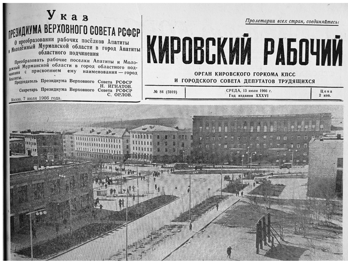
«Вот он, новорождённый город Апатиты! Площадь А.Е. Ферсмана». Фото В. РЕЗНИЧЕНКО, 1966 г.

Указ ПРЕЗИДИУМА ВЕРХОВНОГО СОВЕТА РСФСР О преобразовании рабочих посёлков Апатиты и Молодёжный Мурманской области в город Апатиты областного подчинения Преобразовать рабочие посёлки Апатиты и Молодёжный Мурманской области в город областного подчинения с присвоением ему наименования – город Апатиты. Председатель Президиума Верховного Совета РСФСР Н. ИГНАТОВ. Секретарь Президиума Верховного Совета РСФСР С. ОРЛОВ. Москва, 7 июля 1966 года.