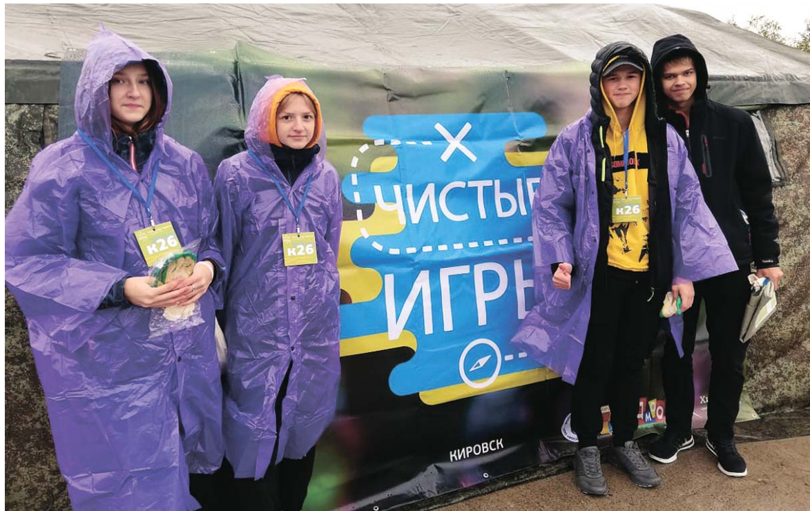
Памятные подарки получили все участники эко-игр

Ольга ИЛЬНИЦКАЯ, Вера НИКОЛАЕВА